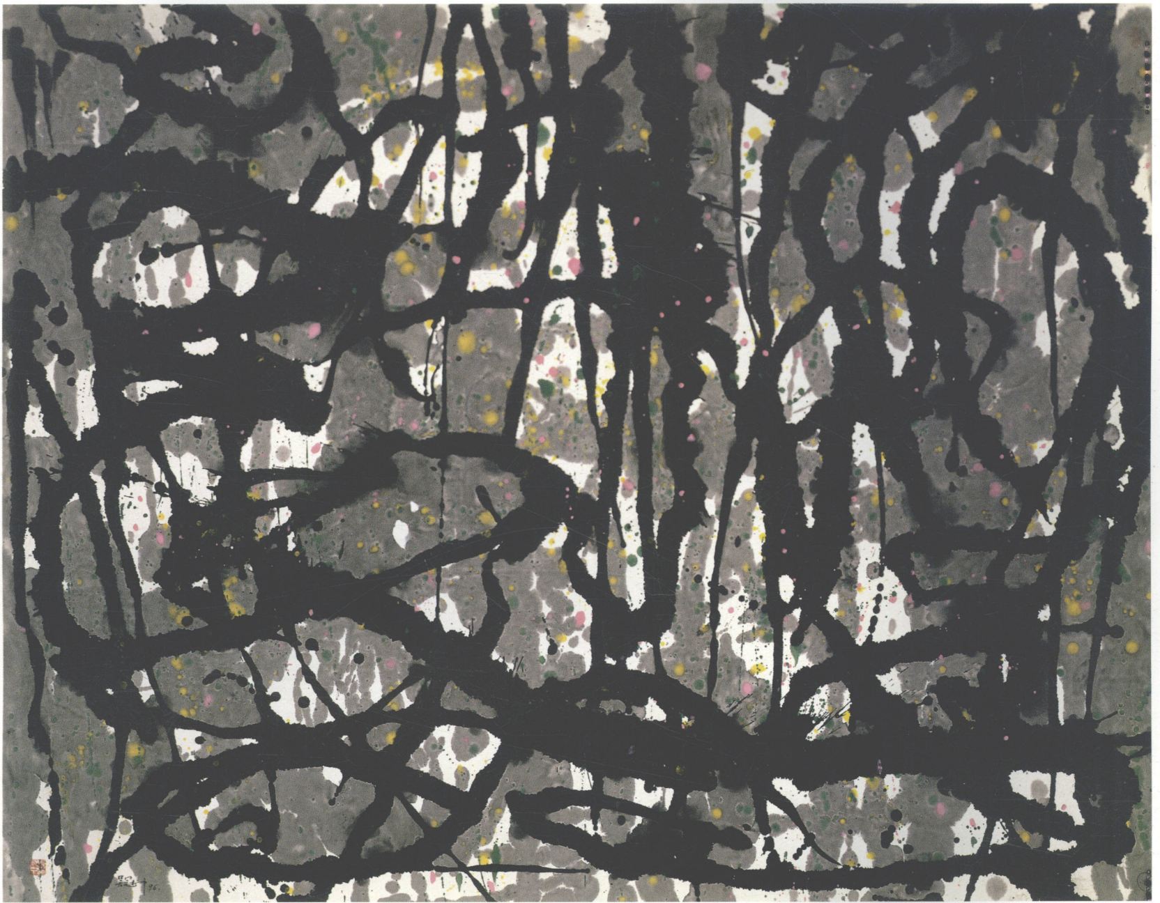
书画缘 墨彩 140cm × 180cm 1997年