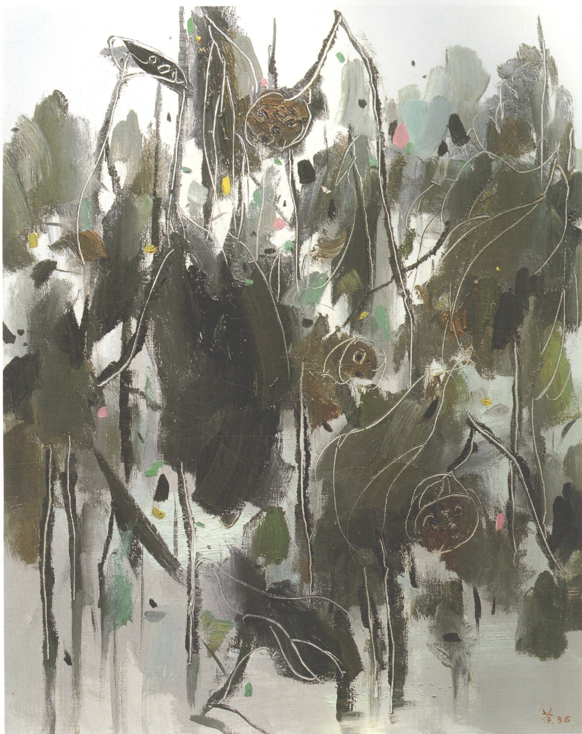
荷塘春秋 油彩 92cm × 73cm 1996年