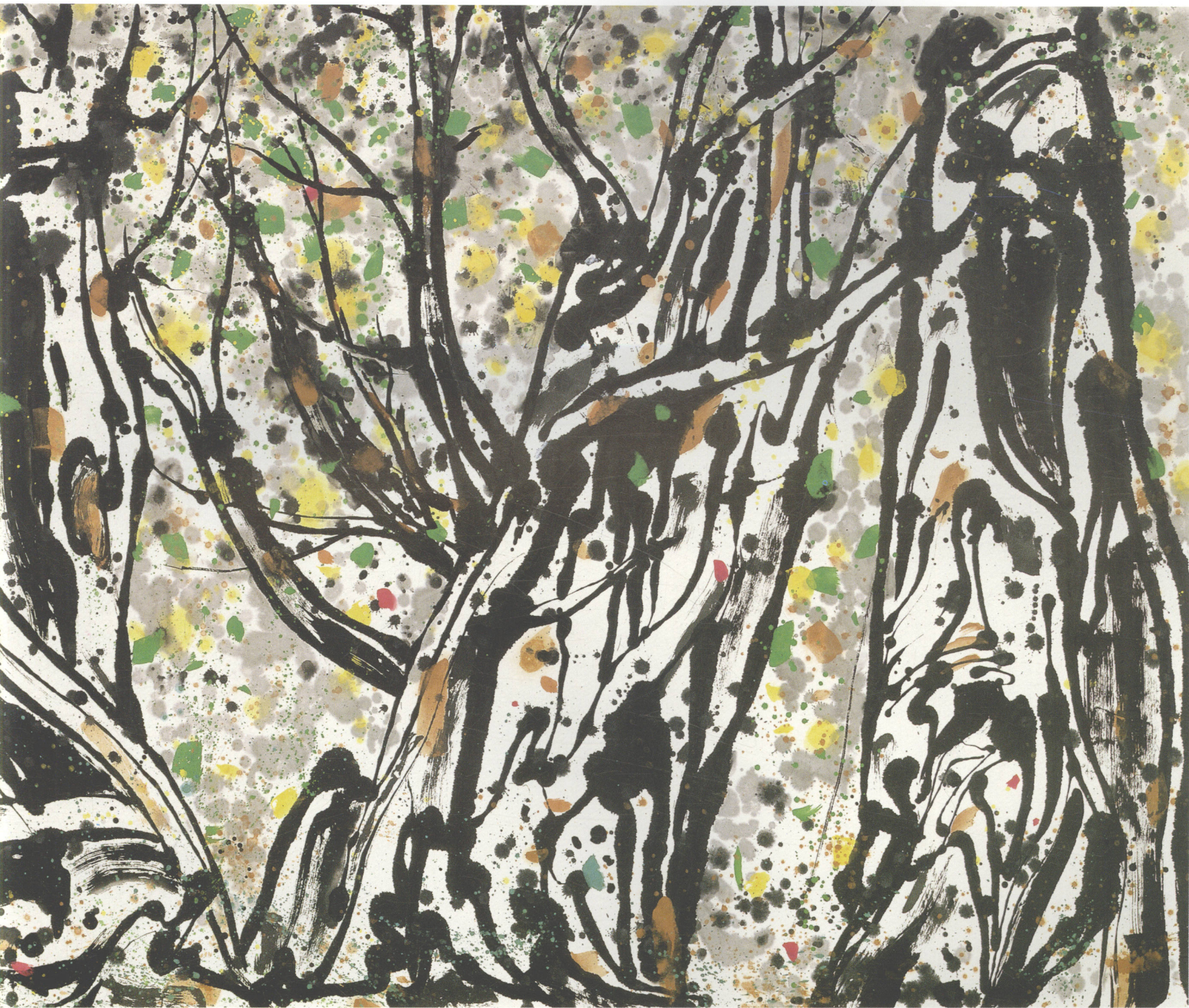
根扎南国 墨彩 145cm × 348cm 1998年

粗壮身段偏扭曲，似闻嬉笑怒骂，又疑加莱义民之写照。是耶非耶，实为南国榕树，根扎深度难计量。