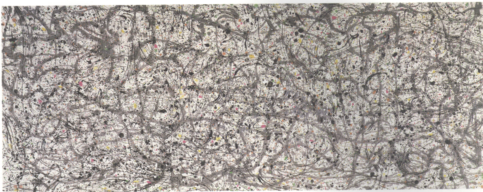
逍遥游 墨彩 145cm × 368cm 1998年