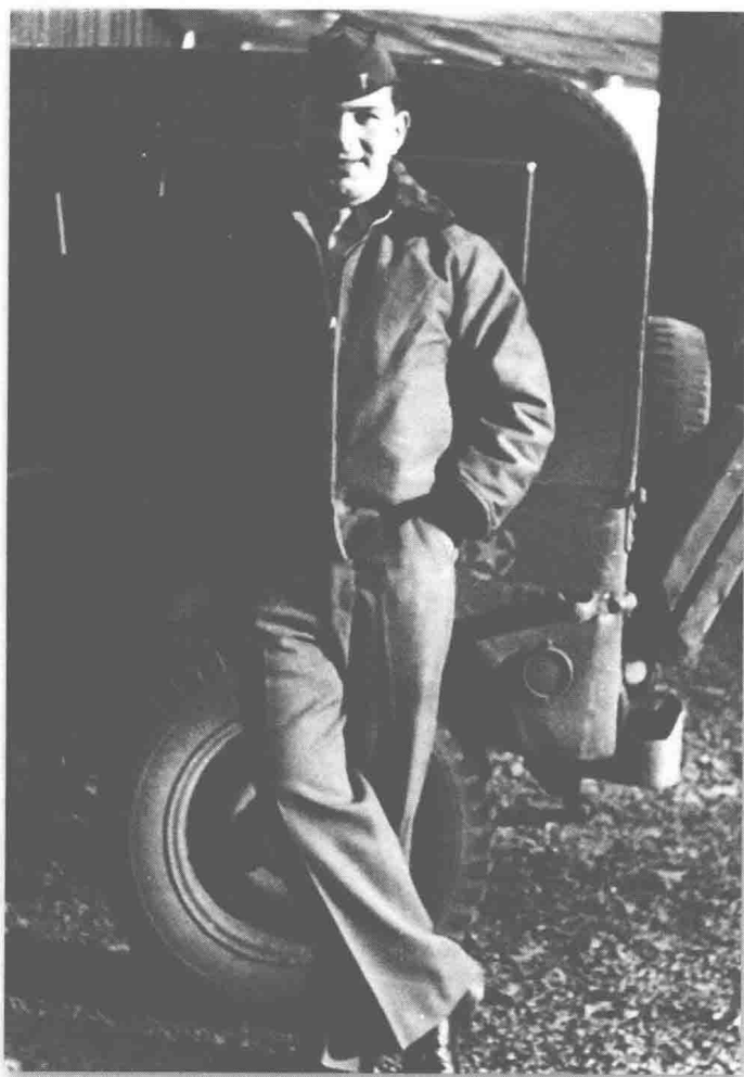
(图 2) 1945 年，第二次世界大战结束后不久，位于法兰克福