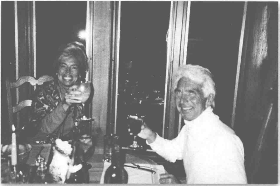
(图 12) 格瑞丝和我，位于罗马，1993 年，“重聚”之后不久