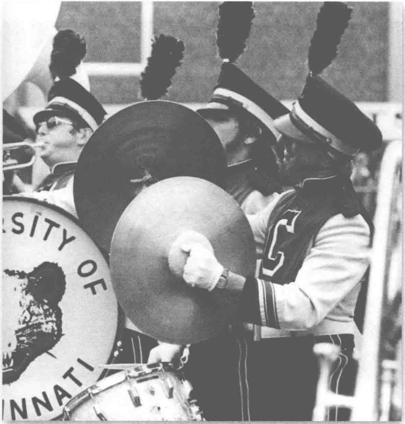
(图8) 和辛辛那提大学军乐队在一起的轻松一刻