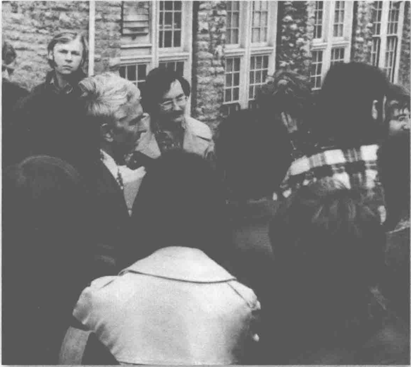
(图7)担任纽约州立大学水牛城分校教务长期间，跟沮丧烦躁的学生谈话，后来我的办公室被围得水泄不通