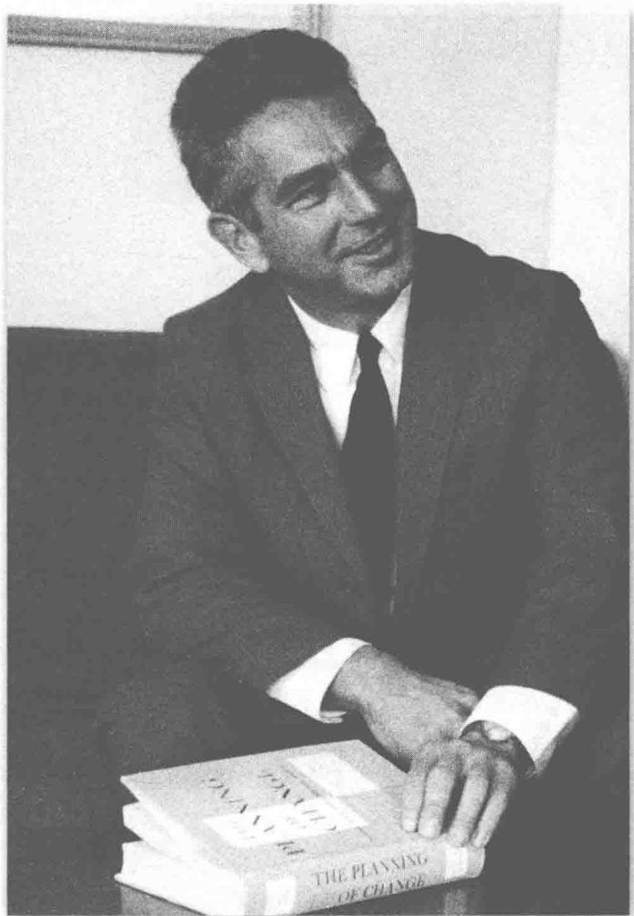
(图4) 位于麻省理工学院，我的第一本书《改变之计》，1961年