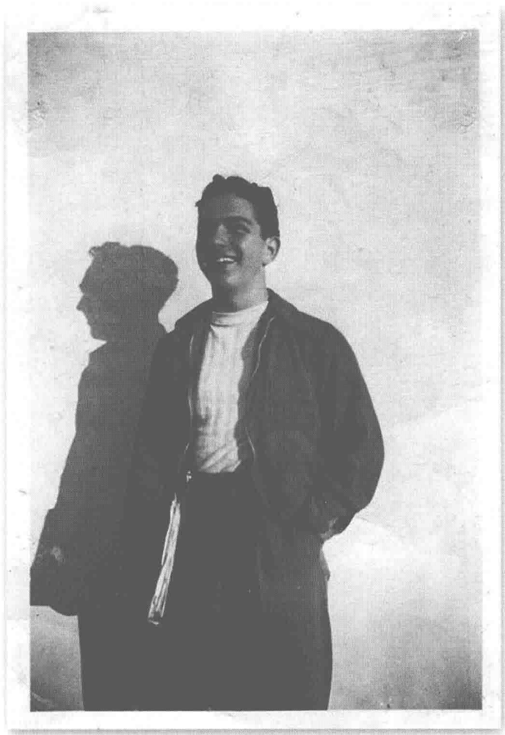
(图1)站在我父亲经营的酒铺前，这家酒铺位于洛杉矶中南部 时年我16岁左右，1941年