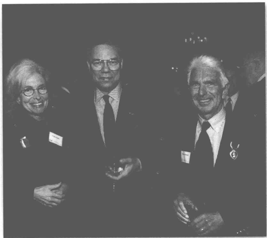
(图 13) 和科林·鲍威尔，大约在 20 世纪 90 年代中期