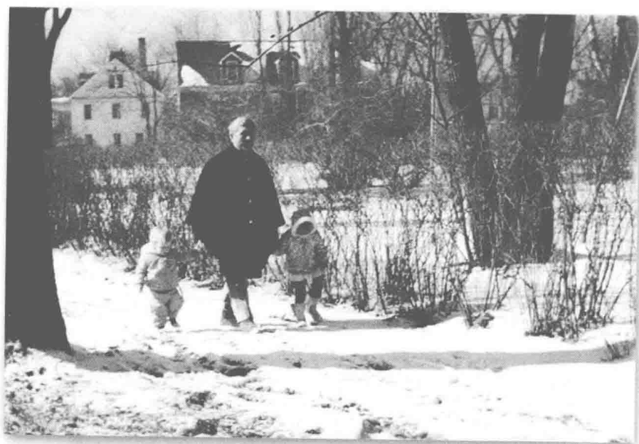
(图6) 在水牛城的家外面