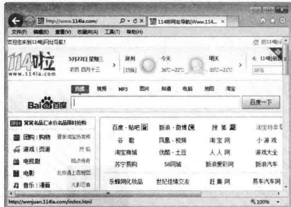
图 1-1 网站网页

网站主页与首页的区别在于：主页设有网站的导航栏，是所有网页的链接中心。但多数网站的首页与主页通常合为一个页面，即省略了首页而直接显示主页，在这种情况下，它们指的是同一个页面，如图 1-3 所示。