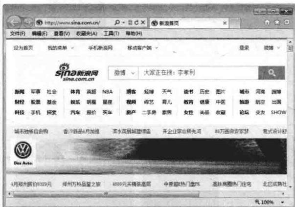
图 1-3 网站首页