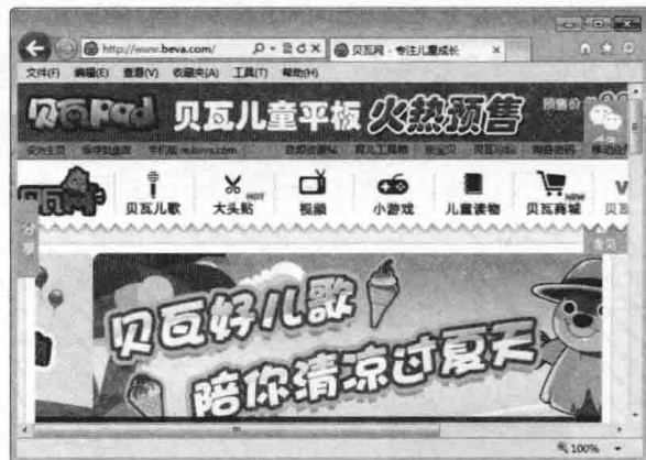
图 1-2 网站主页