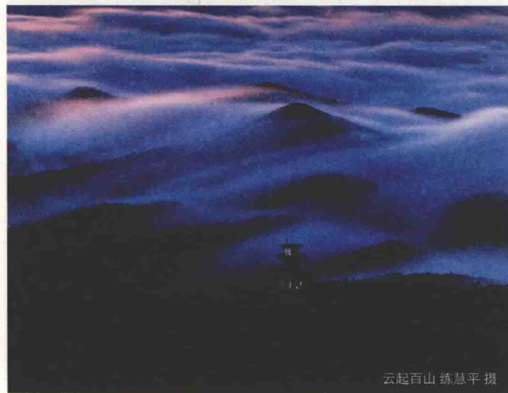
云起百山