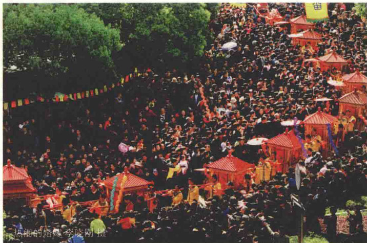
热闹婚礼

该基地由大均乡大均民俗村、鹤溪镇封金山、惠明寺畲族民俗村，茶文化及大说乡大说村古村落文化构成。大均村位于景宁县城西南 20 多公里，村中有畲族婚俗演示、瓯江支流——大均溪漂流等项目，沿途山水民舍交相辉映；封金山距县城 7 公里，是畲民迁入浙江最早的聚居地，婚俗、饮食、农耕等民俗事项演绎活泼风趣；惠明寺也是浙江畲族入迁发源地之一，惠明茶的原产地，茶文化与畲族文化长期交融，形成了特有的地方文化；大说村位于景宁县城西南 40 多公里，海拔 800 多米，为高山盆地，村中有著名的宋代古寺庙时思寺，为全国文物保护单位，周围有千年古柳杉、古柏、古民居等，村边还有雪花说等景观，集古建筑、古民居和生态、风光于一体。