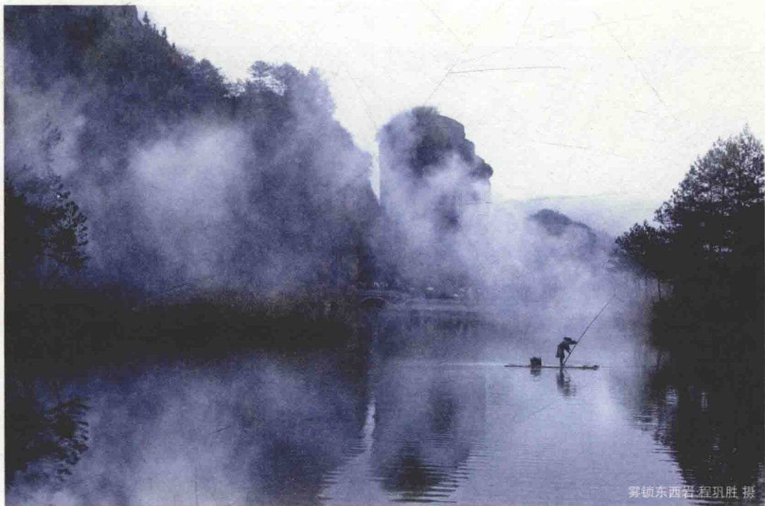
雾锁东西岩

莲都区老竹畲族镇，距丽水市区约 30 公里。区内有著名的东西岩景区，东岩洞穴奇特，山崖险峻，西岩石峰高耸，石窟幽深……。景区与周边的畲族村落紧密相连，使奇异的自然风光和畲族民俗风情有机融合，具有浓厚畲族文化特色。