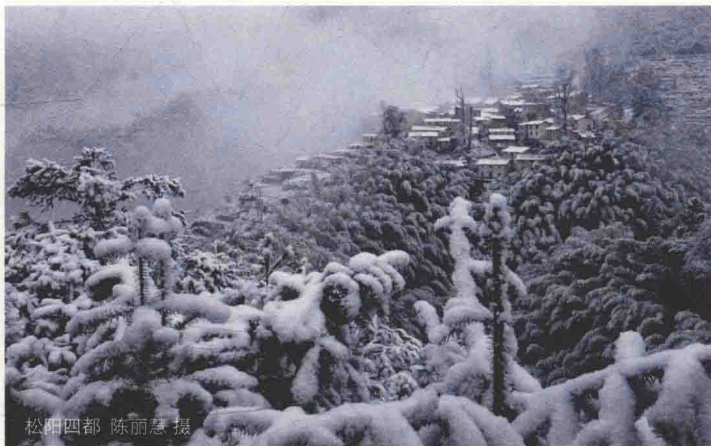
松阳四都

松阳县四都境内山地层叠，奇峰屹立，地层参差，构造复杂。境内群山皆属仙霞岭山脉，境内有全长 2343 米的寨头岭隧道贯穿，地貌层次明显，类型多样，全年半山处有四分之三时间被大雾笼罩，形成了少有的高山云海壮观景象。