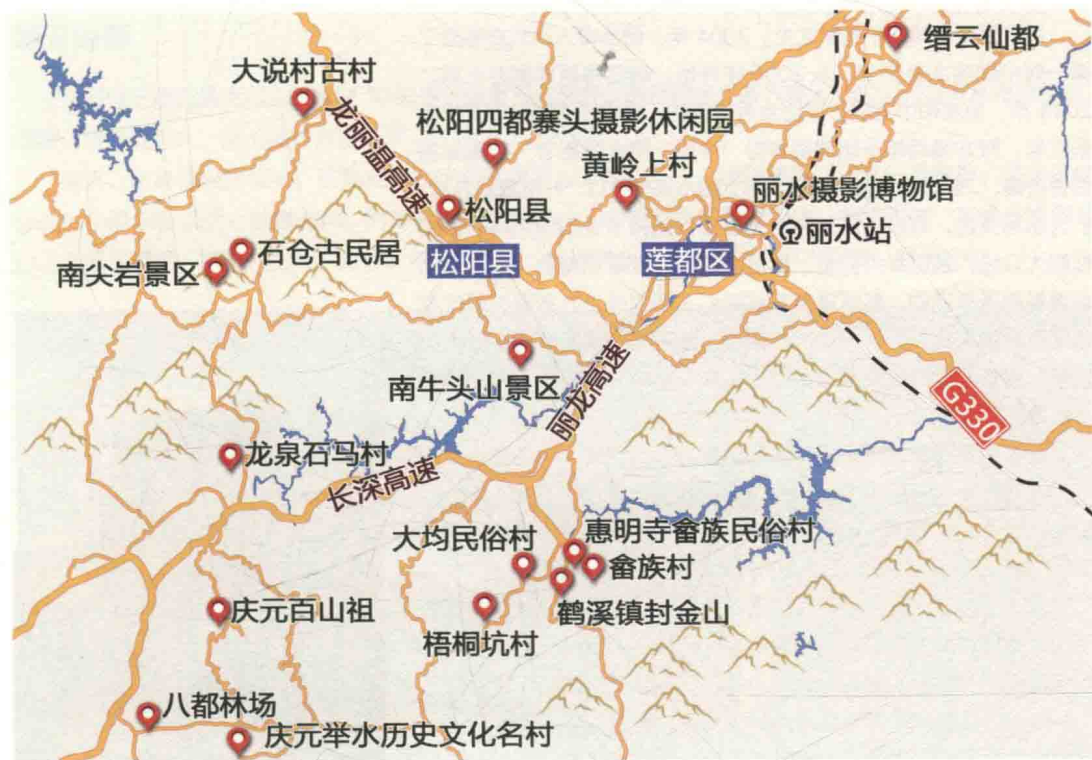
丽水景区拍摄点分布图