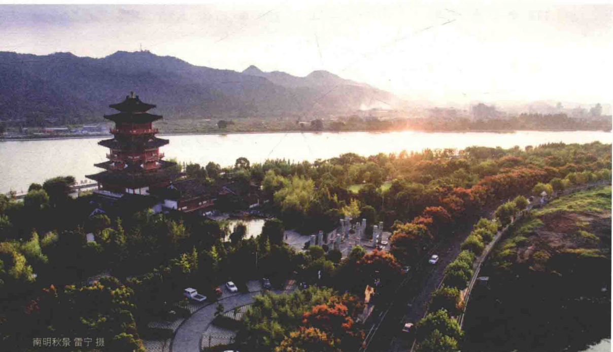
南明秋景