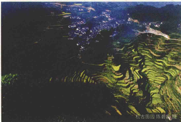
松古田园