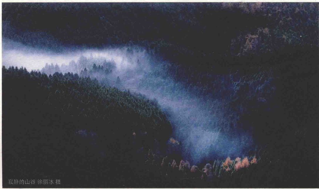
寂静的山谷

梧桐坑村沿溪两旁高山耸立，大部分山峰高度在 1000 米以上，山峦起伏，悬崖峭壁，怪石嶙峋，磊落擎空，极为壮观。鲤鱼际、接鱼穴、金坑源等自然景观具有“斜阳远近山，竹林掩低屋”之感，还有着浓厚的畲族风情和活跃的群众体育。