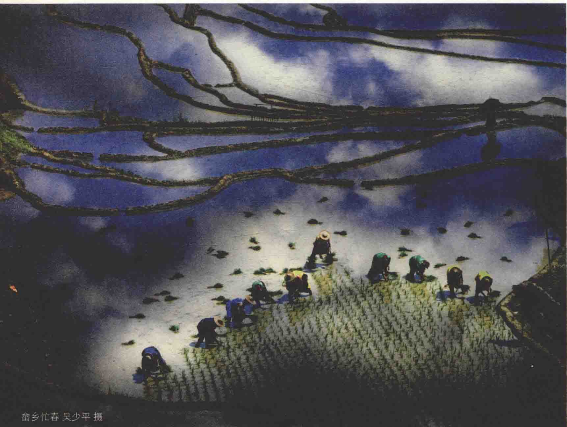
畲乡忙春

青田县城西南 30 多公里，330 国道及瓯江干流从景区穿过。景区内“石门飞瀑”“历代摩崖碑刻”、刘基祠，刘基读书处“国师床”“藏书石室”等遗迹，文化内涵极为丰富。石门洞紧临瓯江，山清水秀，环境十分优美。