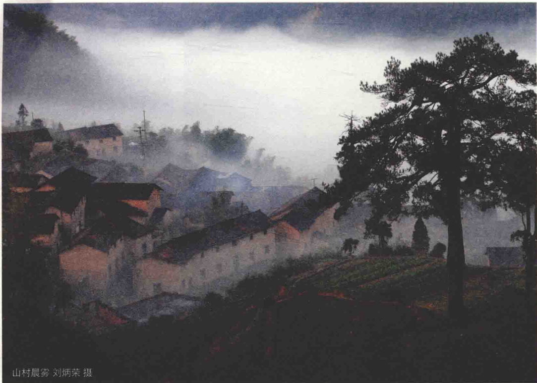
山村晨雾