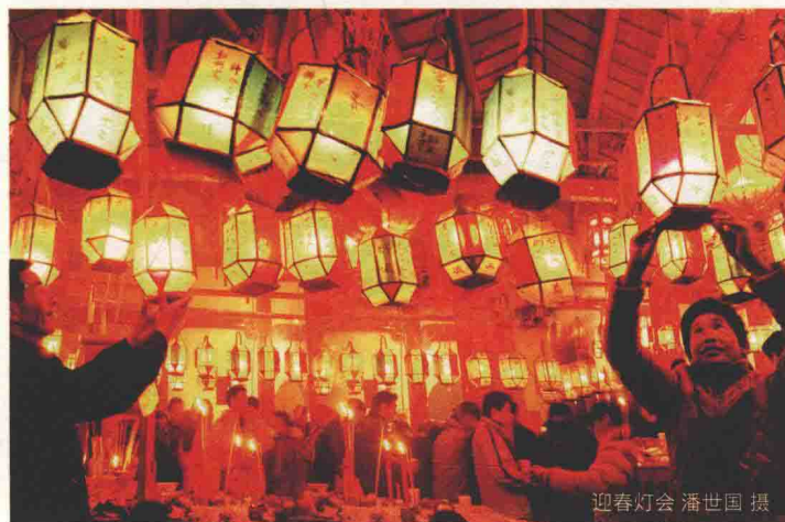
迎春灯会

松阳县大东坝镇石仓古民居、安民乡箬寮原始森林等景点，距县城 25 公里。石仓清式古民居群规模大，布局自然，民俗活动活跃，文化内涵丰富；箬寮原始森林地处高山，生态最优，素以花绝、树奇、山险、岩怪、潭幽、瀑美、泉清、云丽而著称。