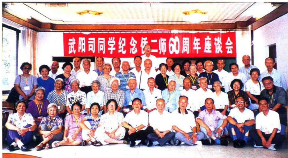
参加武阳司同学纪念母校60周年座谈会全体合影

小瀛洲度假村与大夫山森林公园毗邻，处在群山环抱之中，掩映在苍翠欲滴的茂林深处，散落着一幢一幢的琼楼玉宇，一条白色长廊贯穿其间，平湖绿水，亭台楼阁，不是仙境却似仙境。我们参谒完母校纪念碑后入住这人间仙境，在明亮