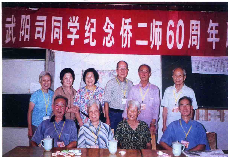
第二届校友纪念母校60周年聚会

曲等等，都表演得淋漓尽致，令人前仰后合，捧腹大笑，在欢快的气氛中，大家尽情享受到了大团圆的幸福。