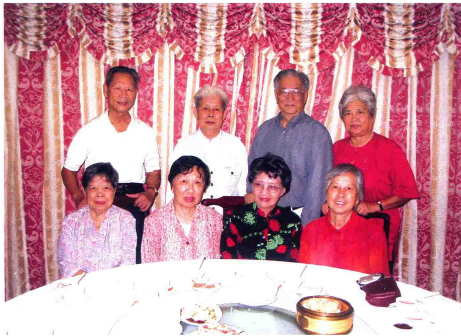
深圳校友纪念母校60周年于10月下旬聚会