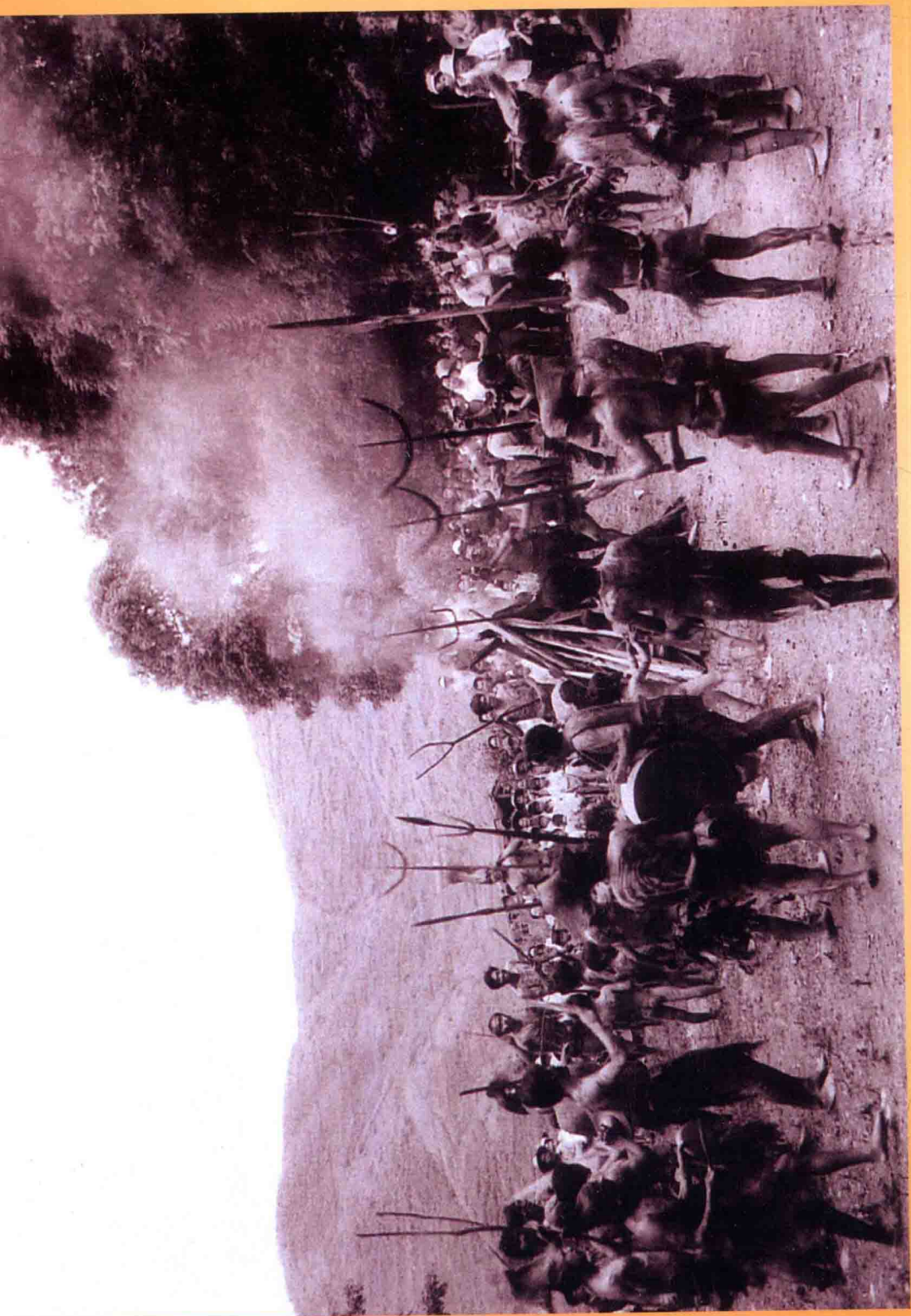
彝 族 祭 火