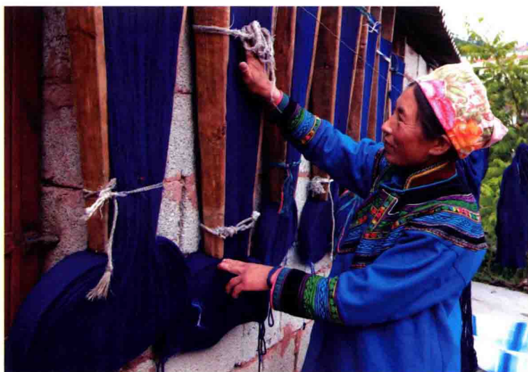
图 15 成品羊毛披毡