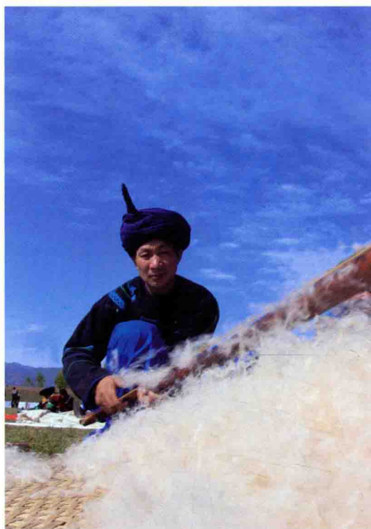
图 12 弹羊毛