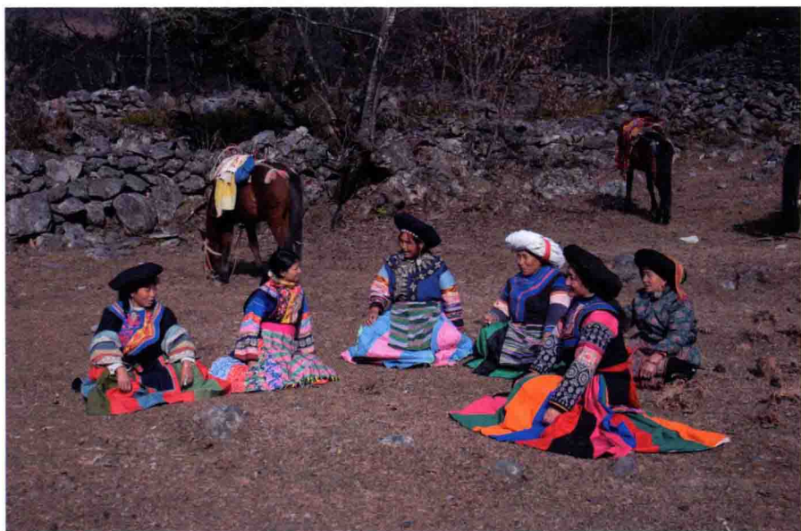
图 23 “藏族赶马调”传习活动