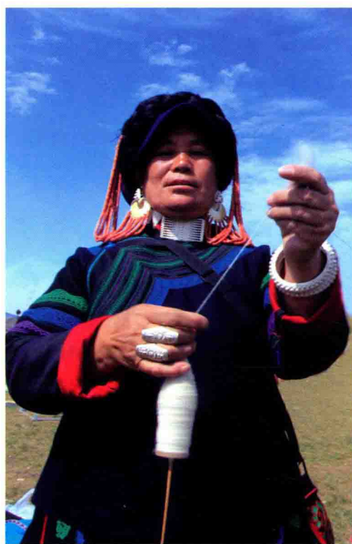
图 16 捻线