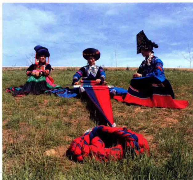
图 17 羊毛纺织