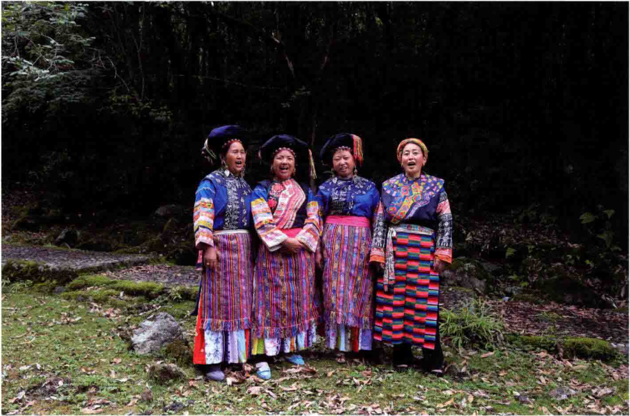
图 22 “藏族赶马调”省州级传承人集体演唱