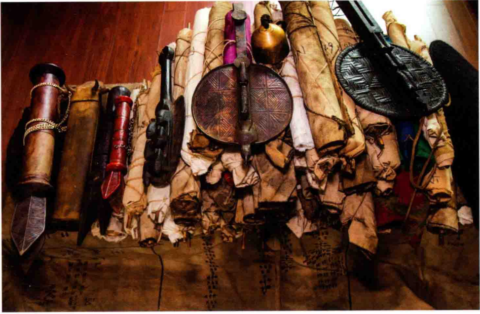
图1 毕摩经书和法具（一）