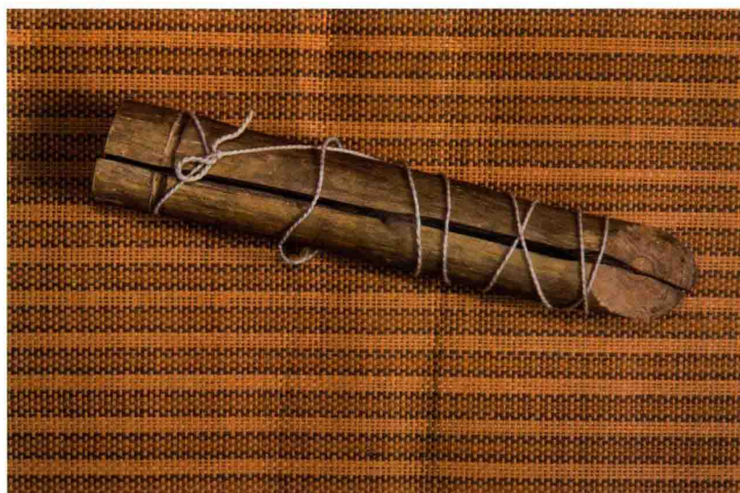
图 11 灵棺