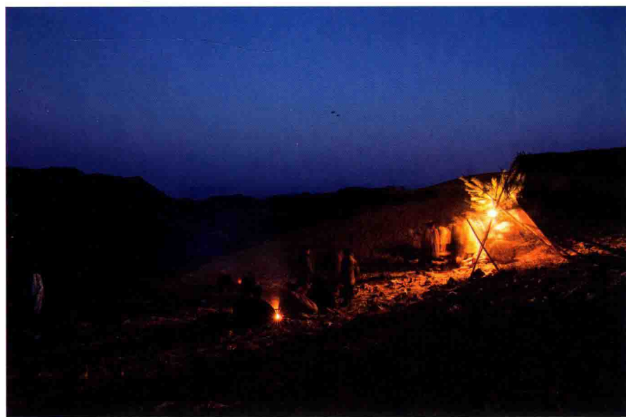
图10 毕丘（野外搭青棚）