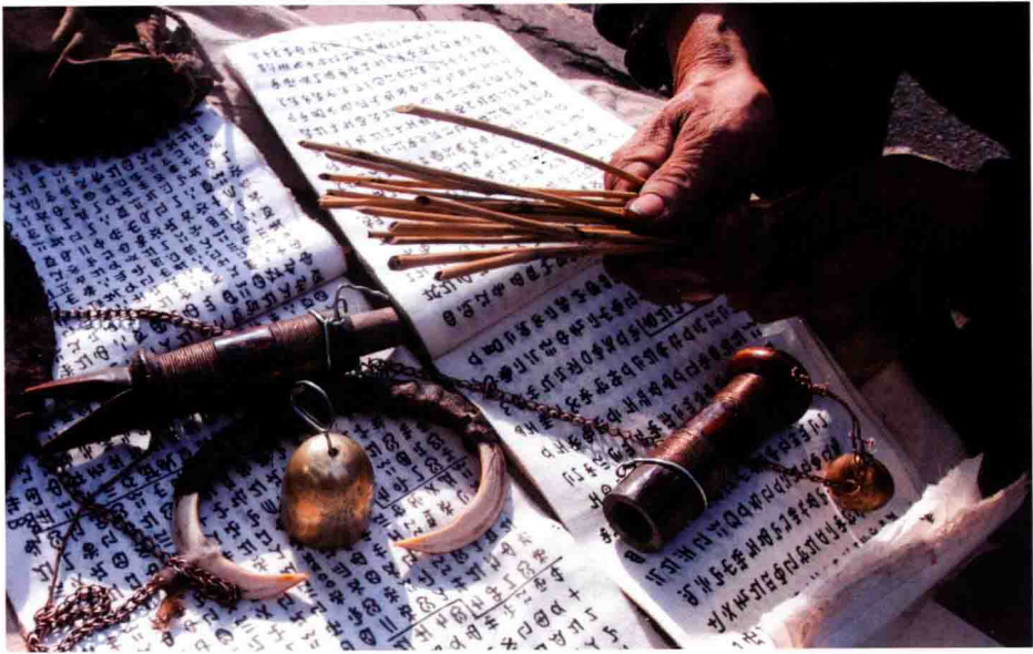
图2 毕摩经书和法具（二）