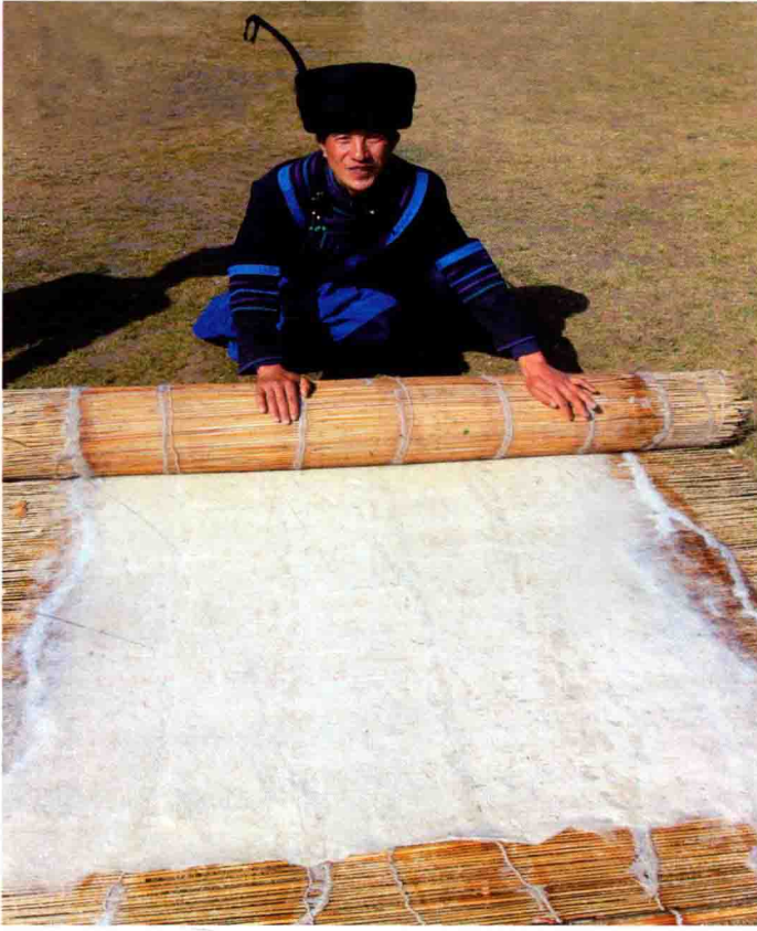
图 13 擀制单层羊毛披毡