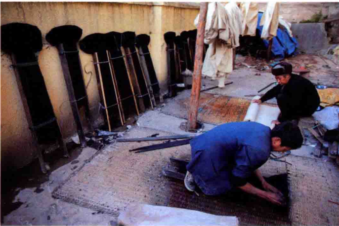
图 14 擀制双层羊毛披毡