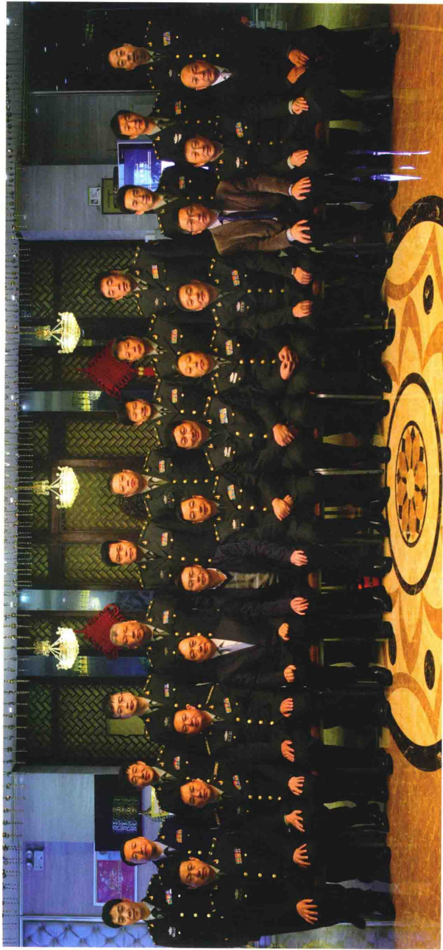
《中华战创伤学》总主编付小兵院士与分卷主编合影