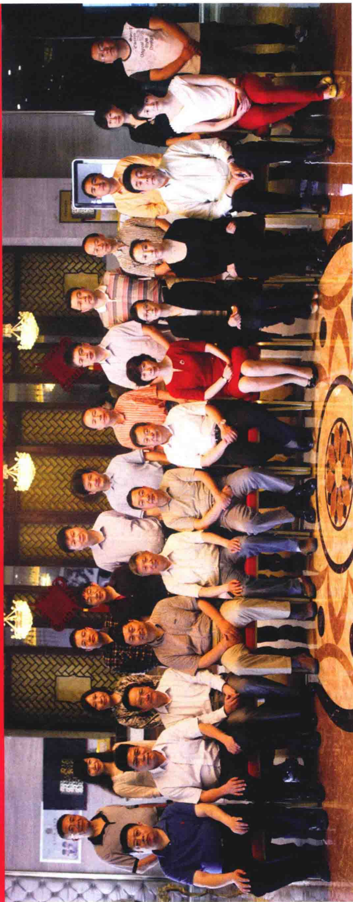
《中华战创伤学》第二次主编会议参会人员合影