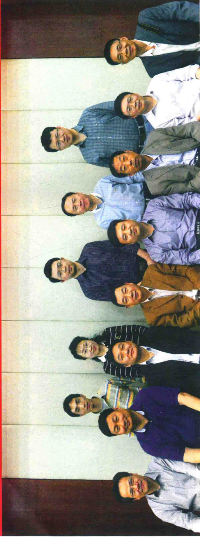
《中华战创伤学》第一次主编会议参会人员合影