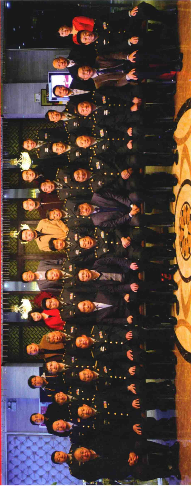
《中华战创伤学》第三次主编会议参会人员合影