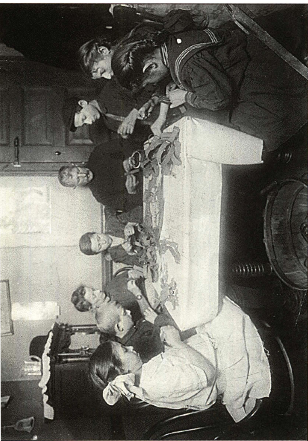
19 世纪 90 年代为生计挣扎的移民家庭