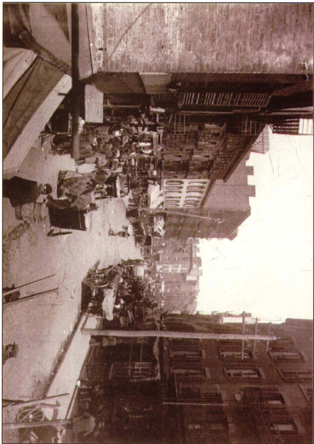
纽约市马尔伯里街拐角处，1889年。