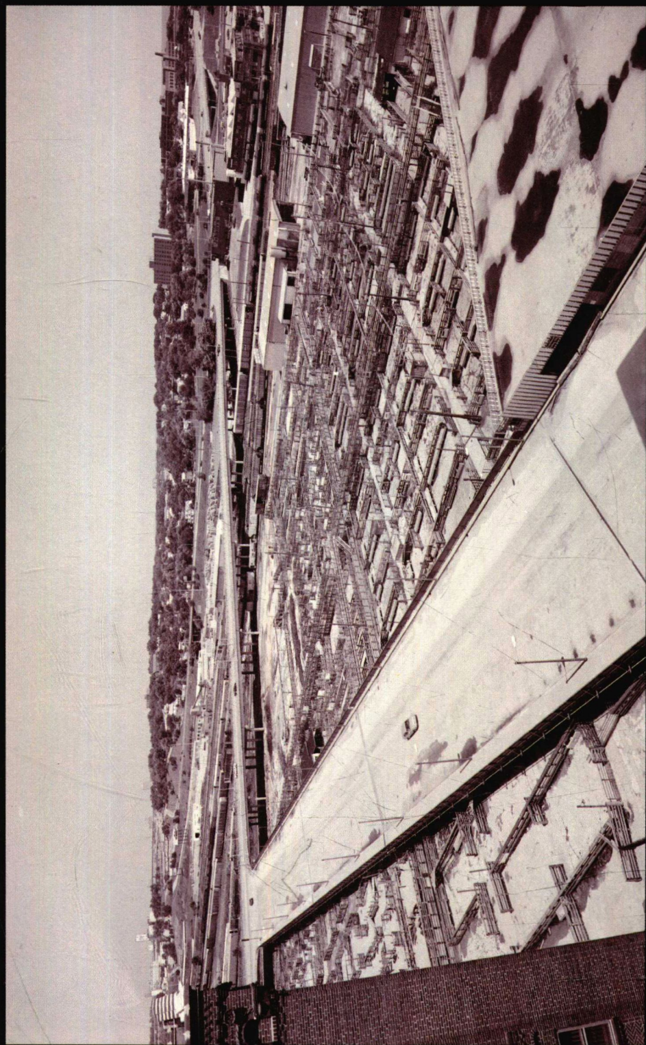
19 世纪里，随着美国边疆不断西移，畜牧业成为前沿产业。这是位于内布拉斯加州奥马哈市道格拉斯县的畜牧场的远景。