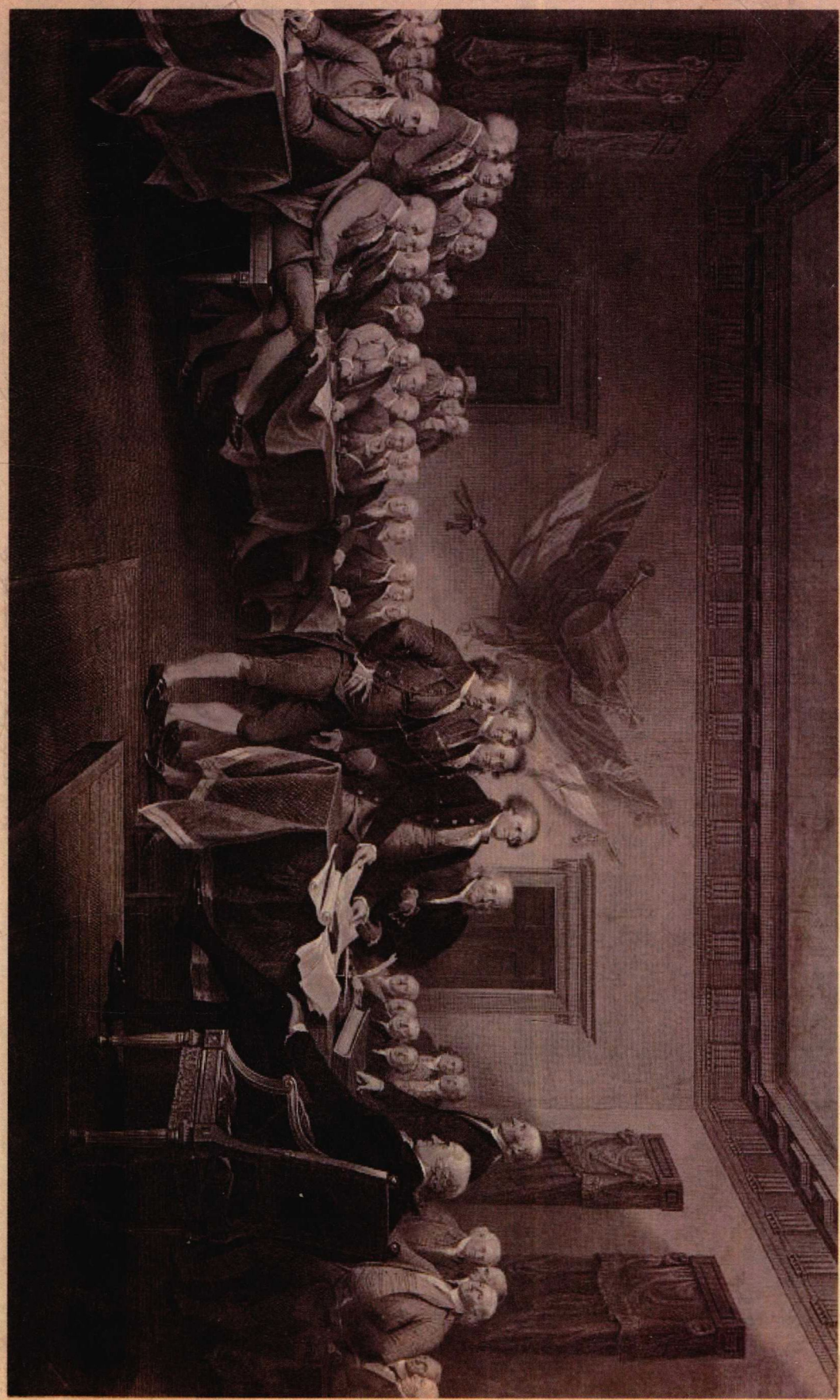
独立宣言（绘画），收藏于美国国会图书馆