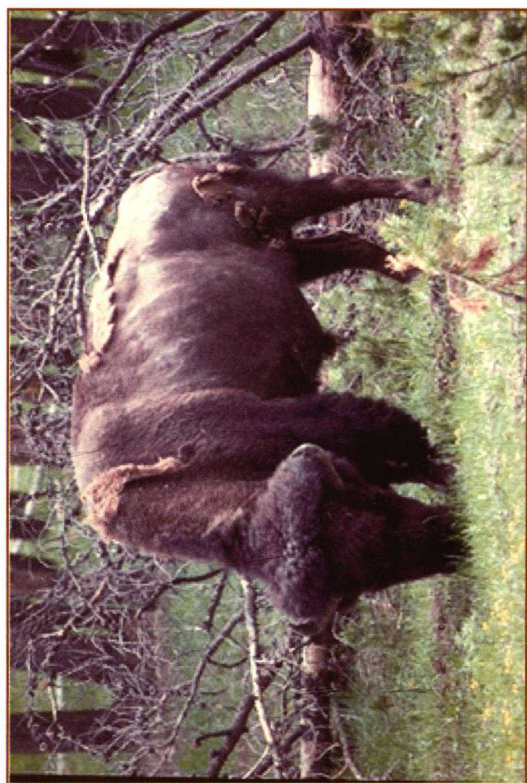
黄石国家公园，1872年建立的第一座国家公园