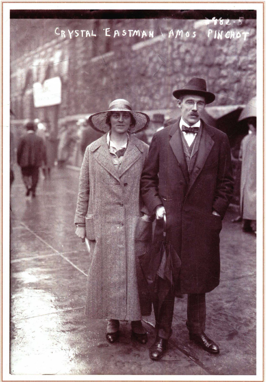
律师、女权主义者克里丝特尔·伊斯门(1881—1928)(左)与律师、进步主义改革者阿莫斯·平肖(1873—1944)