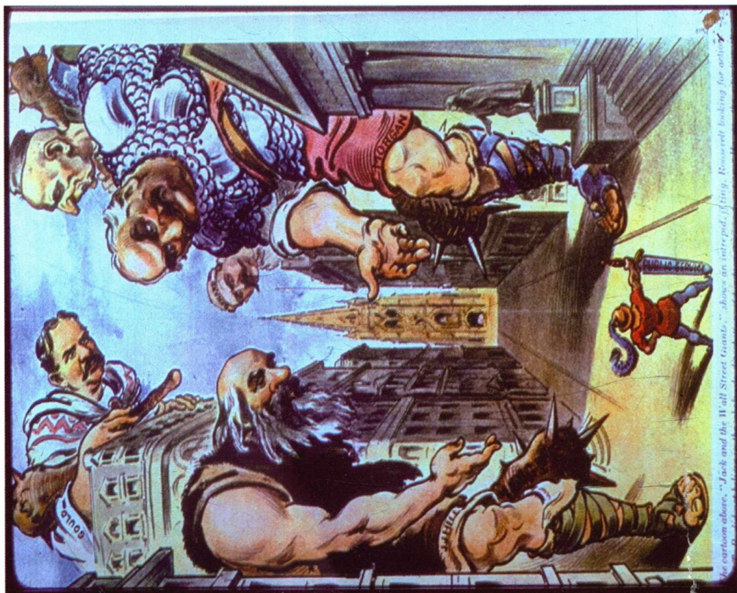
The cartoon above, "Jack and the Wall Street Giants," shows an antrepid, fitful, Roosevelt looking for action.