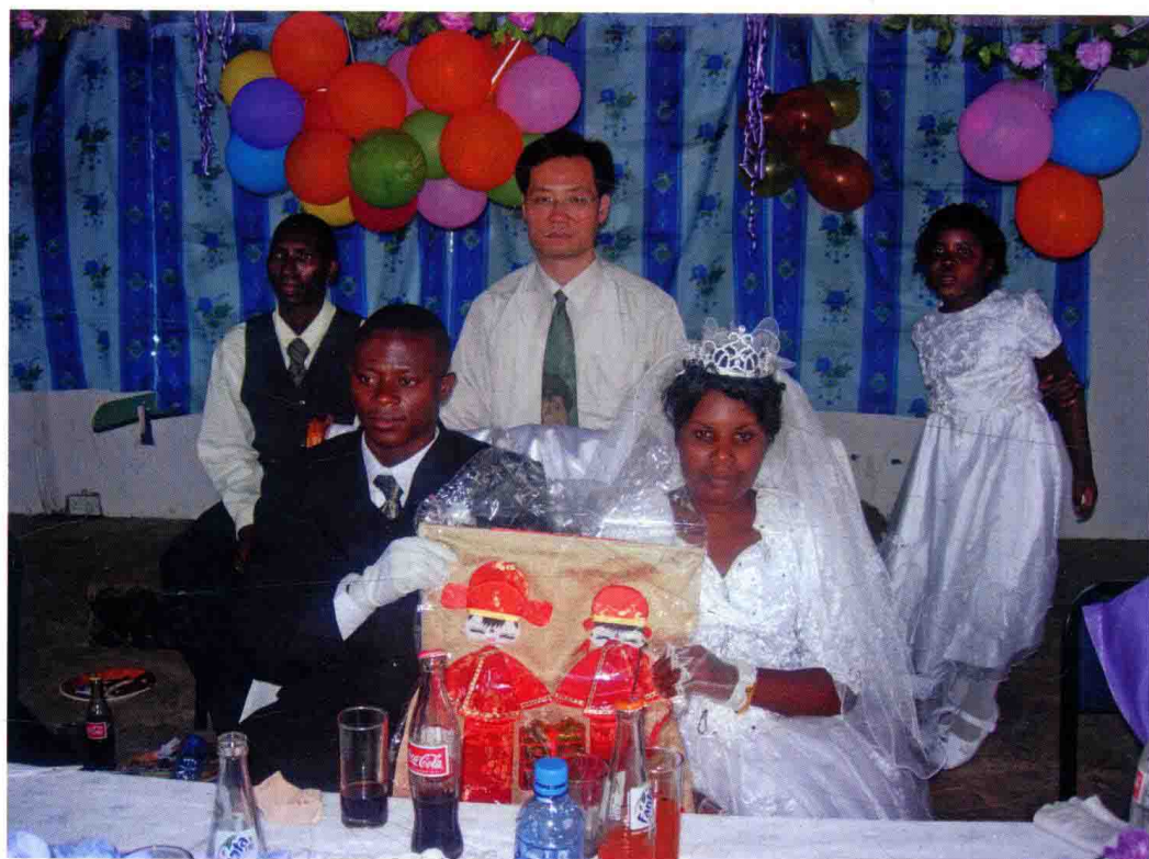
作者在赞比亚受邀参加婚礼