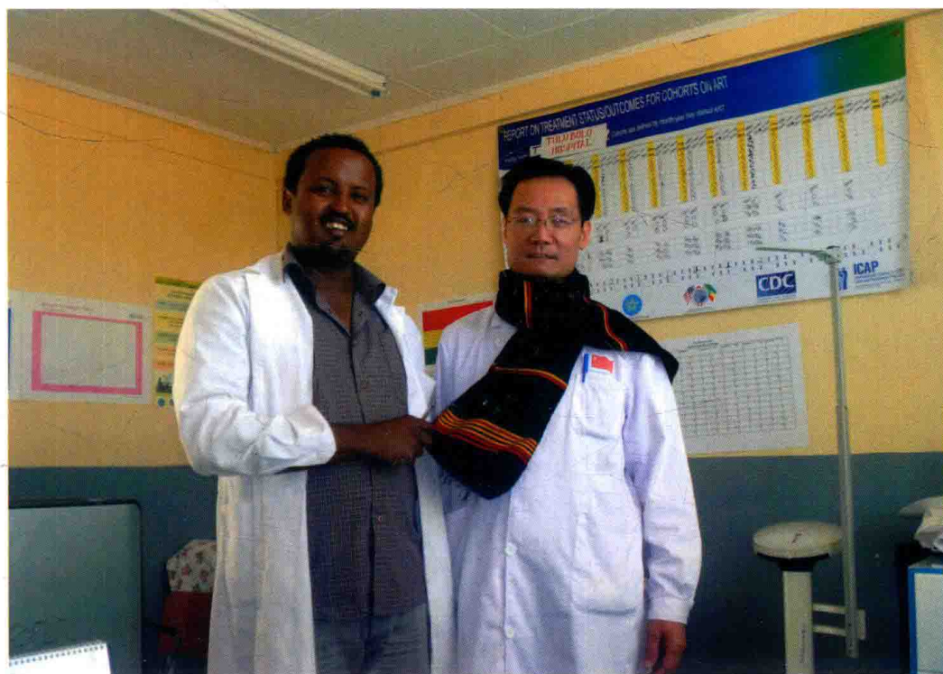
埃塞俄比亚当地医生友人向作者赠送围巾