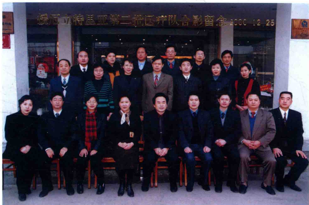
援厄立特里亚第二批医疗队出国前与省卫生厅领导合影