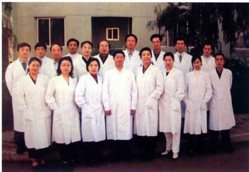
援厄立特里亚第二批医疗队在驻地合影