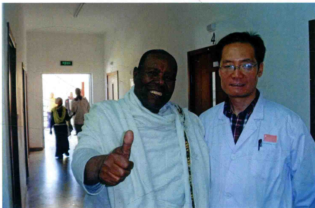
作者与一位埃塞俄比亚病人合影