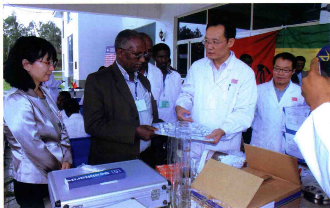
作者代表中国医疗队向埃塞方捐赠药品器械