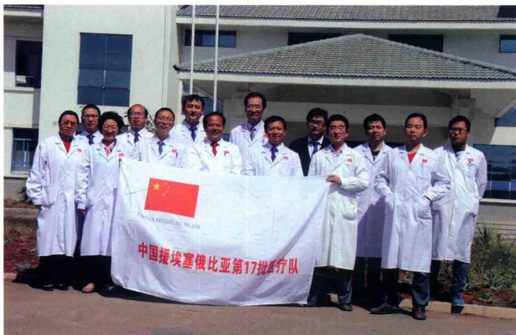
援埃塞俄比亚第17批医疗队在中埃友好医院合影