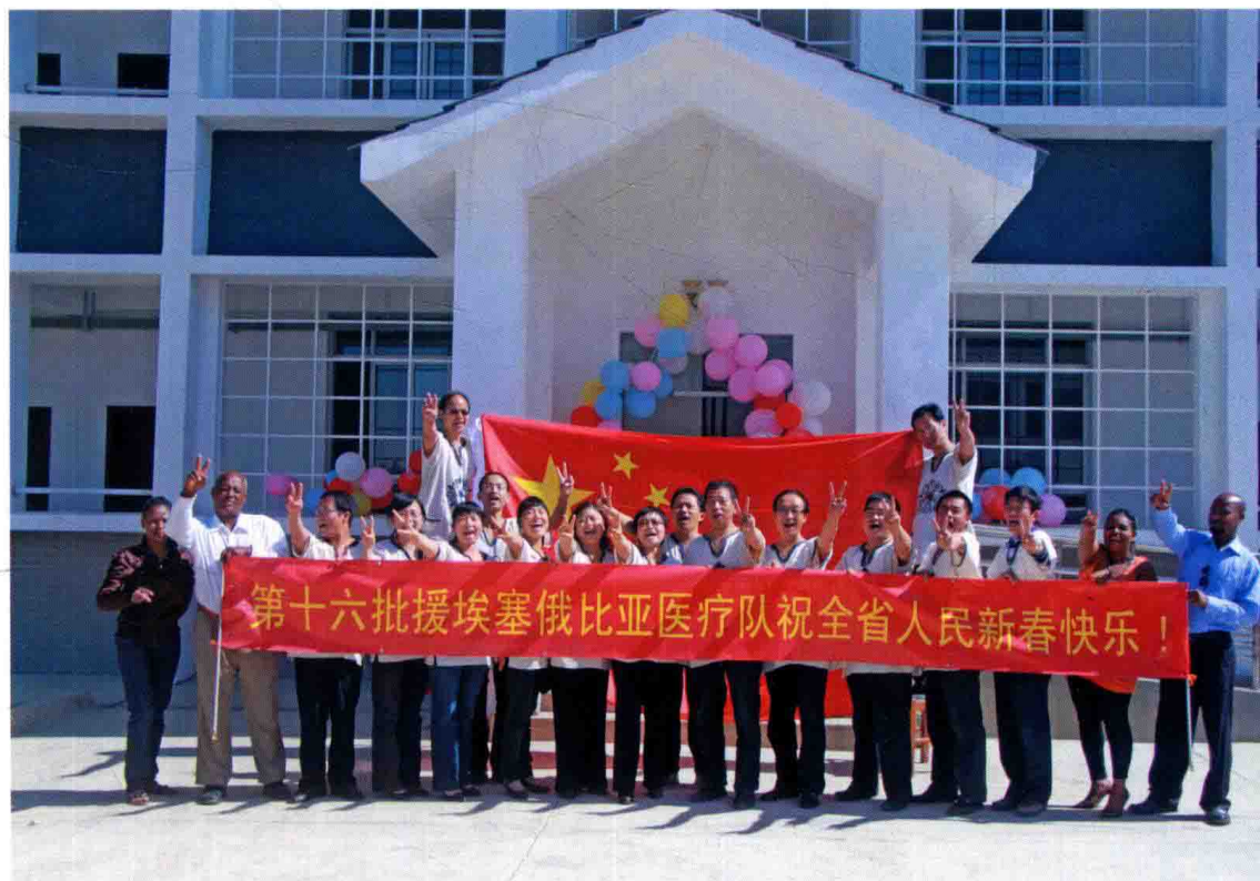
援埃塞俄比亚第16批医疗队春节在驻地合影