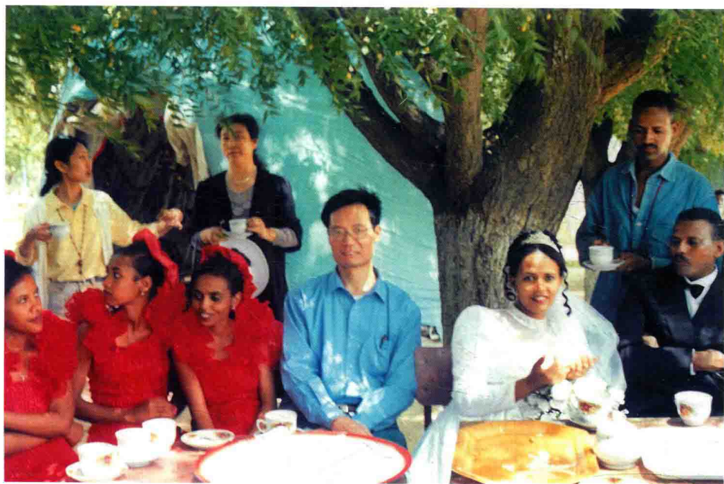
作者在厄立特里亚受邀参加婚礼