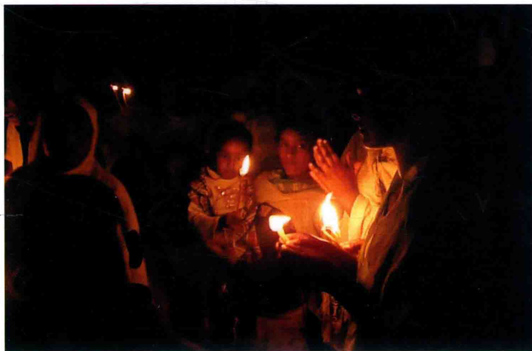
| 埃塞俄比亚马斯卡尔节