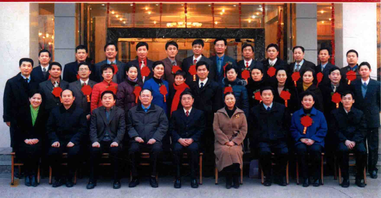
援赞比亚第13批医疗队出国前与省卫生厅领导合影