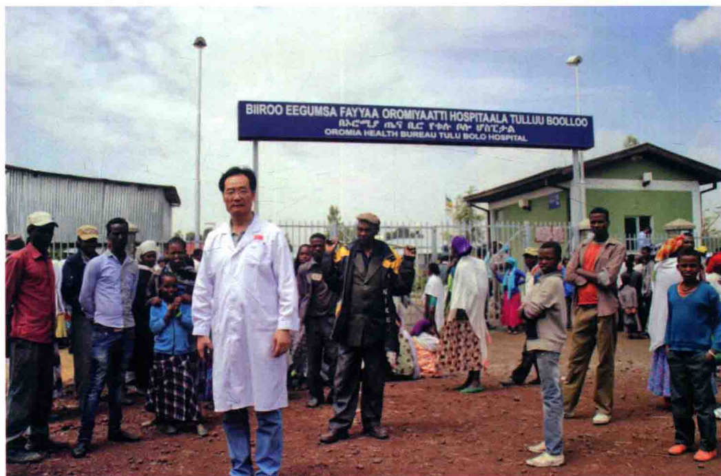
作者所在医疗队在埃塞俄比亚小镇医院巡诊