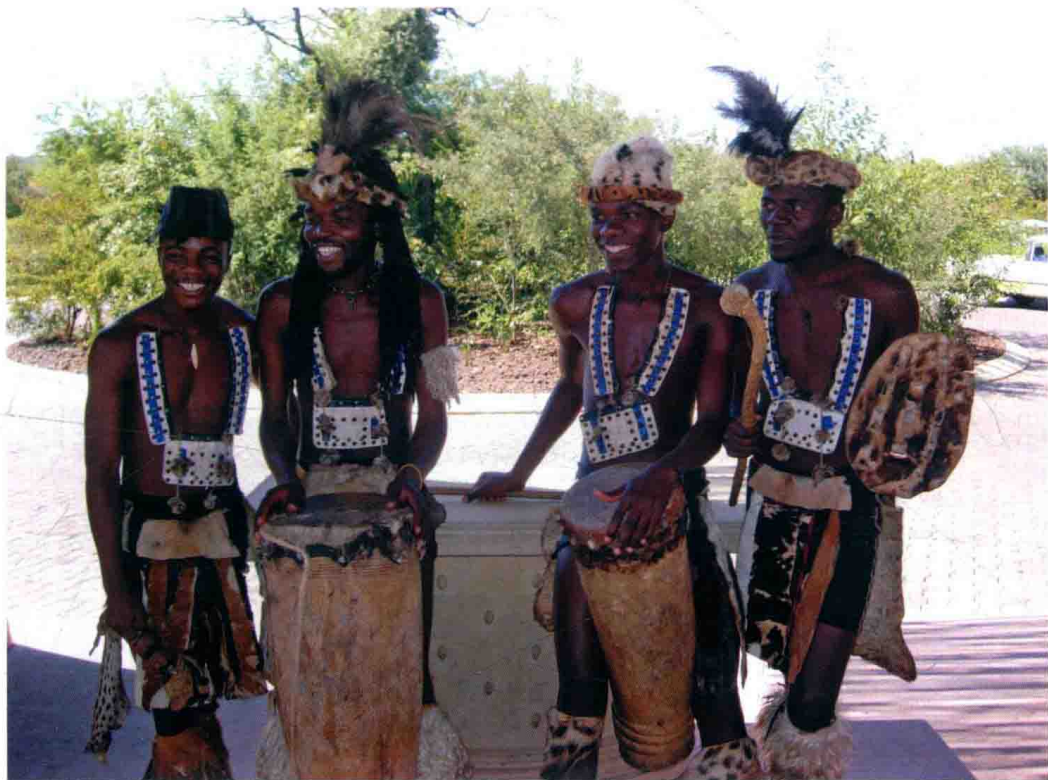
| 热情奔放的非洲歌舞