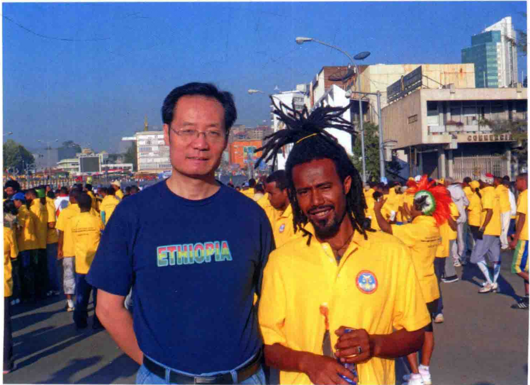
作者受邀参加埃塞俄比亚长跑活动