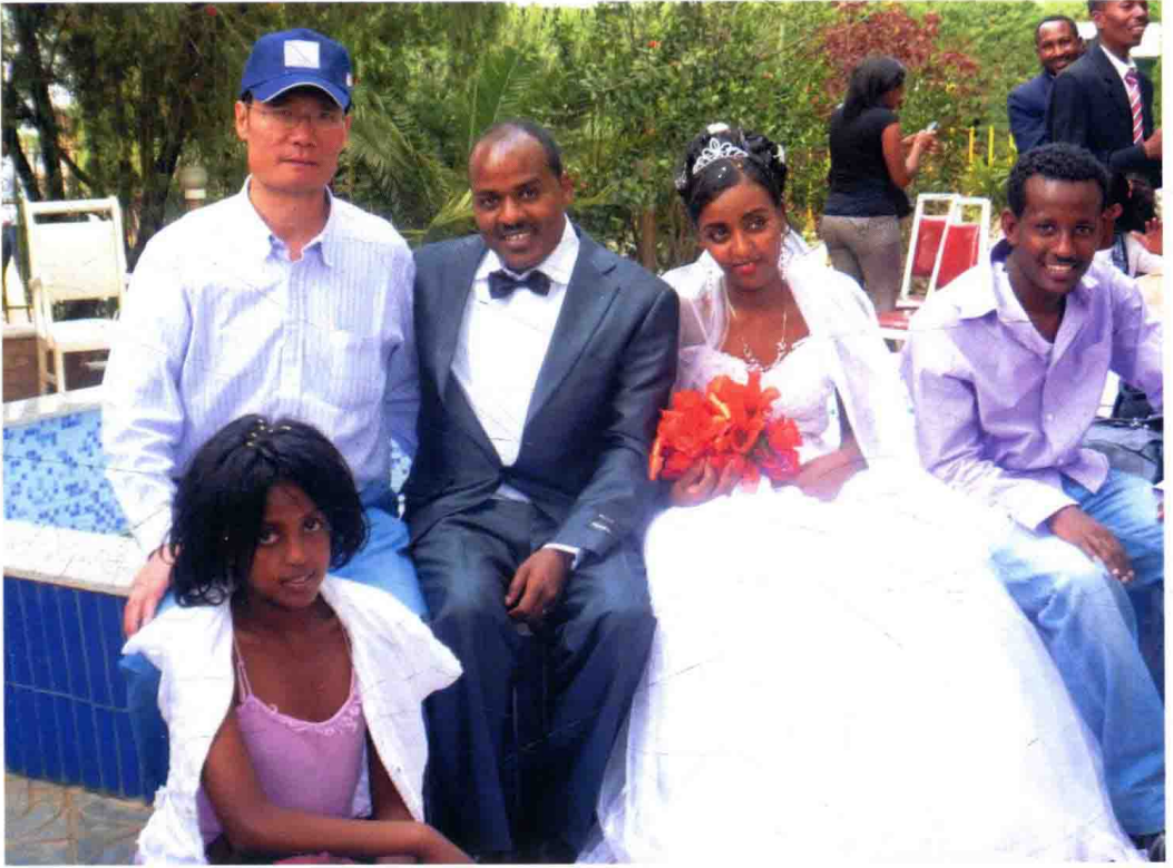
作者在埃塞俄比亚受邀参加婚礼