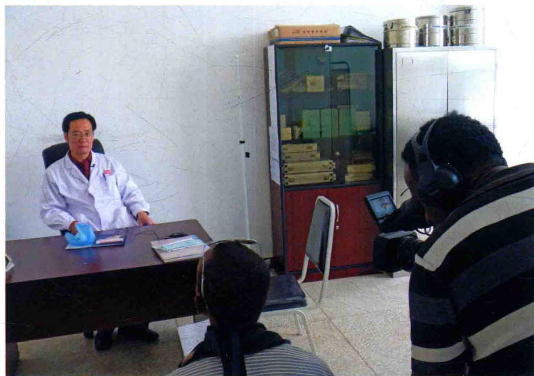
作者在埃塞俄比亚接受当地媒体采访