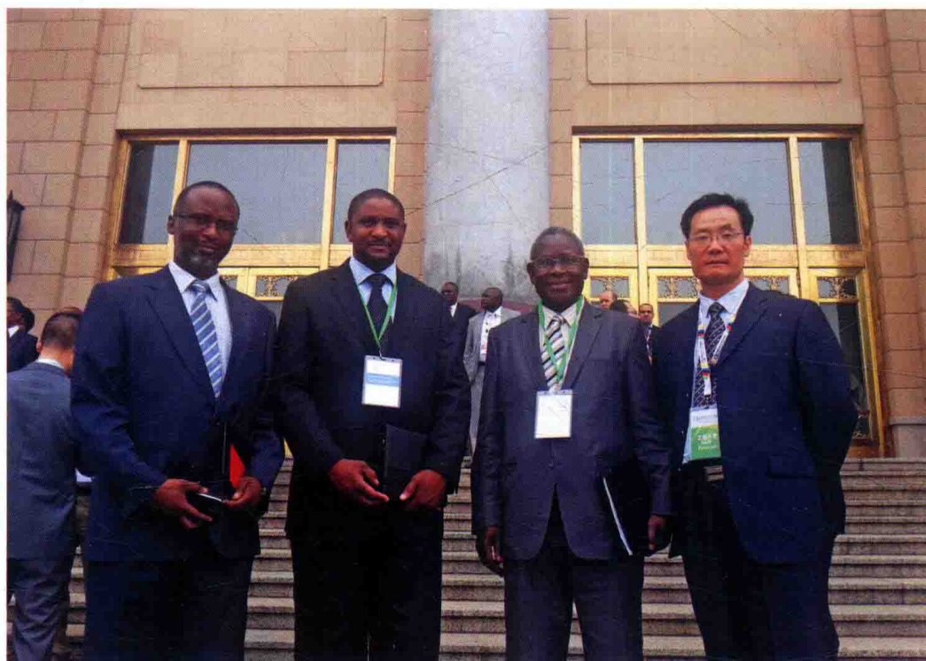
作者与来京出席首届中非部长级卫生合作与发展会议的赞比亚代表团成员在人民大会堂外合影