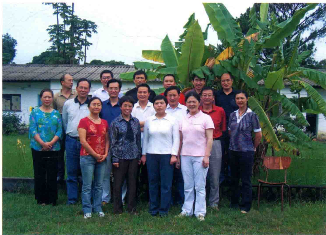
援赞比亚第14批医疗队部分队员春节在恩多拉驻地合影