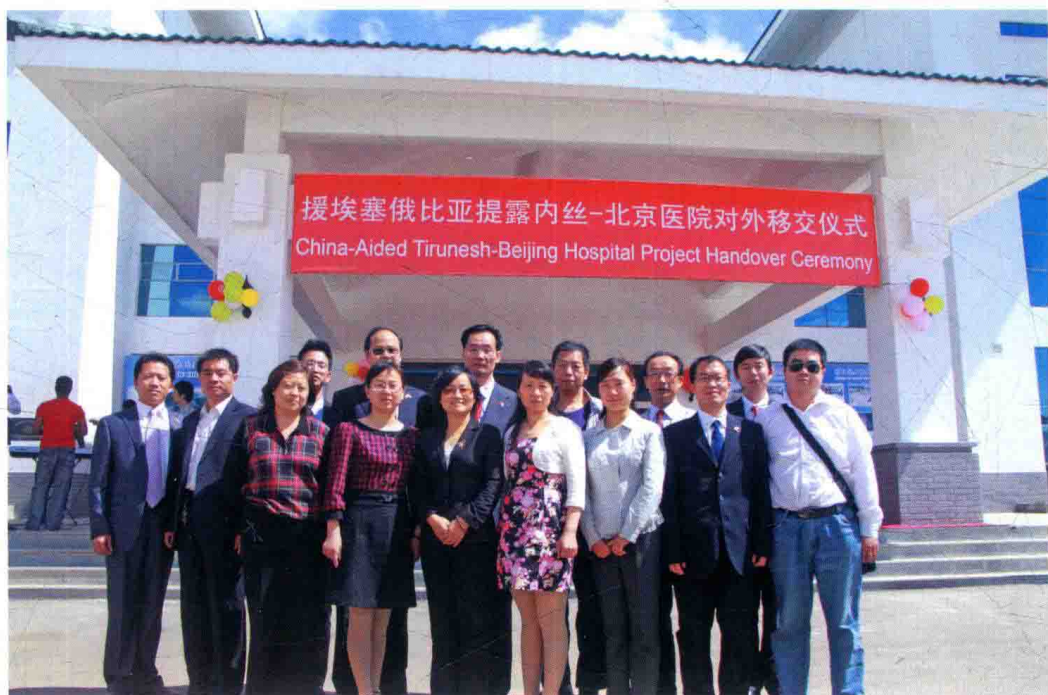
援埃塞俄比亚第16批医疗队在埃中友好医院合影