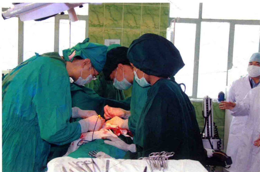
作者在埃塞俄比亚小镇医院施行乳腺癌根治手术