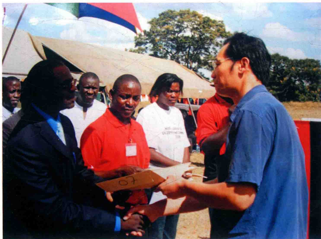
赞比亚外交部长向作者颁发“五一”劳动奖证书