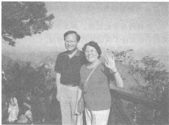
★50年后，与老伴重回老家张家界