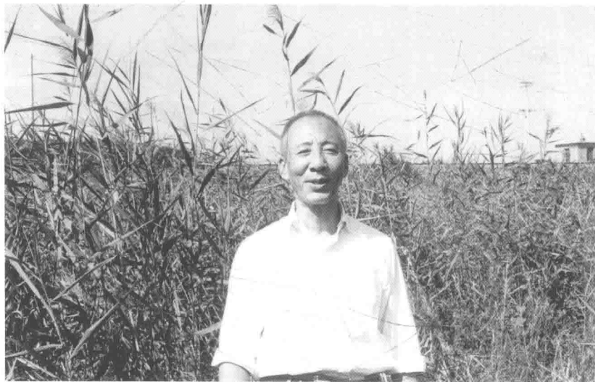
1982年孙犁在天津郊区韩家墅