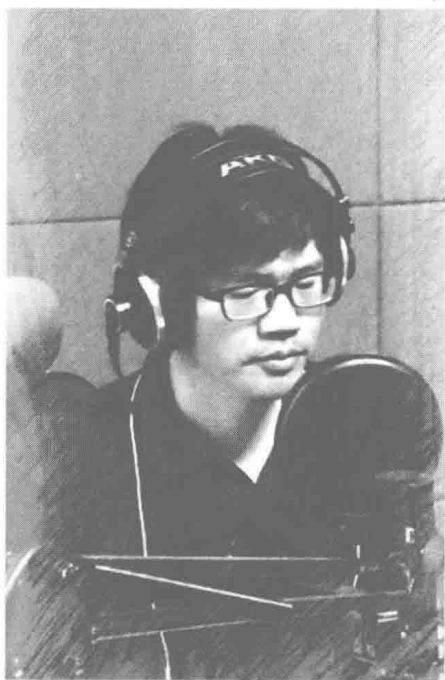
与其忧愁，莫如歌唱