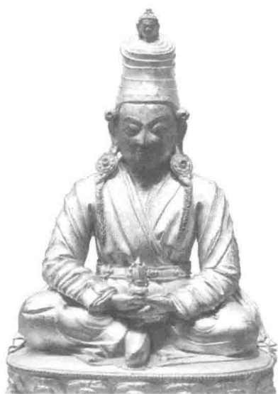
明代铜镀金松赞干布像（首都博物馆藏）

布达拉宫的历史，最早可追溯到7世纪。悉补野部落的第32代赞普、英伟而聪慧的松赞干布13岁时，其父王朗日松赞被大臣毒害，