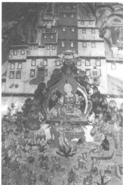
壁画中的松赞干布

拉宫曾遭雷电被击毁。又据《卫藏通志》记载，9 世纪，拉隆贝吉多杰杀死了毁佛灭法的吐蕃末代赞普朗达玛后，其子沃松和永丹两位王子为继承王位而发生内讧，“官兵拆毁布达拉宫，仅剩观音佛堂一所”。后来，藏区各地发生“温末”奴隶起义，使得布达拉宫在战火中又遭到更大破坏。此后，政权更迭、战乱频仍，红山和药王山的早期吐蕃建筑都被摧毁，只有圣观音殿和法王禅定洞保存了下来。