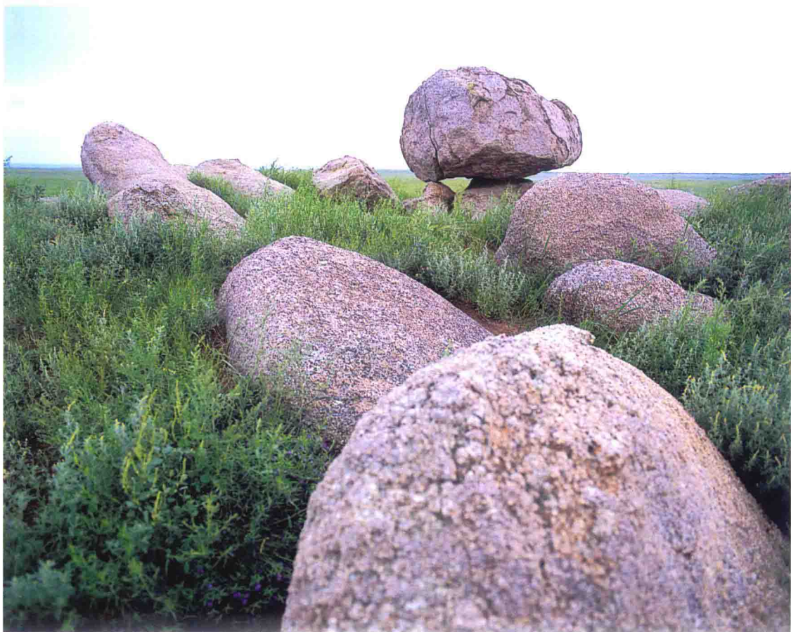
呼伦湖西侧草原上的卧石

距离这尊柱石东北方大约600公里的地方，是大兴安岭北段的森林腹地，此处有东西走向的山峰（主峰海拔1528米，当地鄂伦春人称其“吐库热山”），此山峰在地图上标注为“伊勒呼里山”。据《北史》记载，“北室韦分为九部落，绕吐紇山而居。”据乌云达赉先生考证，《北史》所称“吐紇山”即今“伊勒呼里山”。蒙古族先人属北室韦九部之一，《北史》记载的那一时代，蒙古族先人绕“伊勒呼里山”而居。大约在6世纪后期，北室韦在其北邻突厥汗国属部的压力下，朝东、南、西三个方向迁徙。从伊利可汗（？~552）至颉利可汗（？~634）的某个年代，九部因“无君长”而“不相总一”，遂四散。蒙古部捏古思、乞颜氏族西遁额儿古涅一昆。乌云达赉先生认为，进入额儿古涅一昆的应理解为两个氏族，他们可能从伊勒呼里山西端