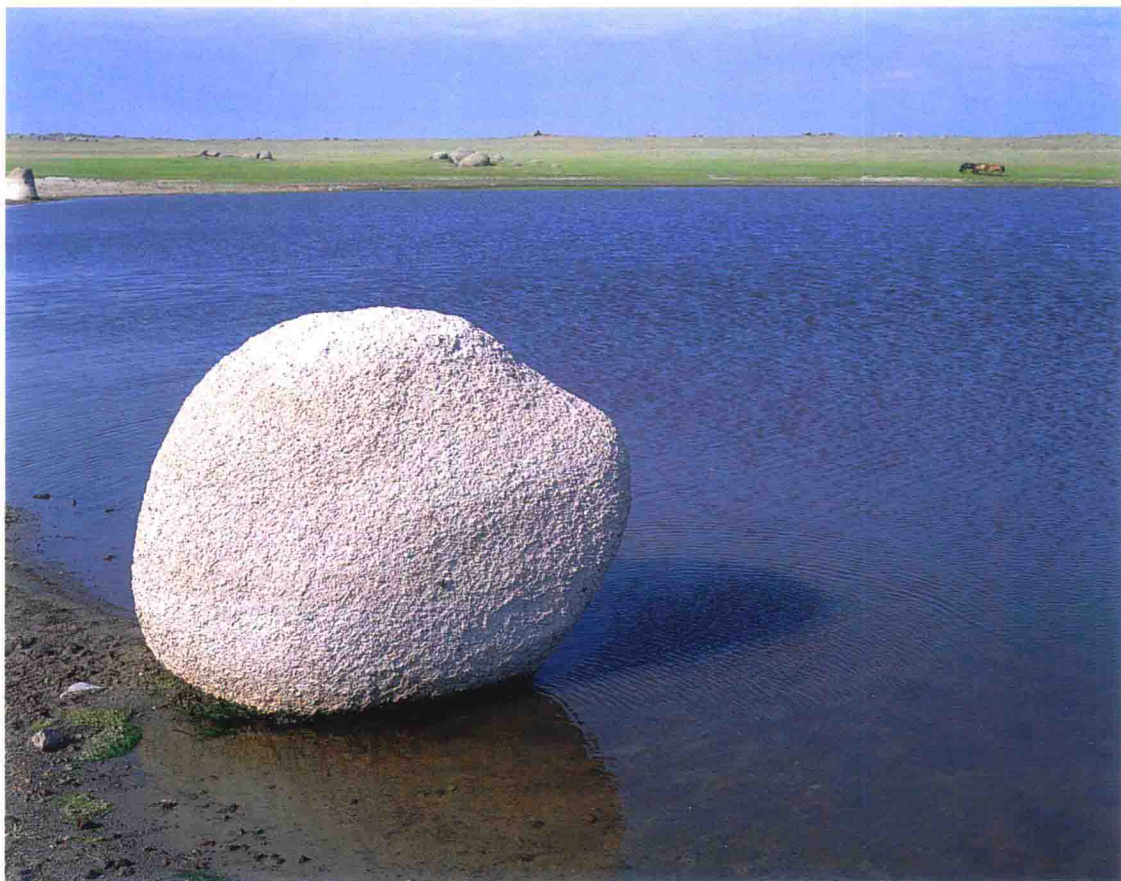
新巴尔虎右旗境内克鲁伦河下游西侧的湖泊

前，在悠远的史前期，克鲁伦河、乌尔逊河两岸，直至海拉尔河、伊敏河河谷，星星点点遍布了新石器时代遗址。这些以零散的石器显示人类存在的遗址，究竟属于哪一族群的远祖？他们落地生根，还是飘逸远方？无奈年代过于久远，后人穷尽想象也无力指认。步匈奴人后尘的是鲜卑人（大约于西汉时期）移动的毡帐，无人知晓他们在此驻留了多久，几时告别了这片水草丰美的草原，逐鹿中原，另展鸿图大业。这片土地成为室韦（应该说这是一个泛称）活动的区域，大约是在公元612年前后。直至公元669年（唐总章二年），《中国历史地图集》才明确标注，乌素固部、移塞没部（沃沮—通古斯语支 ① ）人在此屯垦戍边，射猎逐牧。依此来推测，最早从匈奴人算起，突厥人、鲜卑人，包括乌素固部人、移塞没部人，都有可能竖起一尊柱石，在贝尔湖与呼伦湖之间的山岗上祭祀他们的先祖。与这尊柱石最有渊源关系的应该说还是突厥人，因为他们曾在整个蒙古高原的广大地区，乃至天山山脉的不同地域，都留下了大小不等的“石人”，这些石人被后人称为“突厥石”。