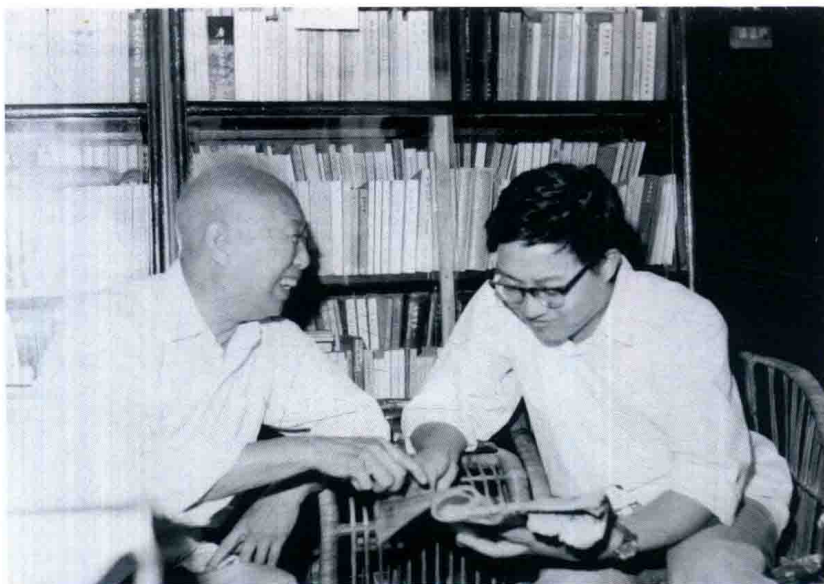
1980年，在程千帆先生书房。承训之乐，没齿难忘。