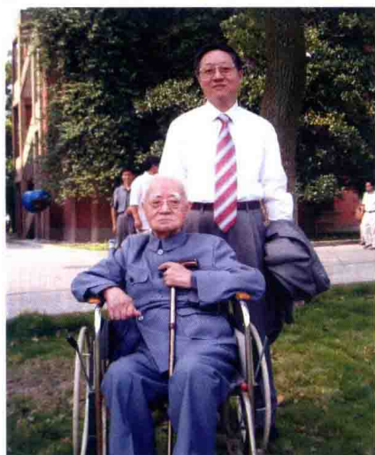
2002年，在苏州大学庆贺钱仲联先生九十寿辰。