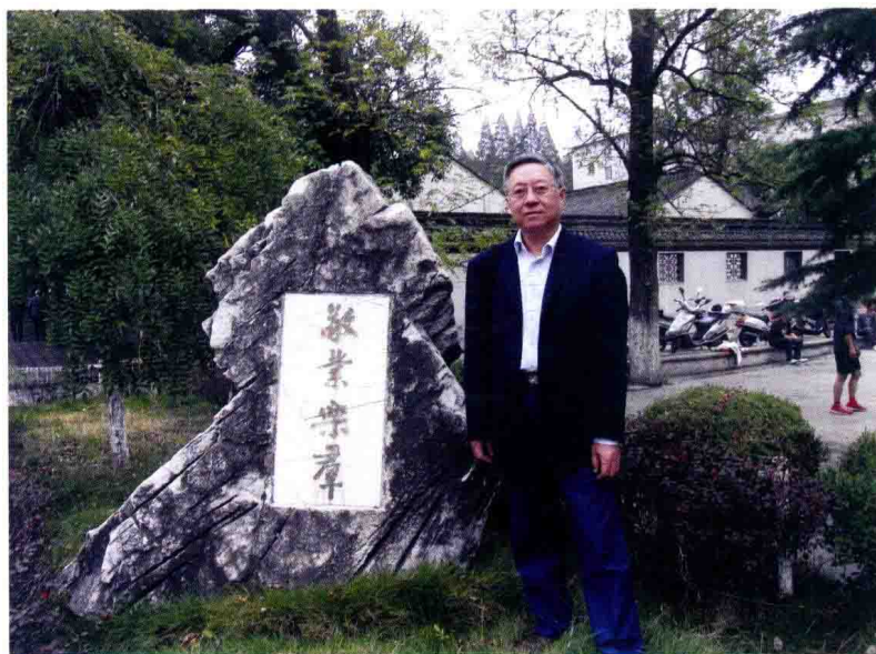
2011年，在安庆安徽大学旧址，石碑上的题字正巧是刚进南大时程先生对我们的教诲。