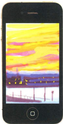
《无题》，2009年7月5日，第3号，iPhone画

我们的谈话始于15年前；最近一次是我动笔前几周。因此，本书是有“层次”的——这个词是霍克尼最喜欢的。他强调水彩的不同渲染，强调版画的层层墨彩，强调肖像中随着时间的流逝而进行的层层观察。月月年年，页面里的文字慢慢累积。交流的媒介有新有旧，形形色色：电话、电子邮件、短信，画室、客厅、厨房或汽车里面对面的交谈。很多想法是霍克尼的，但筹划安排是我做的。这是一系列抓拍，拍摄对象处于不断的运动之中——多个时刻，不同地点，他的所思所言。这段时间里，多数时候霍克尼的据点是在东约克郡，主要兴趣是以各种各样的方式描绘风景。