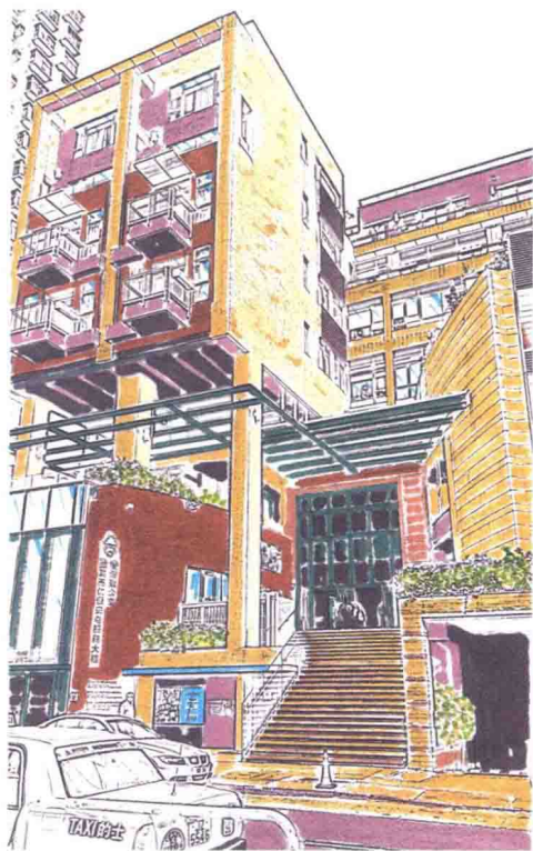
香港圣公会张国亮伉俪安老服务大楼

在项目的设计过程中，项目本身的愿景与理念扮演了极为重要的角色，建筑师需要了解建筑的具体用途与运作情形，才能设计出符合需求的作品。而文化习俗、社会价值甚至宗教信仰等背景因素亦十分重要。在此基础上，建筑师的想象与创意，再加上与使用者的融洽沟通，优质的建筑设计由此诞生。