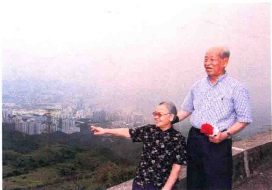
光影·浓情，青少年组优异，“敬老家庭乐悠悠”

在各类养老项目正式投入运营之前，建筑环境的设计是一个关键环节。无论是利用已有的闲置物业改装，还是破土动工重新开始，如何打造一个体现服务理念、配合服务运作、满足长者需求的服务环境，是优质养老服务的重要基础。