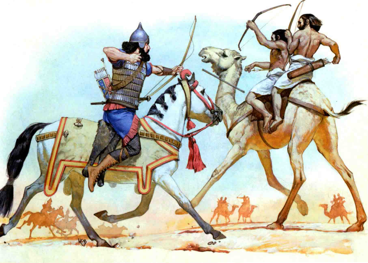
插图由安格斯·麦克布莱德创作，引自泰伦斯·怀斯的 MAA 109:《中东的古军队》。