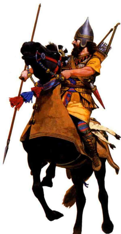
公元前 655 年亚述骑兵中的枪骑兵。插图由安格斯·麦克布莱德创作，引自马克·希利的 ELI 39:《古亚述人》。