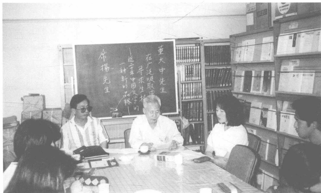
1997年9月8日在日本关西大学文学部向研究生做报告