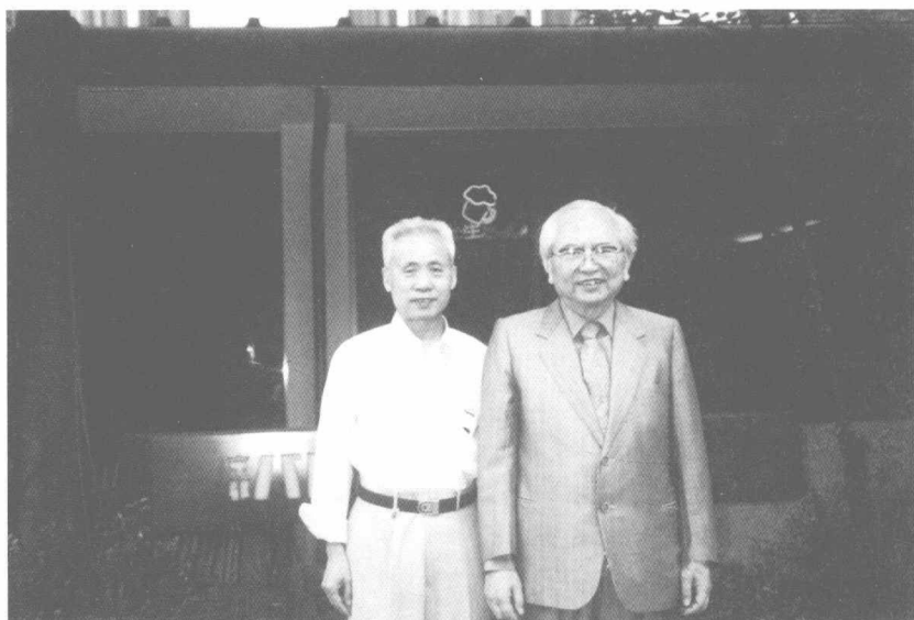
1997年9月7日在日本京都跟日本著名汉学家竹内实合影