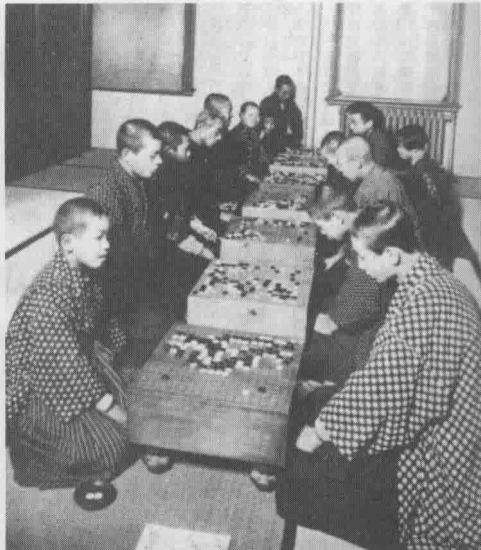
下方左边对弈者为少年坂田，中间的长者为本因坊秀哉、名人