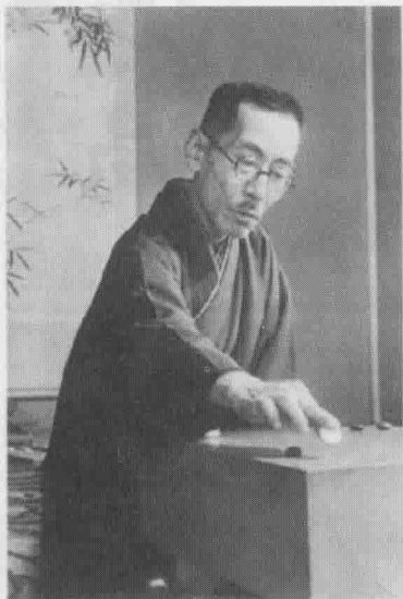
坂田荣男之师：二十一世本因坊秀哉、名人

秀哉名人明治七年（1874年）6月24日生于东京，本名田村保寿。明治十七年入方圆社作塾生，后拜十七世、十九世本因坊秀荣为师。明治四十一年（1908年）袭本因坊位，是为二十一世本因坊秀哉，大正三年（1914年）被推举为名人。时至昭和十五年（1940年）歿，是君临棋界的围棋传奇。2008年8月5日入选由日本棋院评选的第五回围棋殿堂。