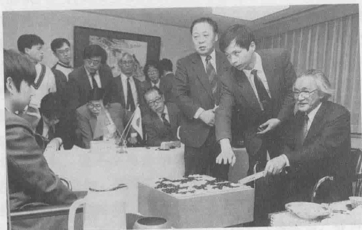
日本杂志报道关于坂田荣男与俞斌之战的现场照片

我与坂田先生只下过一盘棋。第五届中日围棋擂台赛，那次比赛我先后战胜了山城宏和石田芳夫两位九段，迎来了担当日本副帅的坂田荣男先生。他当时虽已是古稀之年，却威风不减当年，此战我至今记忆犹新，当时在中盘混战中被他一步妙手制胜。犀利的手段令我印象深刻，不愧为“剃刀坂田”！那天晚上，老爷子兴致很高，邀我们一起喝酒。他喝了很多清酒，很开心地说：“日本年轻人不行，还是得靠自己出手。”