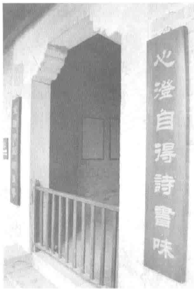
曾家私塾利见斋，挂有一副隶书新联：“心澄自得诗书味，室雅时闻翰墨香”