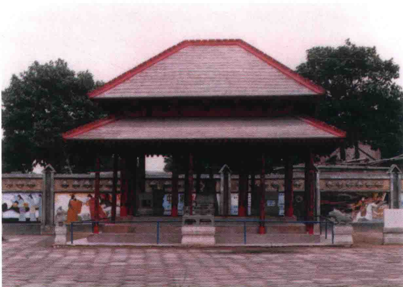
妇好墓上享堂复原建筑照

妇好墓的墓圻呈长方形竖井状，墓口南北长5.6米，东西宽4米，深7.5米。其东西两壁上各有一个壁龛，龛内埋有殉葬人。墓内有木椁和木棺，但是棺内人骨已经严重腐朽，未能见到骨骸。在墓内多个地方，至少发现了16个殉葬人的遗骸。经鉴定，共有成年男性4人，成年女性2人，儿童2人，其余8人均为零散肢骨。这中间，至少可以确认一人是被砍头、一人被腰斩杀害的。另外，还有殉葬狗6条。