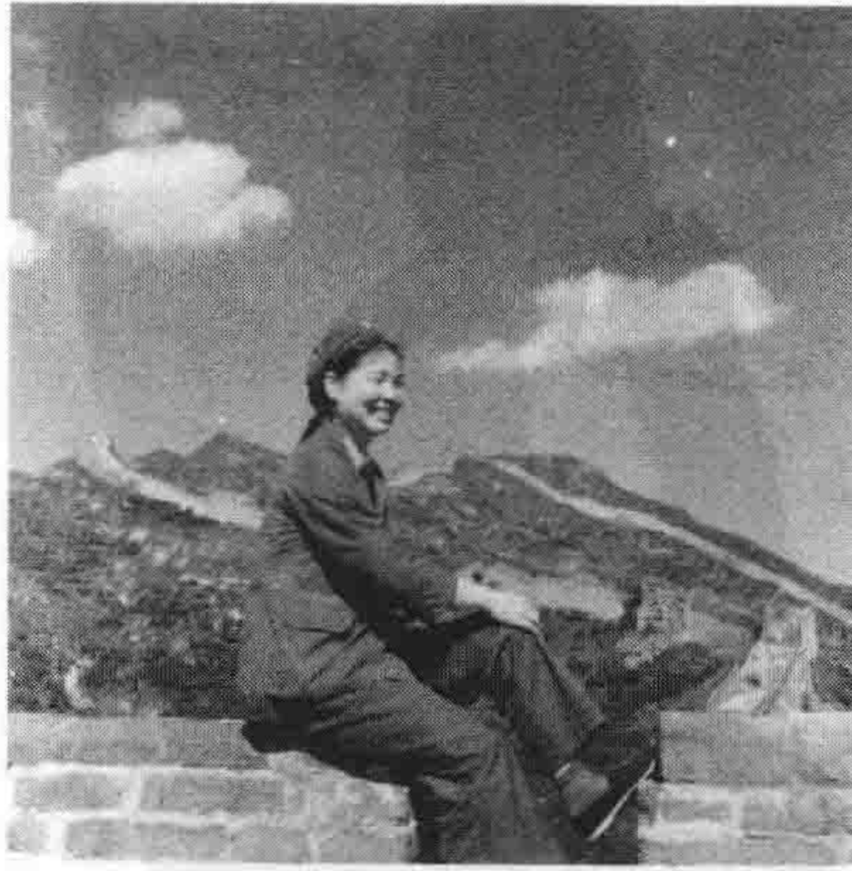
20 世纪 70 年代毕淑敏在长城留影