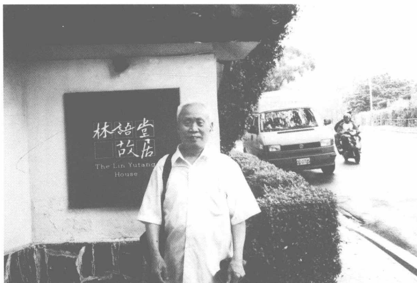
2007年6月6日在台北林语堂故居前