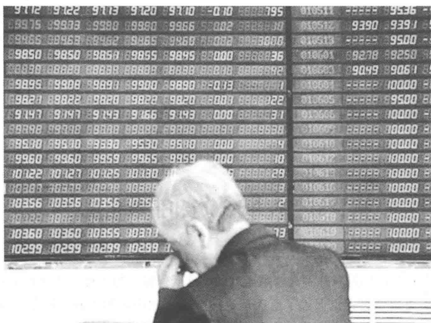
图 1-1 近距离接触行情会被市场催眠

查尔斯·道所在的那个年代缺乏必要的信息收集和处理工具，与今天相比明显处于所谓的“慢时代”，不过利弊相参，最大的有利之处是避免了市场的近距离催眠（图 1-1）。当我们面对一个瞬息万变的即时波动市场时，心情必然随之波动，而这影响了我们的客观判断。