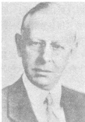
图 1-2 投机之王——杰西·李默佛