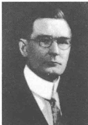
图 1-3 金融玄学宗师——W.D.江恩

在本书中，我们将主要为道氏理论正名，通过我们的交易实践契合四代道氏宗门大师的经典论述来恢复道氏理论的真正面目，并通过指导外汇交易来重振和拓展道氏理论的业界地位。这样的做法既符合道氏理论创始人查尔斯·道的本意，也符合职业交易者的实际需要。 这个世界当中没有永恒的策略，只有永恒的哲学道路。 我们应该沿着查尔斯·道创立的哲学道路，去发展和完善新的策略。 什么是查尔斯·道的哲学呢？可以浓缩为四个字——顺势而为！如果还要进一步浓缩的话，那就只有一个字——势！ 如果一本道氏理论的书没有集中全力于这个字上，只能证明这本书的作者并没有真正理解到道氏理论的精髓，他所推销的无非是改头换面的现代技术分析而已，谈论的无非是各种趋势线和技术形态，加上一些技术指标。这种书应该当做手册来使用，如果你把它当做教程来看，那么最终你会成为一个技术分析方法的学者，而不是一个真正能够从市场中持续获利的赢家。