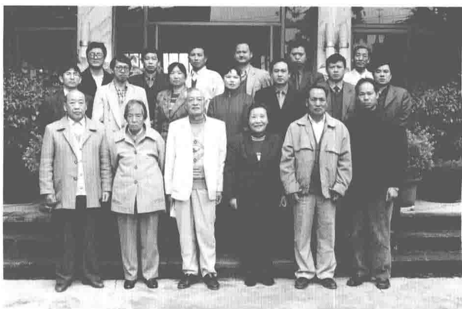
《峨山彝族志》编写组成员合影