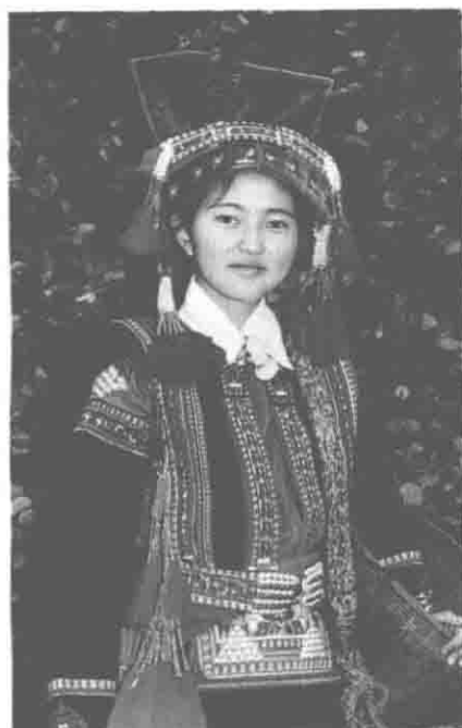
聂苏支系花腰 (棚租、雨来救)