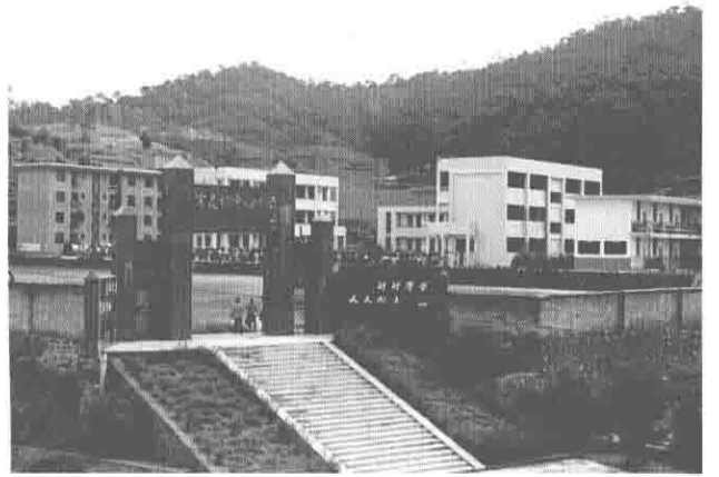
富良棚乡中心小学