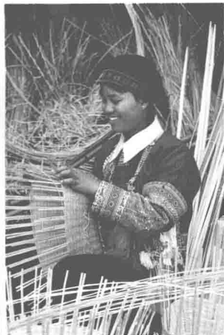
聂苏支系 (高平、富泉)