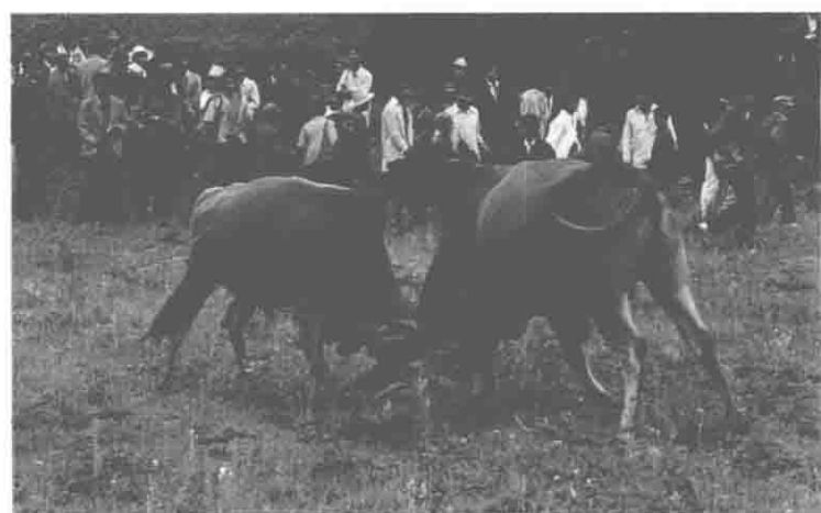
大西山火把节斗牛