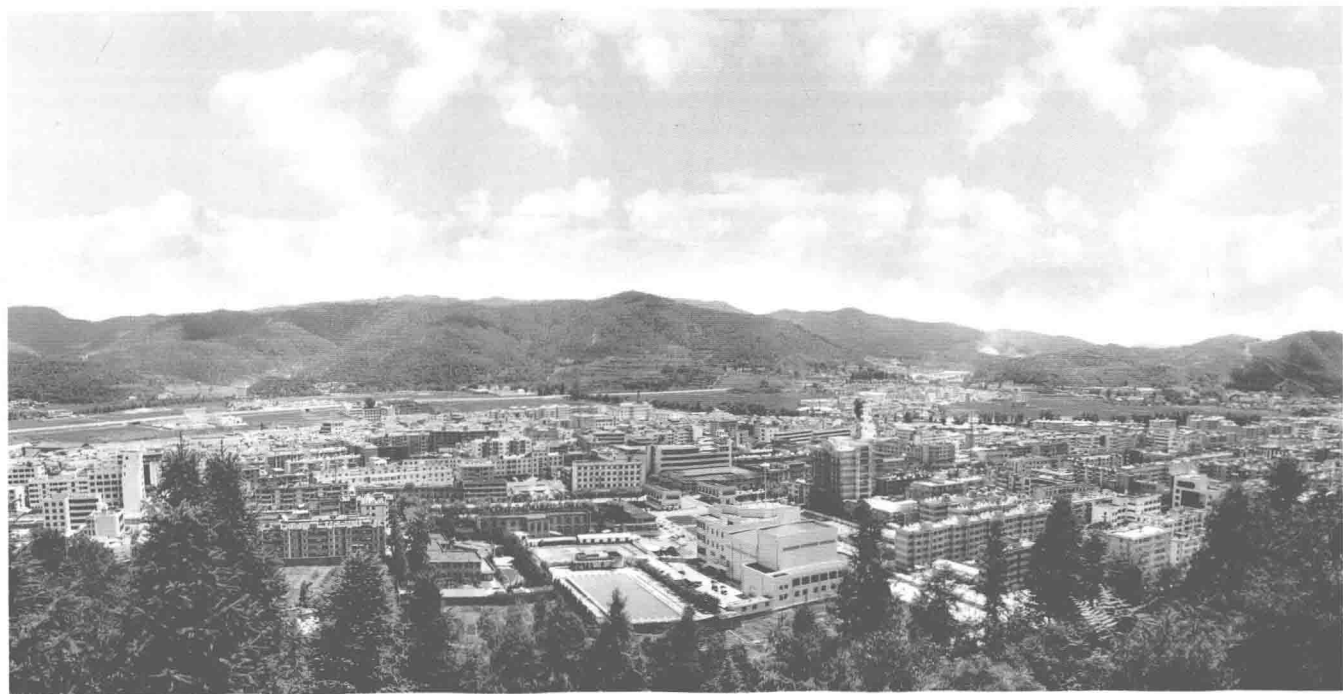
峨山彝族自治县县城全景