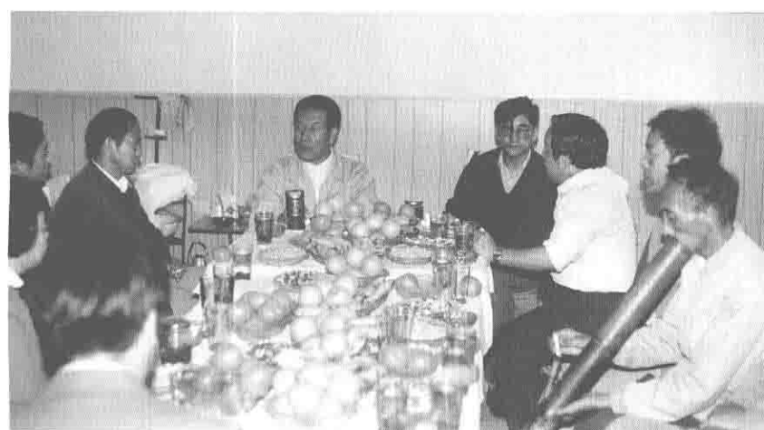
1991年10月,国家民委副主任伍精华(中)到峨山县视察,(左三)云南省民委主任马立三,(左四)峨山县县长李家茂,(左一)县委办公室主任孙峻剡,(左五)县民委主任房正科