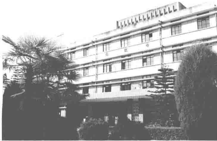
峨山县人民医院住院部