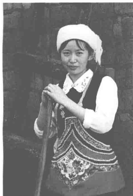
纳苏支系(塔甸、富良 棚、大龙潭、甸中、岔河)