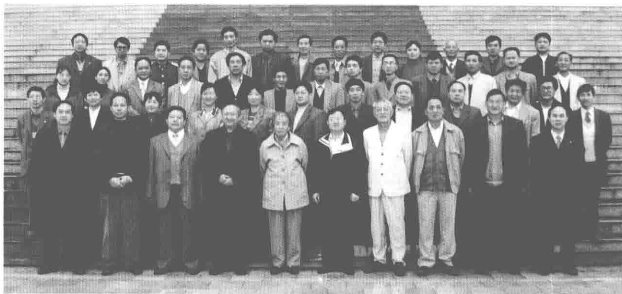
原峨山县老领导、《峨山彝族志》顾问和部分领导小组成员合影