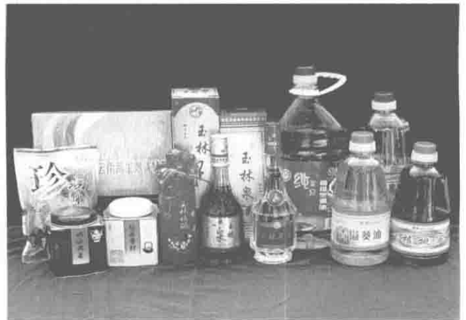
峨山县名优产品：玉林泉酒、茶叶、菜油