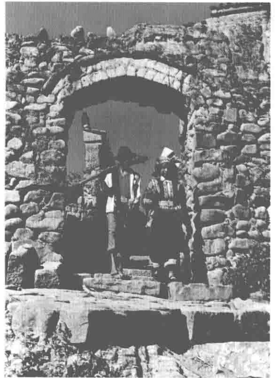
彝山古寨(莫车勒村)