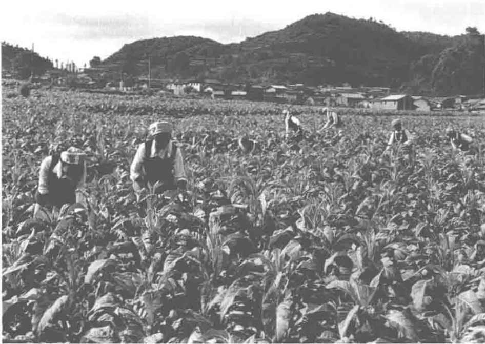
富良棚乡山地烤烟