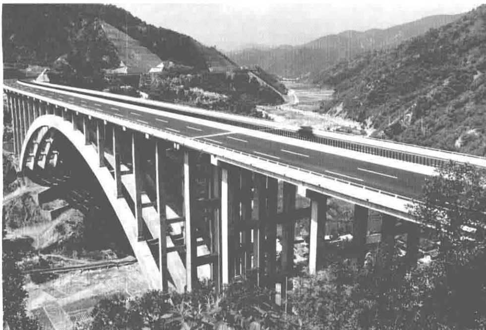
玉元高速公路 峨山段化皮冲大桥