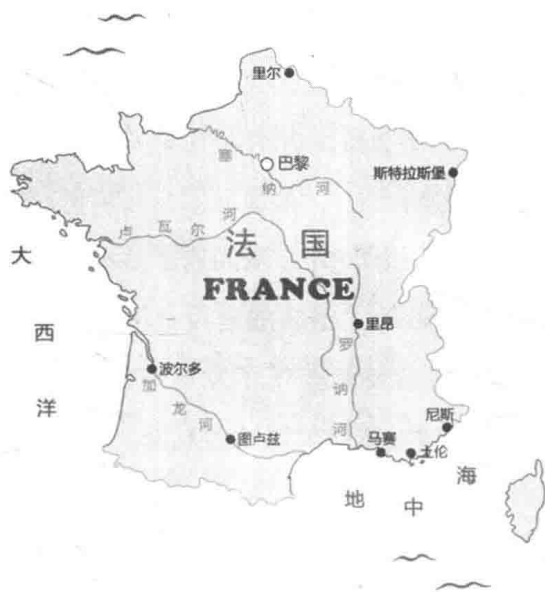
图 1-1 法国手绘图 (李歌吟作)

闻业具有国际性影响。早在大革命爆发前的旧制度时代，法国便是欧洲大陆的文化中心。自 18 世纪直到 20 世纪初，法国一直是仅次于英国的帝国主义强国，其殖民地遍布全球。尽管经历二战的重创，法国还是成为二战的战胜国，也是安理会的常任理事国。此外，法国还是欧洲联盟和北约的创始会员国、法国集团和《申根协定》(Schengen Agreement) 的成员国。1789 年法国大革命后通过的《人权宣言》(Déclaration des Droits de l'homme et du citoyen) 首次以宪章的形式提出了言论自由是天赋人权，启发了很多国家宪法或宪法性文献的相关陈述。1881 年通过的《新闻自由法》(la Loi sur la liberté de la presse de 1881) 是当时世界上最先进的新闻法，被瑞典、葡萄牙、荷兰、芬兰等很多欧洲国家借鉴。创立于 1832 年的哈瓦斯通讯社 (Agence Havas) 是全世界第一个通讯社，为路透社等其他通讯社培养了人才。19 世纪末，随着法国的殖民扩张，哈瓦斯社垄断了全世界法语地区的新闻服务。二战以后，在哈瓦斯社基础上建立的法国新闻社 (L'Agence France-Presse, AFP) 依然维持了国际性通讯社的地位。