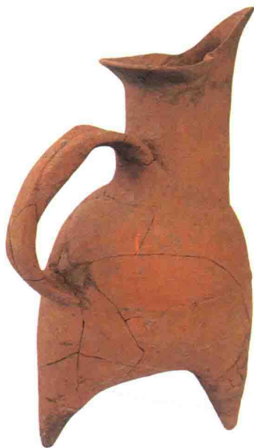
图 124 红陶鬻 龙山文化

红陶色系的基本色为红色，陶器因之统称为红陶。这是因为泥土中的氧化铁成分较高，陶坯在氧化焰气氛条件下烧制即成为红陶（图 124）。人类最初发明和创烧的陶器都属于红陶范畴，只不过杂质较多而烧制温度偏低而已。