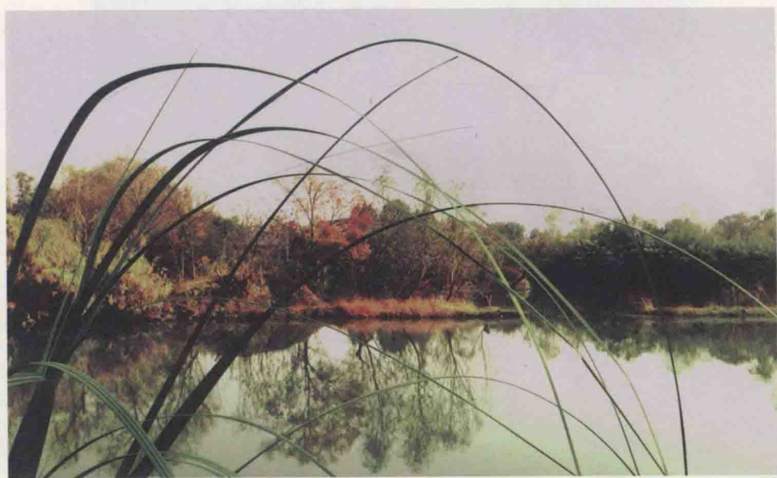
群芳过后西溪好，风光不与四时同。西溪湿地金秋写意。