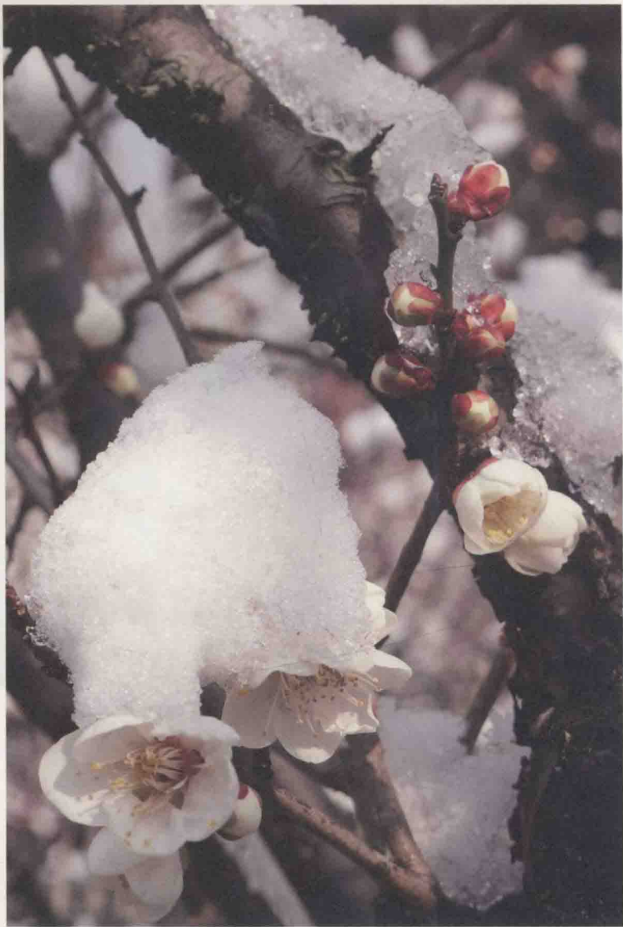
江南无所有，聊赠一枝春。杭州，灵峰探梅。