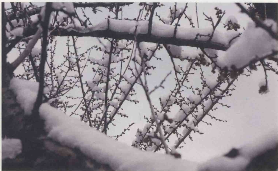
万籁霜天寂静中，一抹疏梅现。杭州，灵峰探梅。