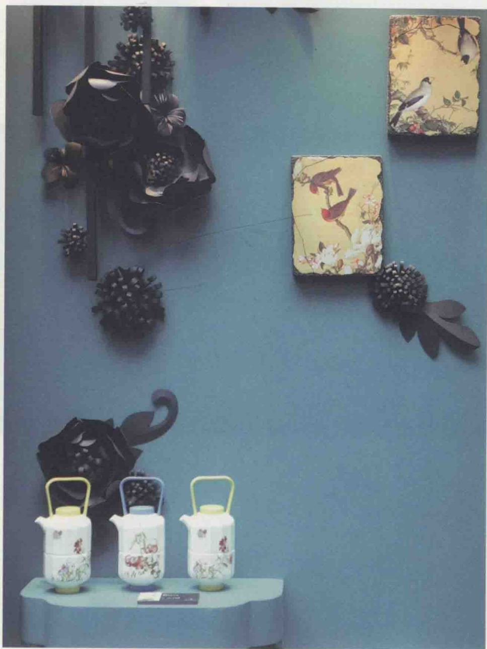
客路青山外，行舟绿水前；潮平两岸阔，风正一帆悬。2015杭州文博会，台湾馆美得让人心醉。