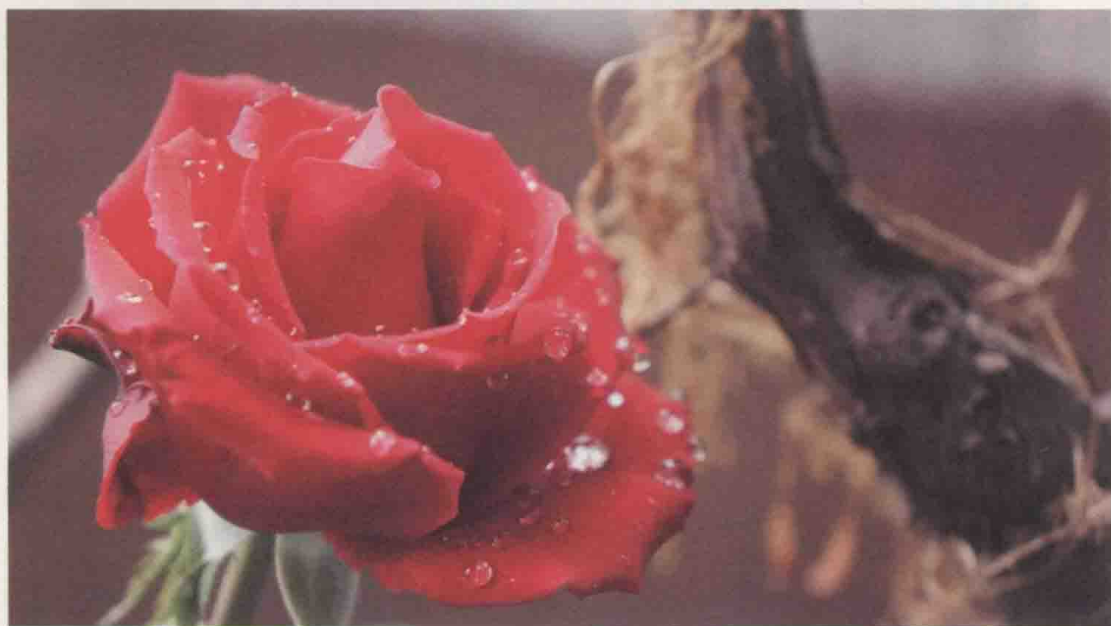
翠翠红红处处莺燕燕，风风雨雨年年暮暮朝朝。杭州，我家阳台花草。