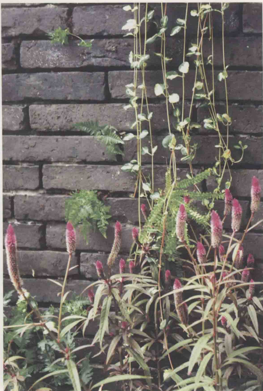
不是早莺争暖树，不是新燕啄春泥。每个角落，欣欣向荣。