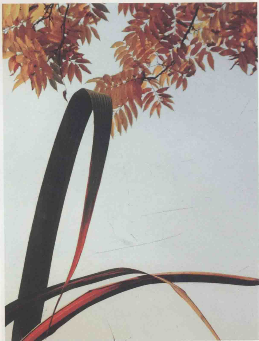
西溪且留下，一木又一草。西溪湿地金秋写意。