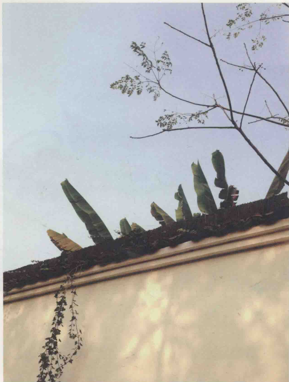
或是满庭芳，或是天净沙。一把生机出墙来。