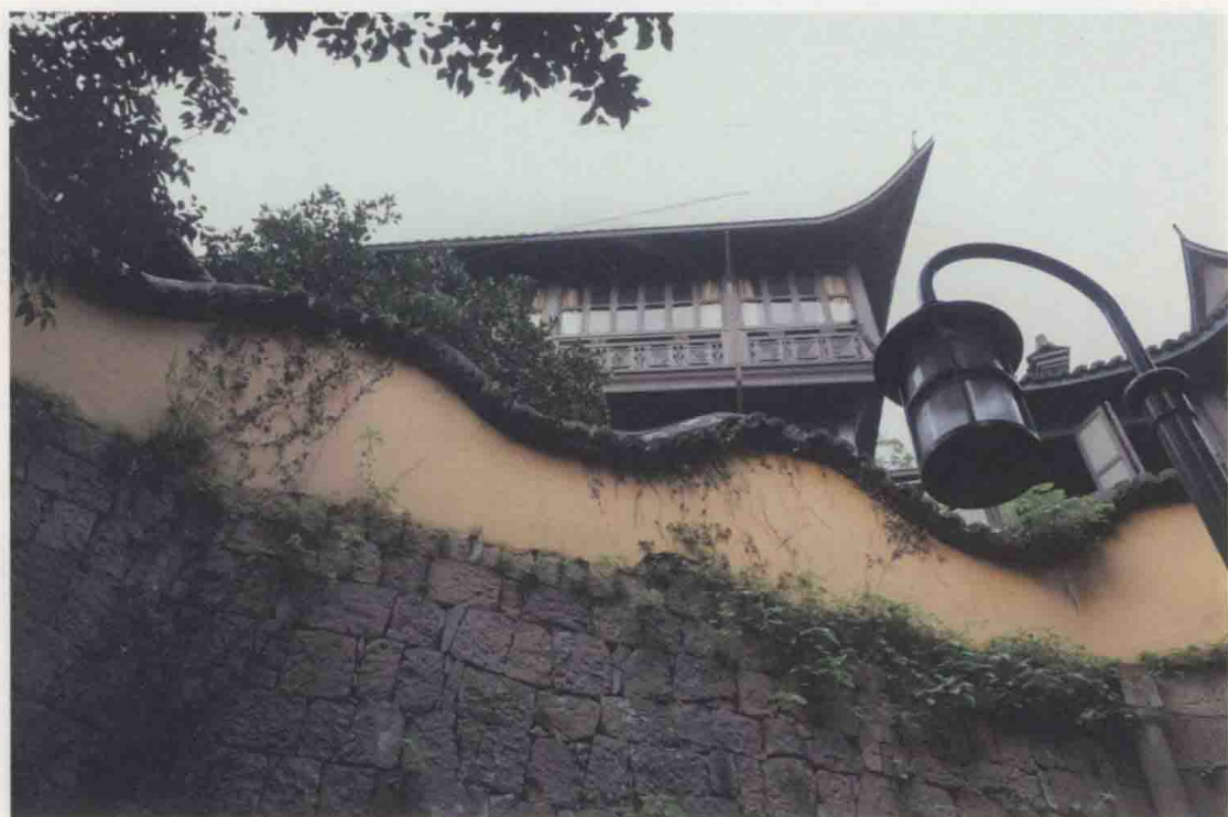
点缀名山，有勾漏丹砂着色。葛岭，抱朴道院一角。