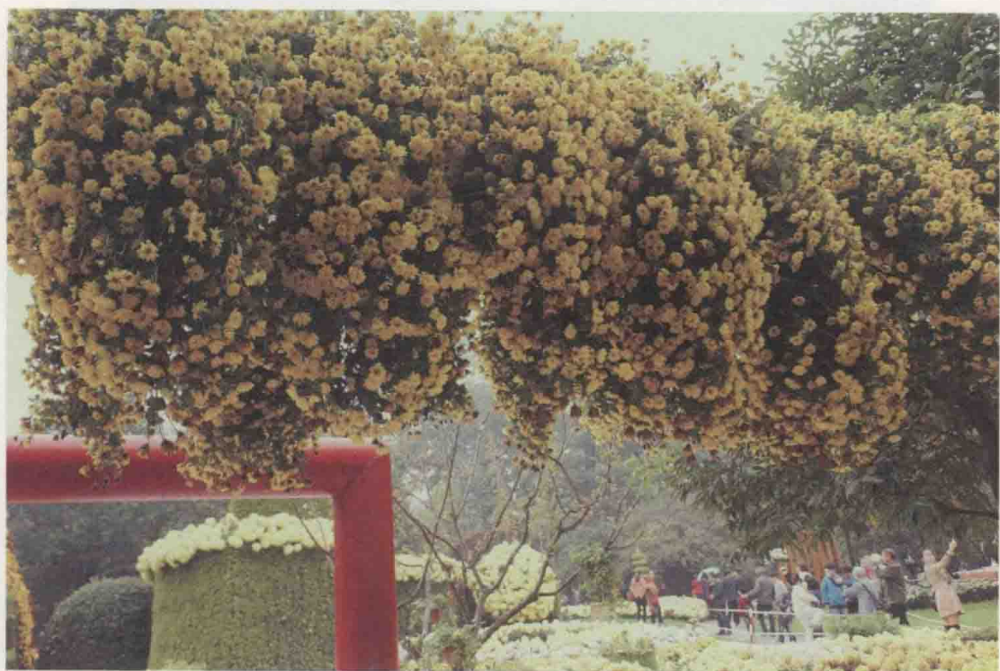
佛地花分界，僧房竹引泉。杭州玉泉，菊花璀璨。