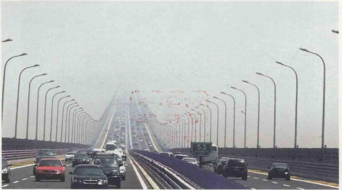
若到江南赶上春，千万和春住。杭州湾跨海大桥。