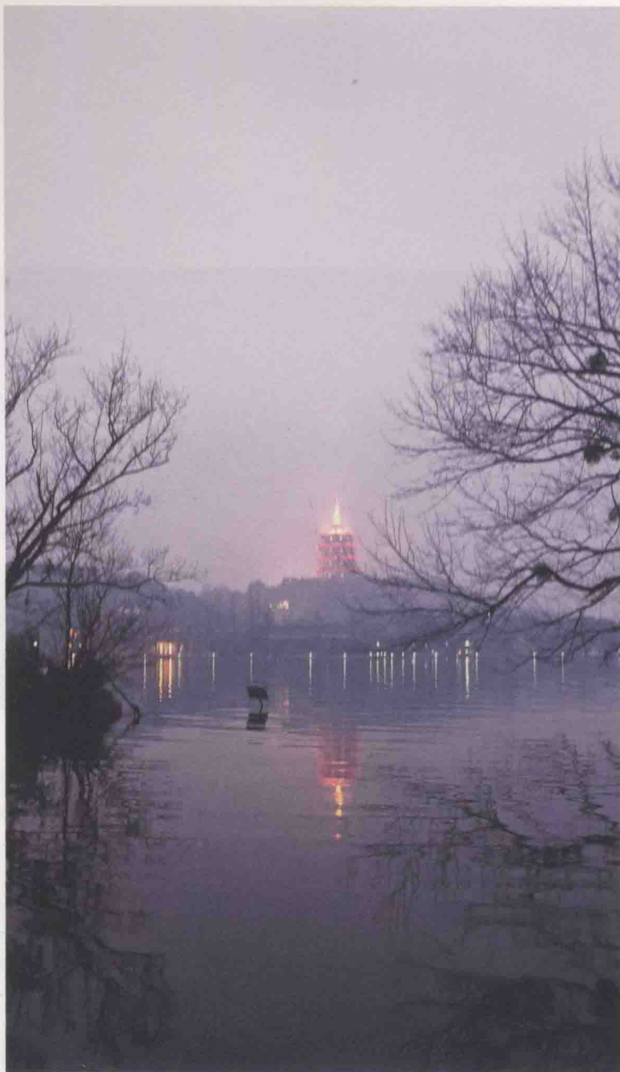
迟迟听彻凤林钟，要看斜阳一抹上雷峰。黄昏，遥望雷峰塔。