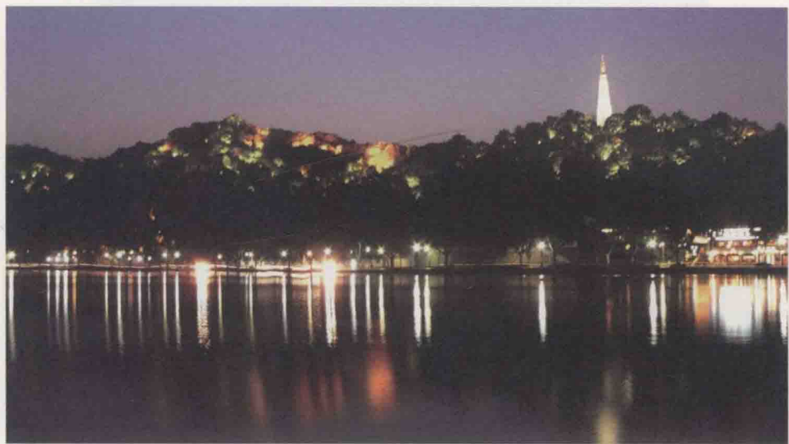
我见西湖多妩媚，料西湖见我应如是。夜，亭亭而立的保俶塔。