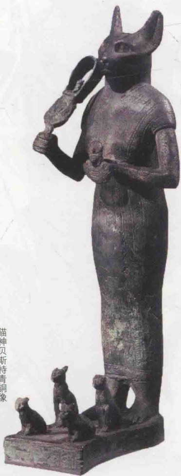
猫神贝斯特青铜像

这个推断是，人类驯化狗最前，它能帮助人类狩猎，远古时期的人类以狩猎采集为生，考古证明狗的驯化历史约16000年；人类驯化猫的历史约10000年；人类驯化牛的历史再后，农业革命后人类需要帮手，吃苦耐劳的牛随即被驯化，帮人类干活，偶尔还献身成为食物，这有6000年了；再后来人类才开始驯化马，主要让它帮人类打仗，和平时也干活，考古证明马的驯化史只有4000年；至于猪羊鸡鸭等畜禽，人类圈养它们仅用来果腹，算是食物，不用去干活。