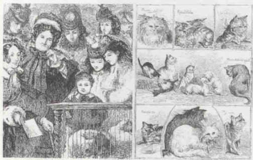
1871年英国水晶宫举办的猫展

那一次参展的160只猫分为长短毛，不同颜色，让世人知道了同样为猫，还有许多千差万别的品种。随后，凡事附庸风雅的美国人也于1895年在纽约麦迪逊花园举办了正式猫展。英美等各国的猫迷协会也陆续成立，至今不过一百多年的事情。