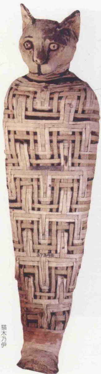
猫木乃伊 埃及约公元11世纪 大英博物馆藏

因此埃及人渐渐将猫驯化成宠物。古埃及的神庙壁画到处可见猫的形象。当猫去世后，古埃及人还会将其制成木乃伊，甚至将小老鼠和毛绒球作为它的陪葬。考古学者曾经在一座埃及神庙中发现了30万个猫木乃伊，足见埃及人爱猫的程度及当时猫的数量。