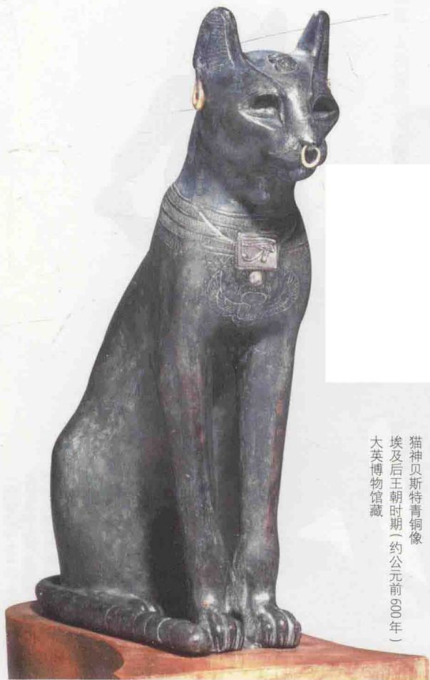
猫神贝斯特青铜像 埃及后王朝时期（约公元前600年） 大英博物馆藏

猫和人亲密的历史过去一直认为自古埃及始。的确，古埃及的文物中各类猫像神灵一样无处不在。那些猫身体修长，神情自若，有一种说不出的高贵，以致很久以来人类一直固执地认为，尼罗河两岸肥沃的土地创造了农业文明，粮食的囤积导致鼠害发生，遂古埃及人驯化了猫作为帮手，这就是今天风靡世界的宠物猫的前世。