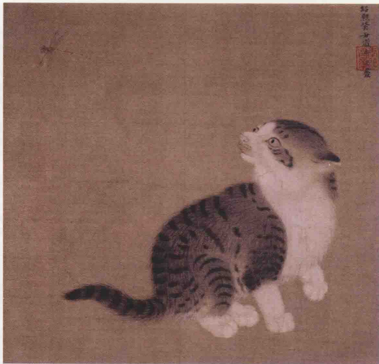
宋代 《狸奴蜻蜓图》 日本大阪市立美术馆藏