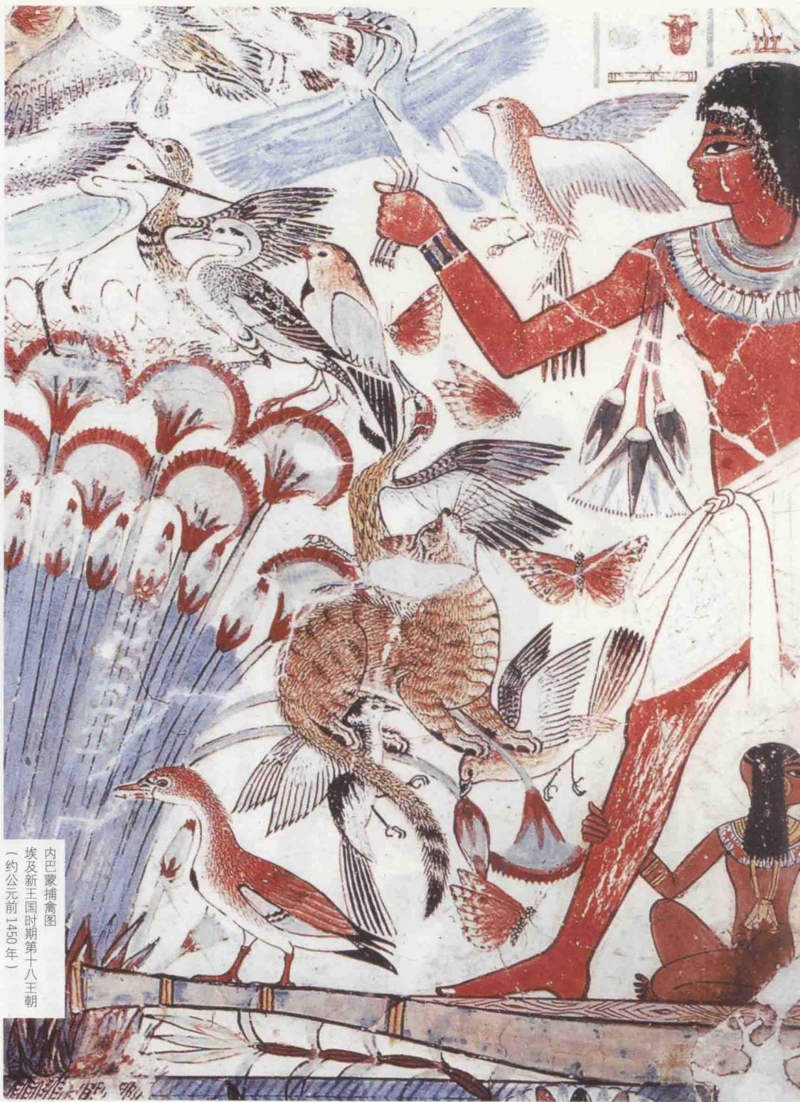
内巴蒙捕禽图 埃及新王国时期第十八王朝 (约公元前1450年) 大英博物馆藏