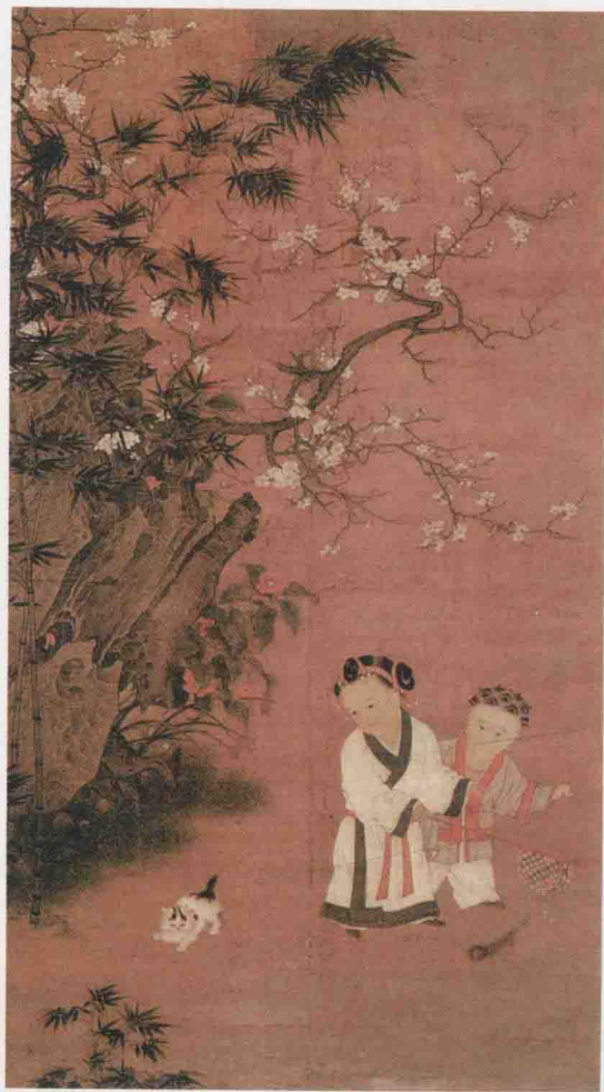
宋代 《冬日婴戏图》 台北「故宫」博物院藏