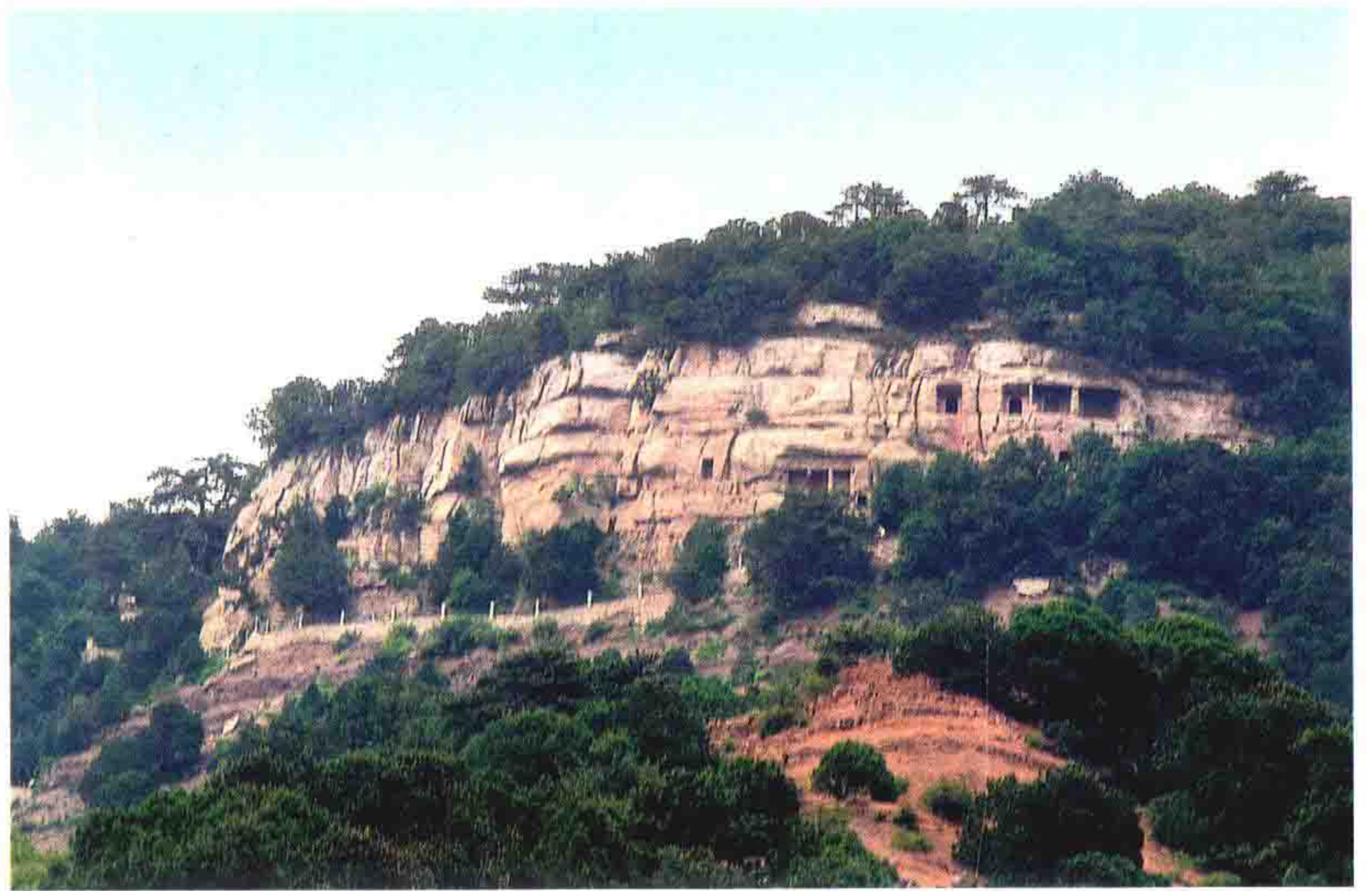
图1-1 天龙山石窟远眺

天龙山位于山西省太原市西南约40公里，以佛教石窟而闻名于世，石窟有东魏、北齐、隋、唐、五代、宋、辽几个朝代，雕像500余尊，分布于东西两峰山壁之间，艺术价值很高。