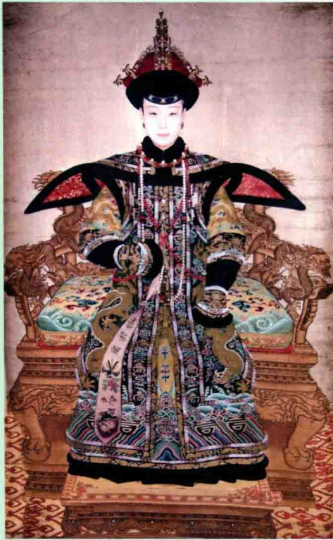
乾隆皇帝的穆斯林皇妃——香妃(容妃)伊帕尔汗曾十次随乾隆赴承德，与承德清真寺结下不解之缘，此为香妃画像(吴丕清摄)