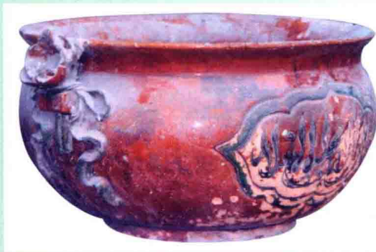
慈禧、光绪御赐无极高头清真寺的香炉