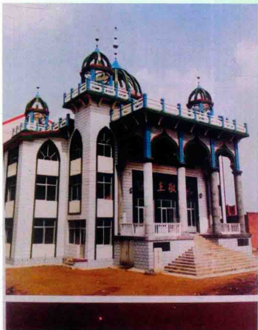
河北哲赫林耶教派清真寺——沧州清真西 寺(摘自《沧州回族风貌集》)