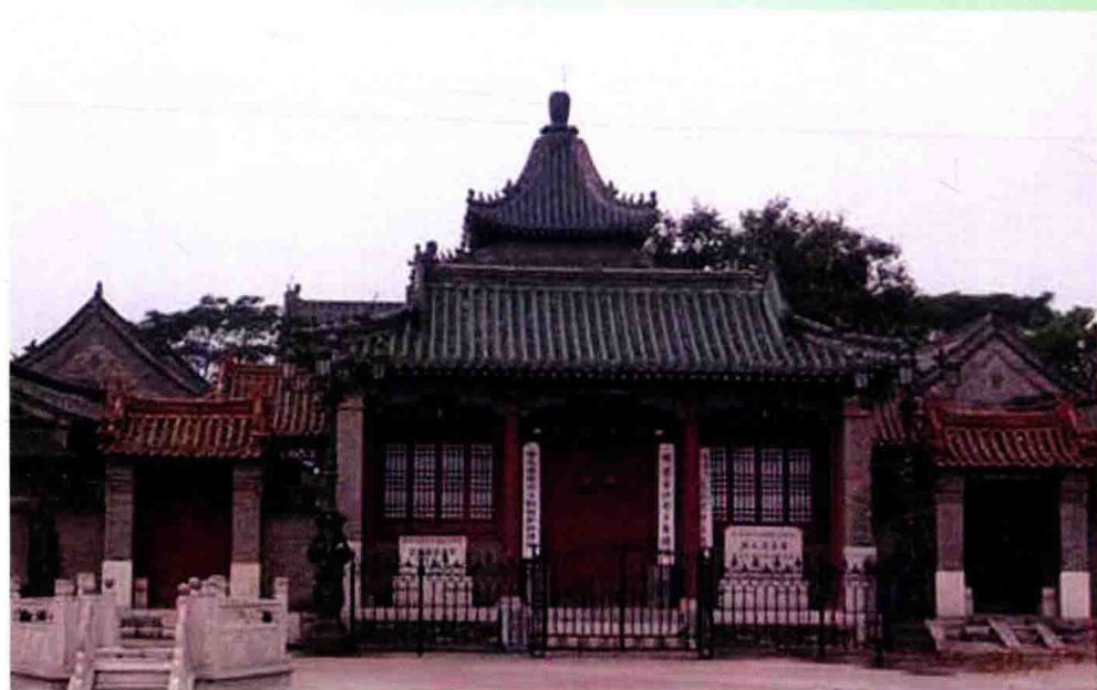
泊头清真大寺,始建于明永乐二年,现为国家级重点文物保护单位