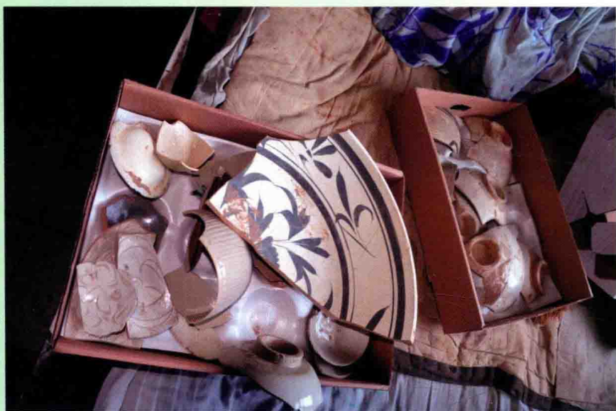
盐山杨马连村出土的宋代穆斯林先民使用的瓷器残片