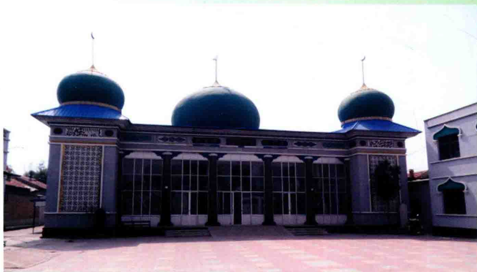
孟村回族自治县清真大寺