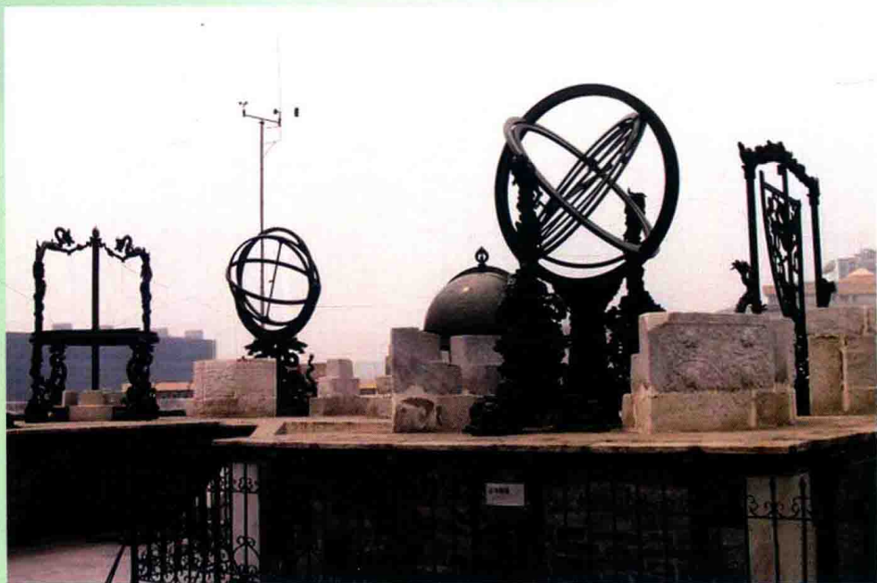
元代回回人发明的天文仪器