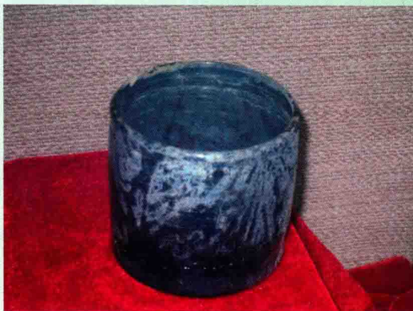
定州出土的宋代阿拉伯琉璃器皿、摆件