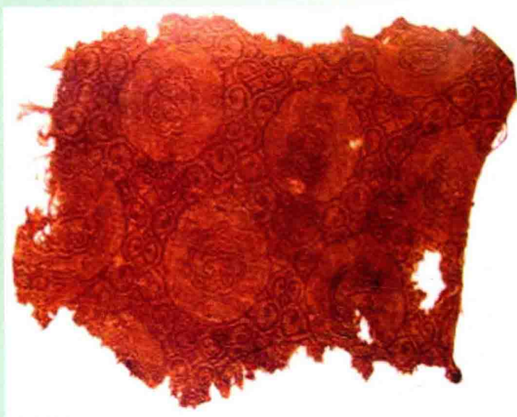
元代张家口一带回回织造局织造的织金西锦“纳失失”