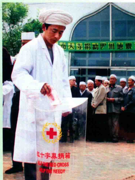
河北穆斯林为灾区捐款