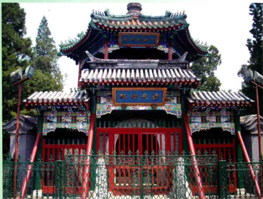
河北修建最早的清真寺——宛平冈上礼拜寺(北京牛街礼拜寺)