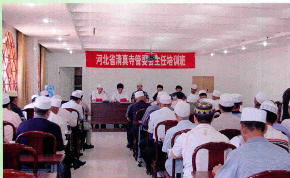
河北省伊协举办清真寺管委会培训班