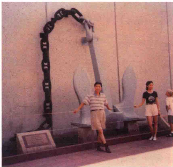
作者在被炸沉的亚利桑那号战舰原配巨锚前