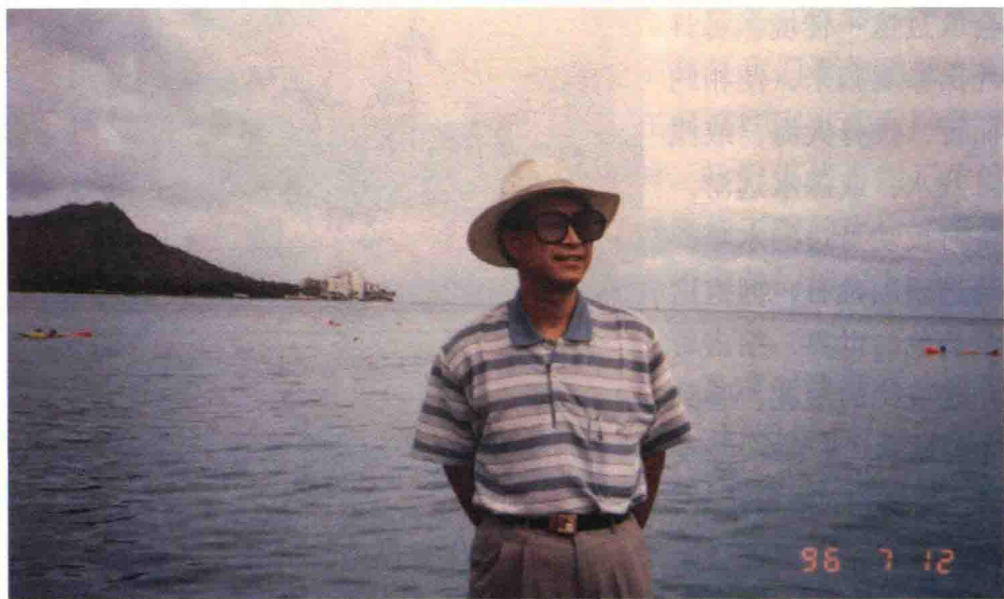
作者在夏威夷维基基海滩

在夏威夷，给我留下深刻印象的另一去处，当属大风口。它位于瓦胡岛东北部，面临悬崖，北倚林海，遥望大洋，陡壁对峙。独特的形胜组合，构成了终年云雾腾腾、狂风不止的奇特景观，成为不少探险者的“天然剧场”。