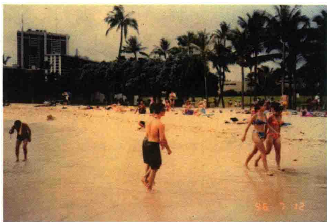
身着泳装的游人浴后在海滩上休闲

会放过这一佳境。每日外出参观归来，便相约而行，投身大海，或浅滩戏水，或深水远游，不时拨动身边的水草，绕过珊瑚礁石，拥抱这蔚蓝色的世界，拍击着此起彼伏的浪花，感到十分惬意。