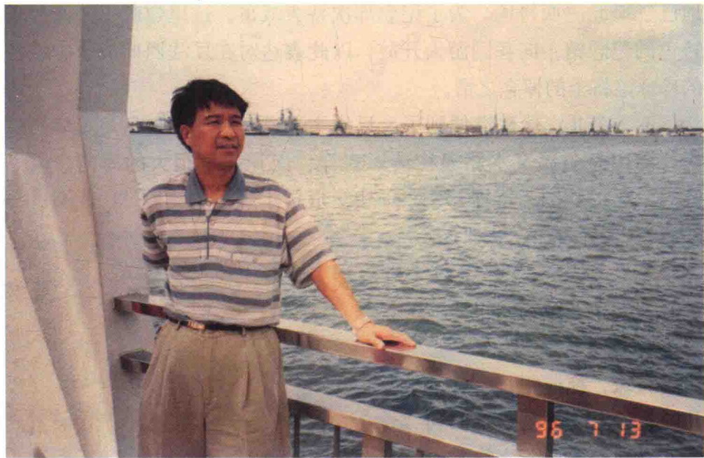
作者在珍珠港海湾

位于瓦胡岛南岸的珍珠港，曾是美国集海军、空军和太平洋舰队于一体的巨大军事基地，也是美国向太平洋地区进行战略扩张的重要中转站。1941年12月8日清晨，夏威夷市区灯火辉煌，夜总会乐声阵阵。在一派歌舞升平的气氛中，日本出动飞机、战舰400余架艘，以