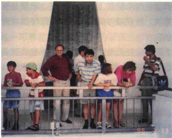
作者在亚利桑那号战舰博物馆内参观

士的姓名。虽然名字和文字都是我们不熟悉的，但在向这些殉难者默默致意时，我们仍然不能不为这些风华正茂的生命在毫无思想准备的情况下猝然沉亡而伤感。