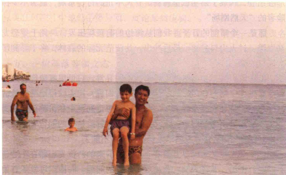
夏威夷维基基海滩浅海处，作者和小朋友在一起

海滩上，绿茵片片，树木葱翠，设立着双杠、沙滩排球等体育设施，供游人泳后锻炼。不同肤色的游人，男女老少，身着色彩纷呈的泳装，都在尽情地展示着自己的真实，在这天地合一之间，欢欣地沐浴着大自然的恩惠。人们也十分谦和，我在深水区游完上岸后，约请一个美国儿童一起拍照，他毫不怯生，愉快地答应了。