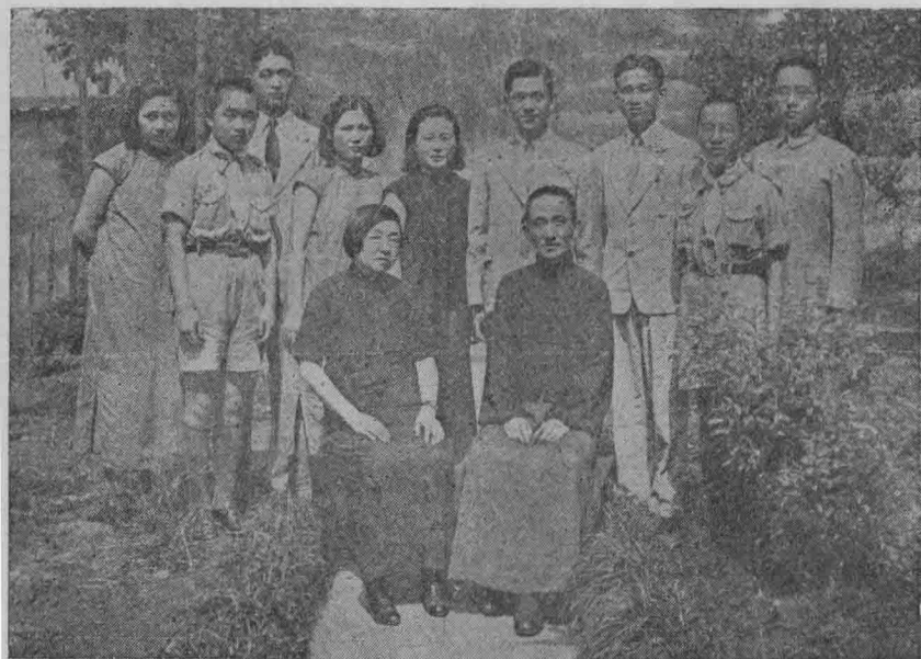
士女繁光王夫人陳 雷布陳 者生排前 礎女二 達子幼過吧二 務女長 譽世王 總長 蓮子長 過吧三 透兒六 滿兒五 左至右自前立後