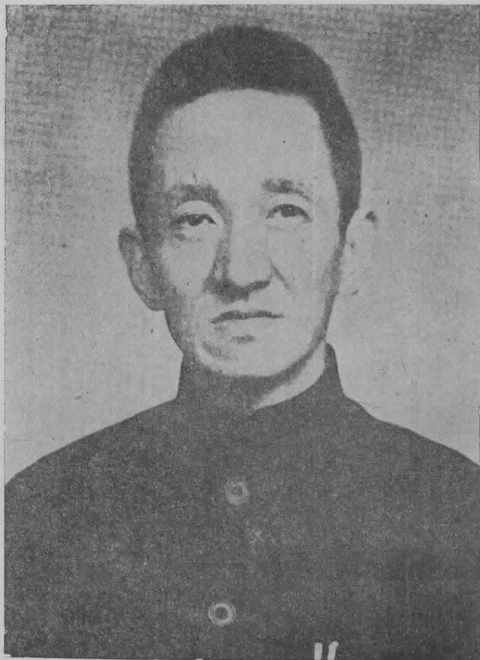
者作 (年七卅國民於攝)