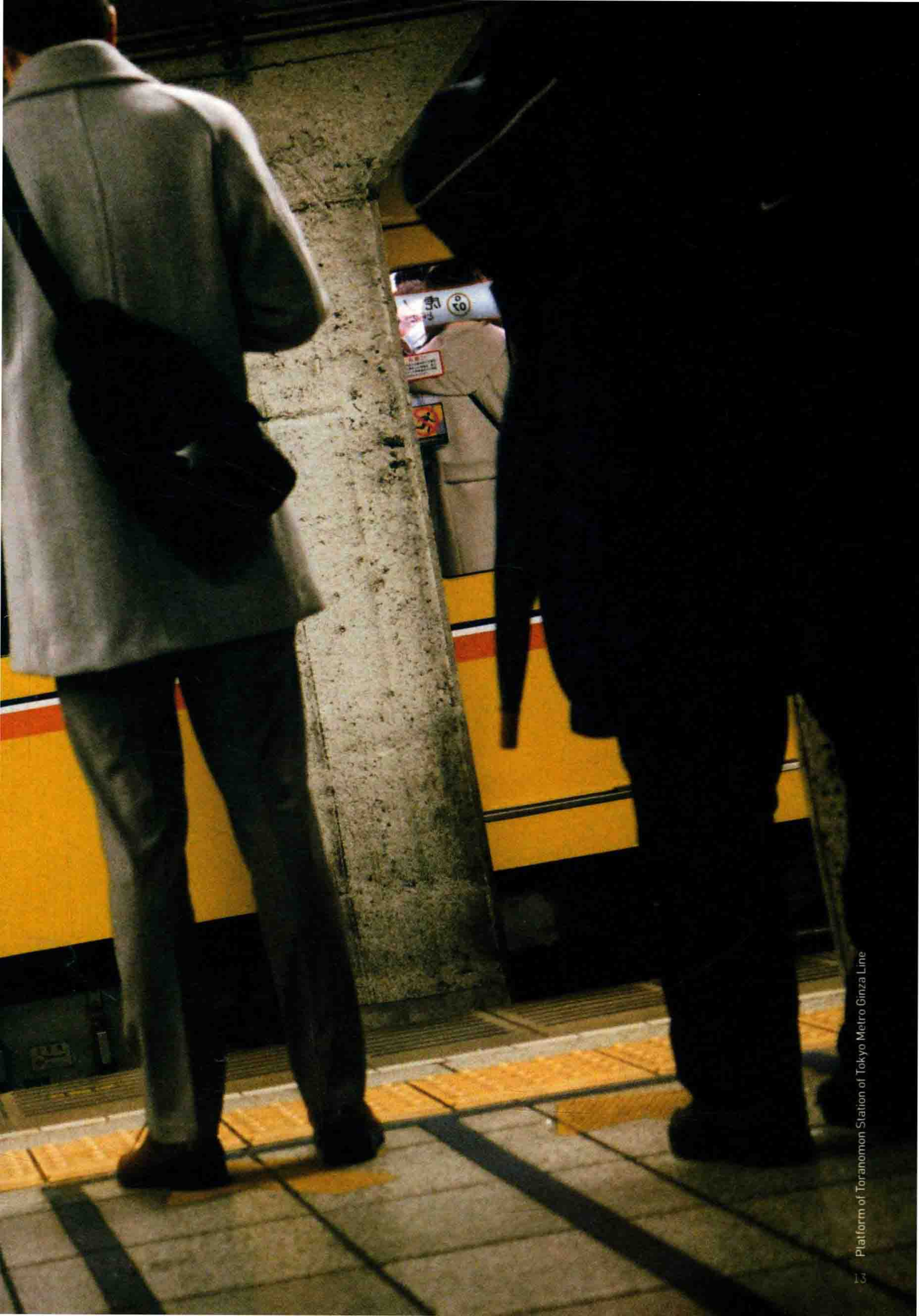
Platform of Toranomon Station of Tokyo Metro Ginza Line