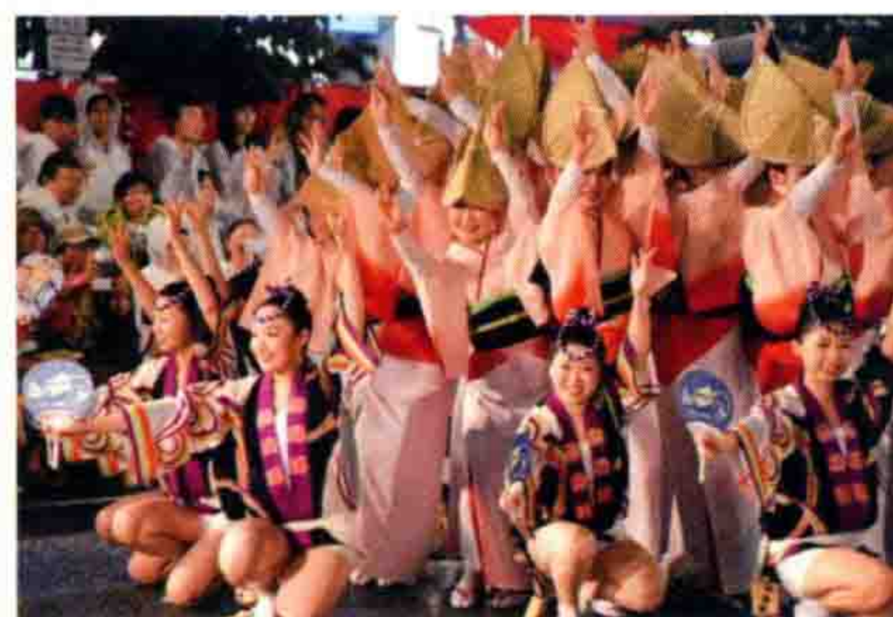
tekiiiiii 高圆寺的阿波舞, 尽管舞步和拍子都很简单, 大家一起打着拍子, 舞者们开心享受的样子。