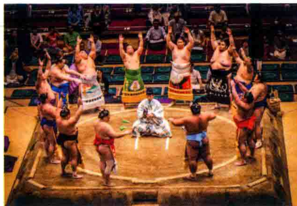
Rein Van 决战在即的相扑选手。