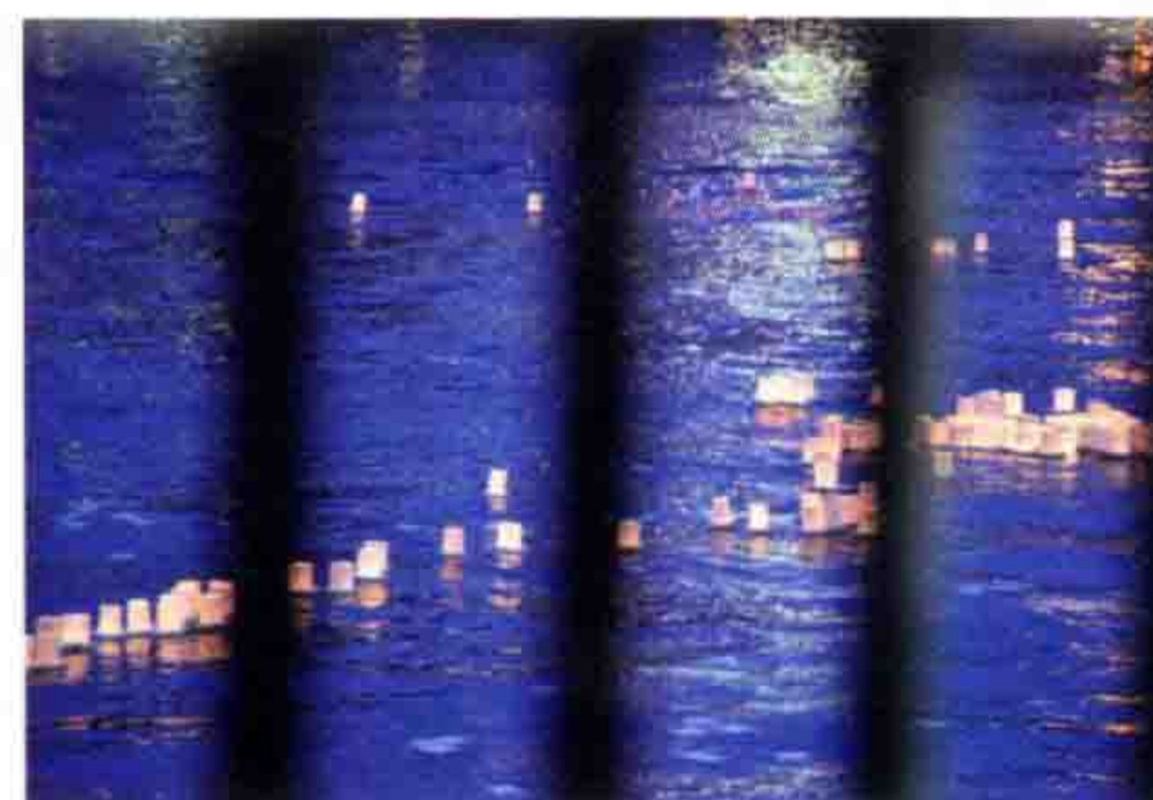
shu 浅草的“放水灯会”, 去晚了, 岸边的位置都被占了, 只能勉强透过缝隙观赏。