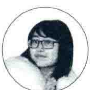
赵婷 Zhao Ting