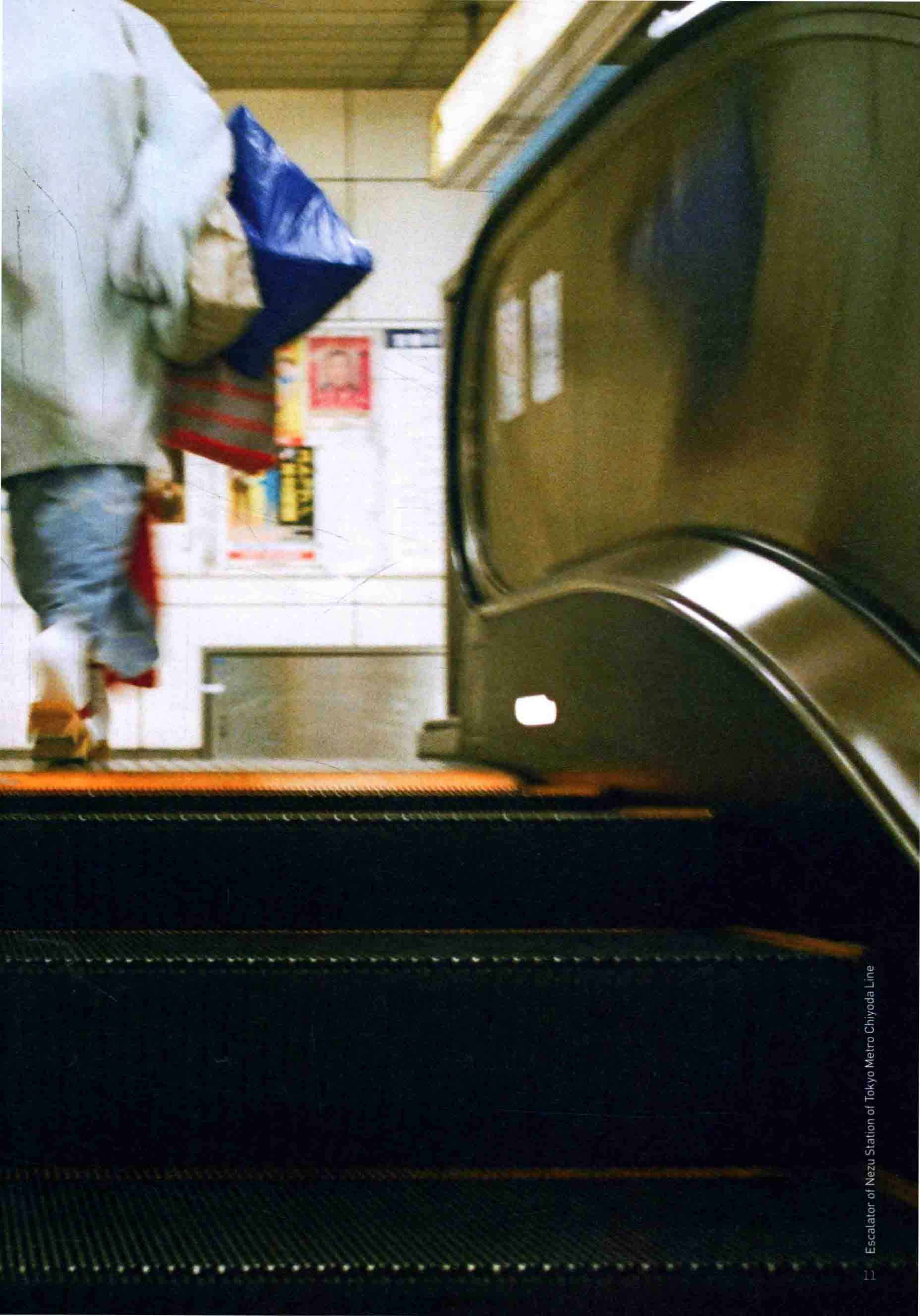
Escalator of Nezu Station of Tokyo Metro Chiyoda Line