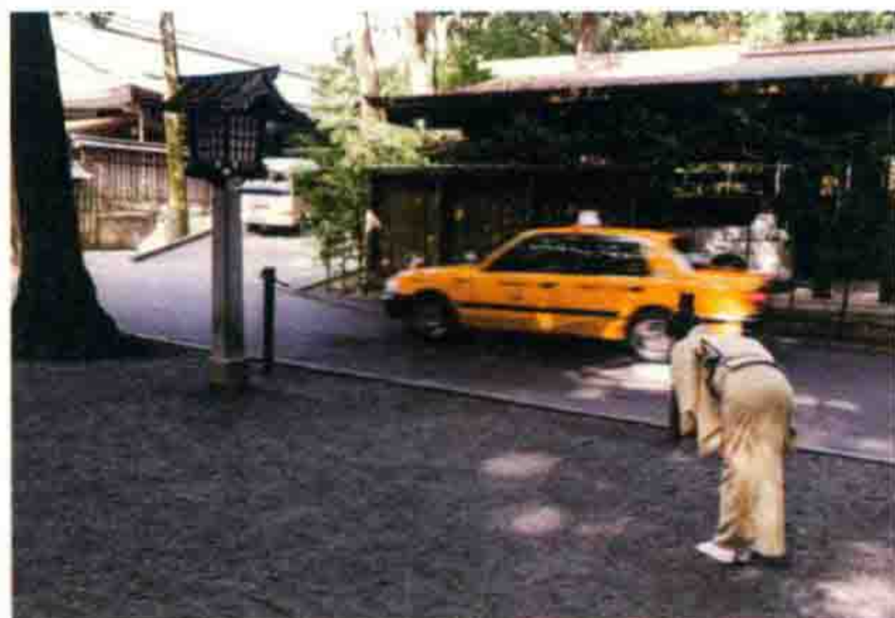
tranhhoa12 明治神宫外, 穿着和服的女士送走她的顾客。