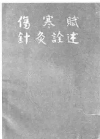
清江县人民医院内部刊行的《针灸论述》封面