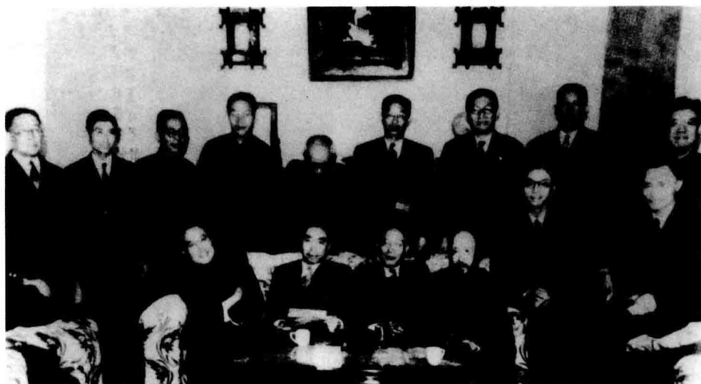
1946年10月19日，国共两党及第三方面代表在上海海格路（今华山路）吴铁城公馆举行谈判时的合影。前排左起：黄炎培、周恩来、郭沫若、沈钧儒、华岗、李璜。后排左起：胡霖、陈家康、陈启天、蒋匀田、邵力子、罗隆基、吴铁城、李维汉、左舜生。