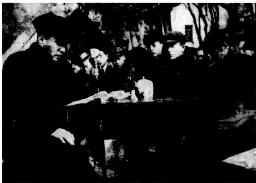
1952年在山东大学给学生上政治大课