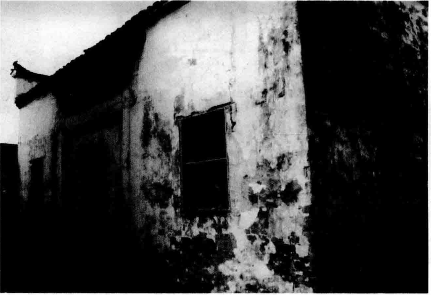
华岗故居,浙江龙游县庙下乡