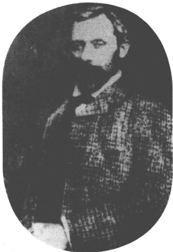
▲英国传教士李德立