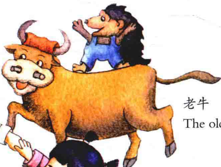
老牛 The old cow