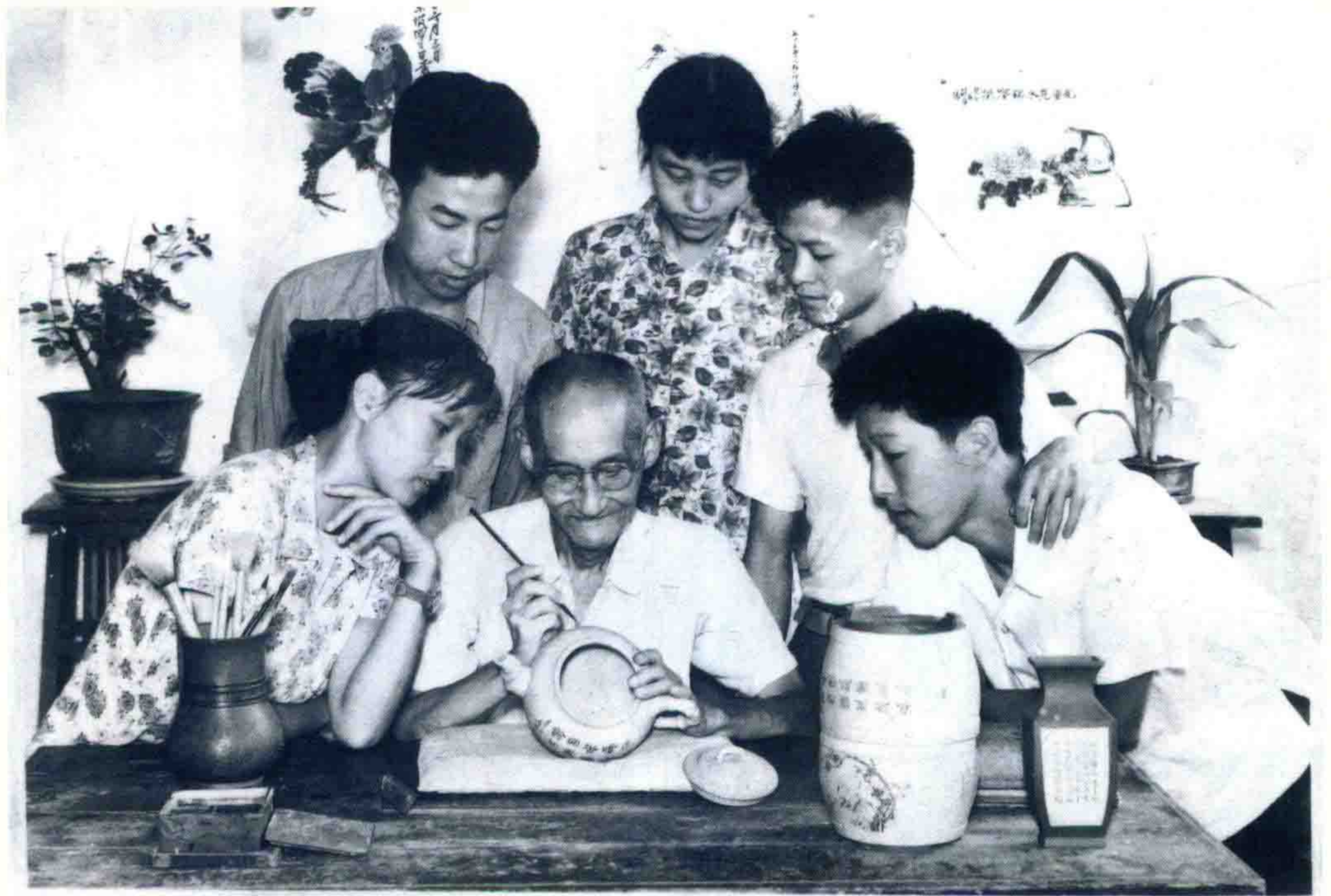
江苏省宜兴陶瓷公司