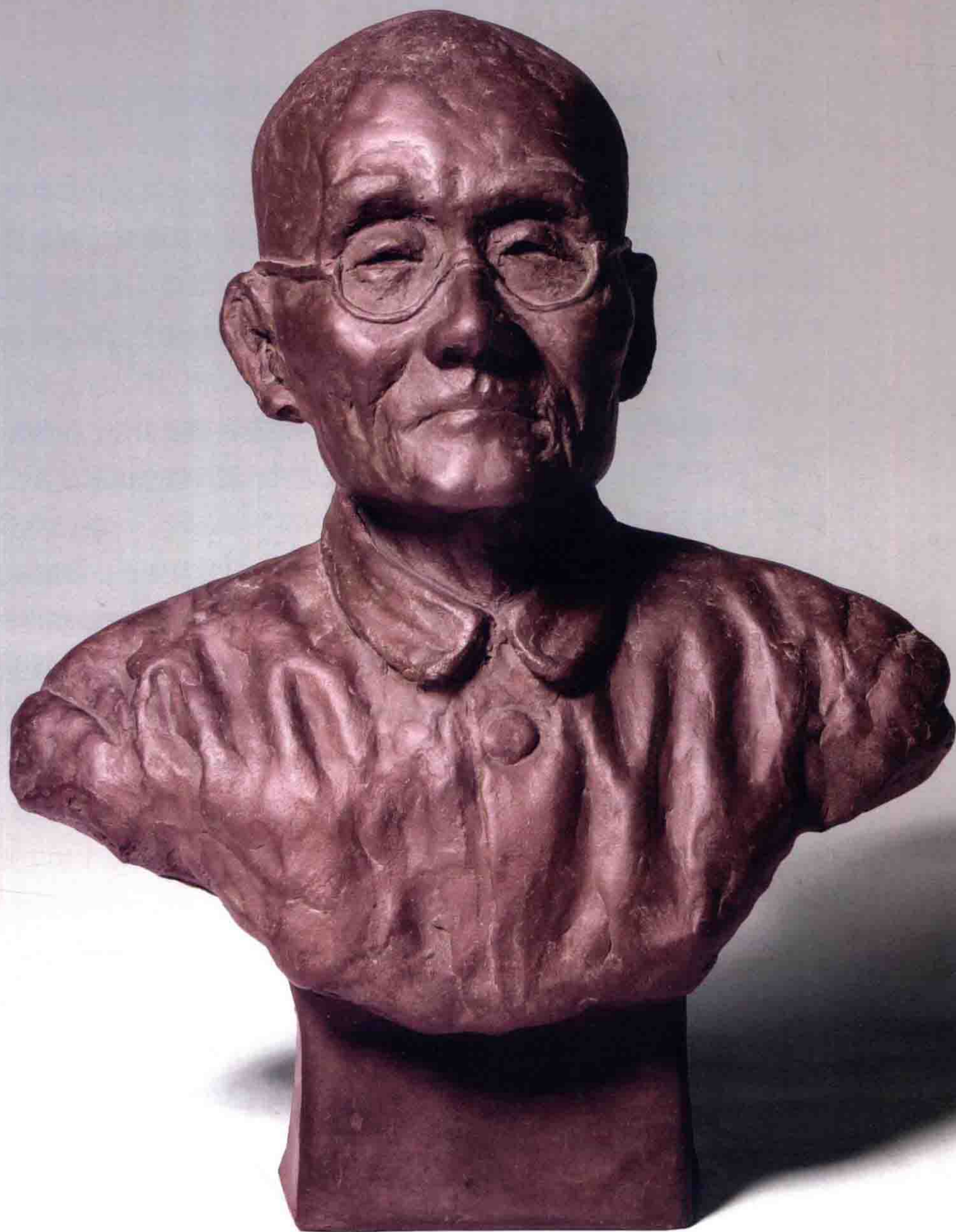
任淦庭像 创作年代：1955年 尺寸：高21厘米