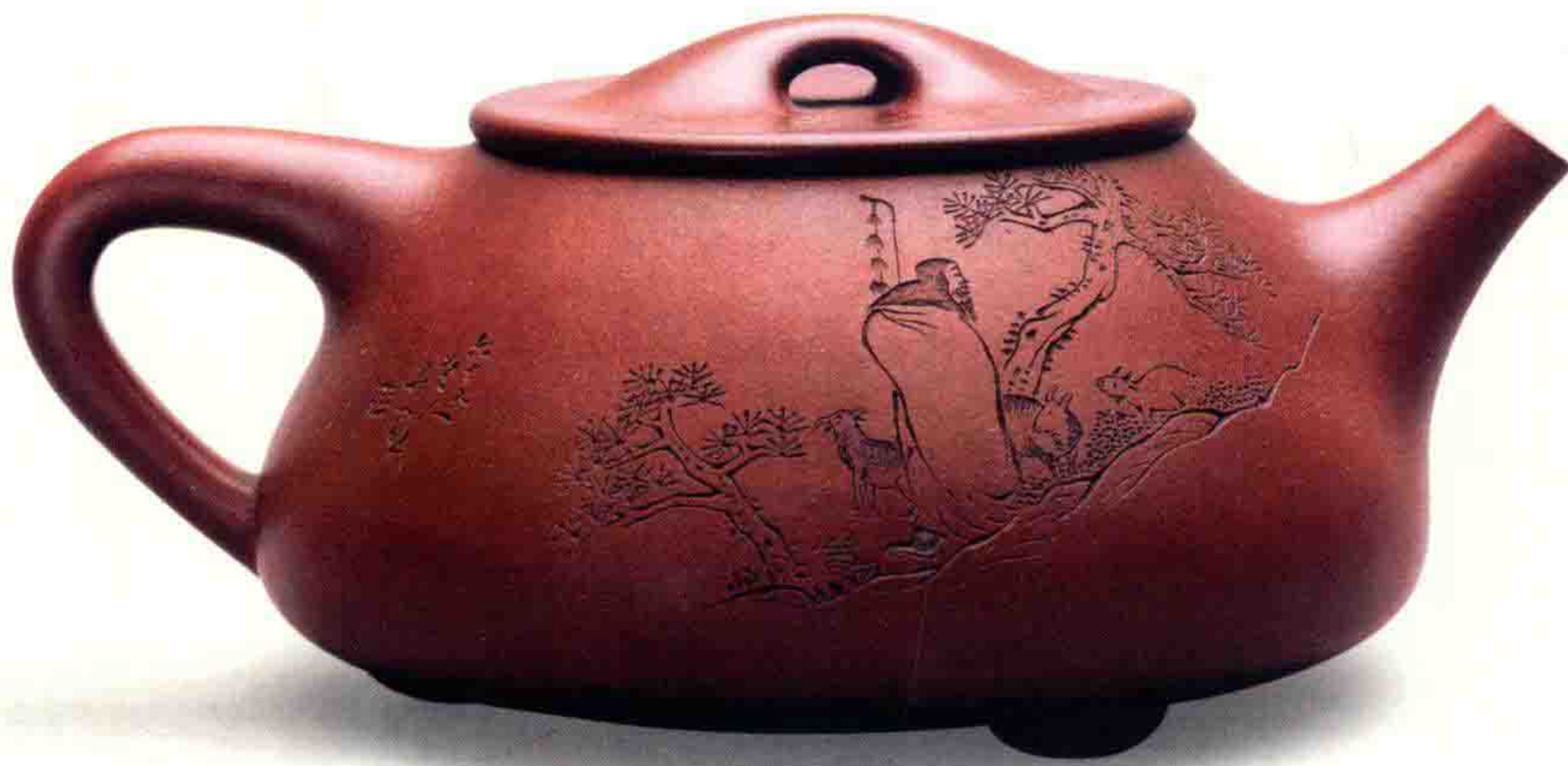
任淦庭陶刻顾景舟石瓢壶