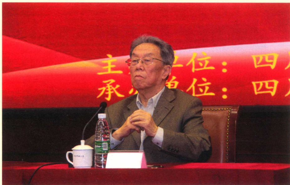
2017年4月，王蒙在四川省“公务员大讲堂”第四期作“文化与自信”的讲座