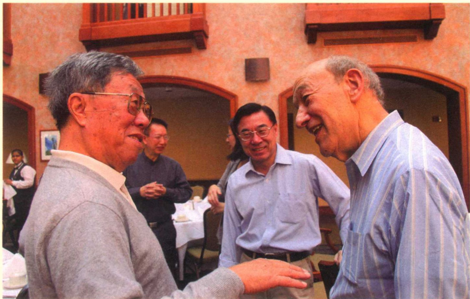
2010年9月24日，王蒙在哈佛大学对话美国著名汉学家、原远东和太平洋研究中心主任傅高义（右一）