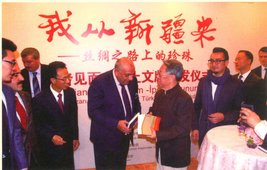
2015年11月26日,《我从新疆来——丝绸之路上的珍珠》读者见面会在土耳其国家图书馆举行。图为王蒙向出席仪式并讲话的土政府副总理图尔凯什赠送他新疆题材的小说《这边风景》