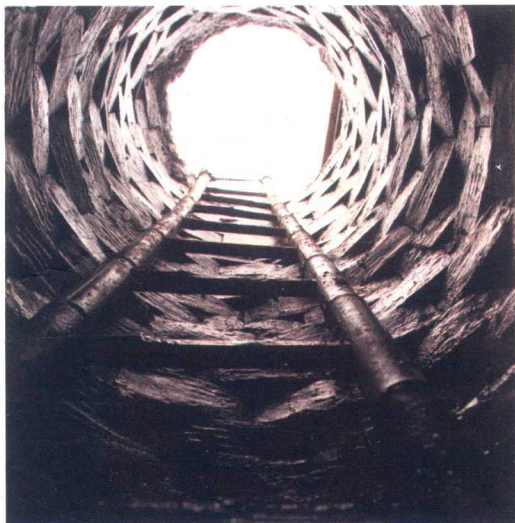
图6 唐代砖井 J21

水井是人类开发和利用地下水资源的主要设施，先民们聚井而居，共井为邻，因此“井”成为中国古代村落、乡间的代名词，中国古代成语也有“背井离乡”的说法。同时，村庄、城镇中的水井还是公共生活空间，家家户户都要到井边汲水，并经常在井旁相遇，于是便将货物带到井边上进行交易，久而久之便形成了“处商必就市井”的风俗。青龙镇遗址发现的水井多以砖砌为主。以唐代水井 J21 为例进行说明，井口平面呈圆形，井身上部呈上大下小的漏斗状，下部笔直，直径 0.7、深 4.5 米（图 6）。井壁用小青砖错缝竖砌，磨砖对缝，对接处用榫卯套合。在井壁的一些砖面上还可以见到拍印的手印纹（图 7）。井内出土有唐代鸚鵡衔枝绶带纹铜镜、