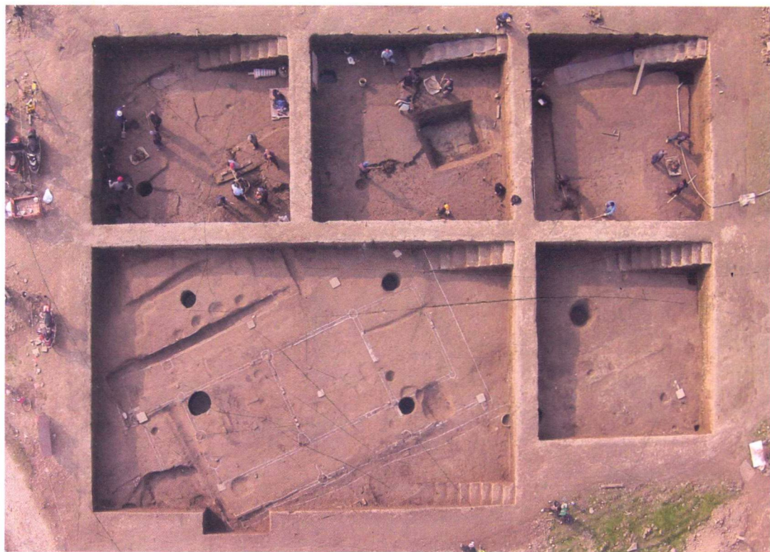
图5 宋代房屋基址 F6