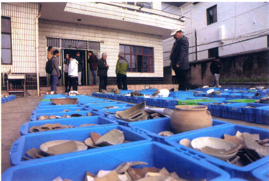
图 15 青龙镇遗址出土部分可复原瓷器

主要为闽江流域的产品，共计有 20 余个窑口，其中以闽清窑、东张窑、磁灶窑、同安窑、建窑、浦口窑、遇林亭窑、怀安窑等窑口为主。据文献记载，青龙镇海上贸易十分繁盛，“自杭、苏、湖、常等州月日而至，福建、漳、泉、明、越、温、台等州岁二三至，广南、日本、新罗岁或一至”。青龙镇遗址考古出土的瓷器数量巨大，窑口丰富，且与目前朝鲜半岛和日本考古发现的器物组合十分相似，考古发现与文献相印证，证明了青龙镇是海上丝绸之路重要的贸易港口之一。