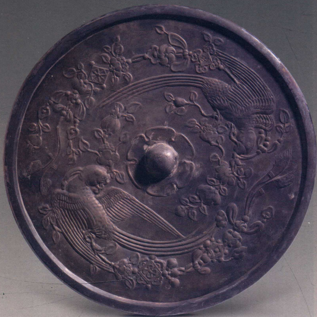
图 8 J21 唐鸚鵡衔枝绶带纹铜镜