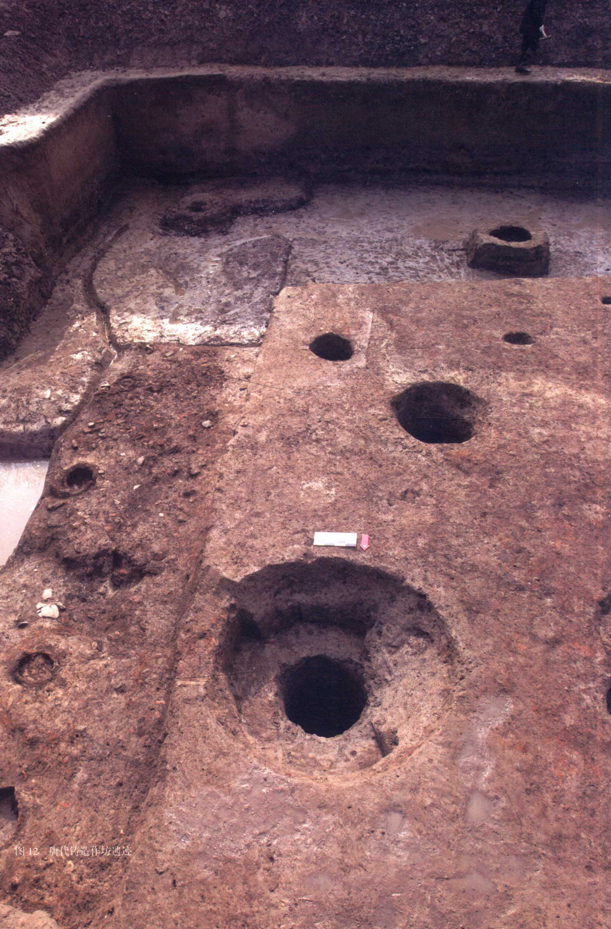
图 12 唐代铸造作坊遗迹