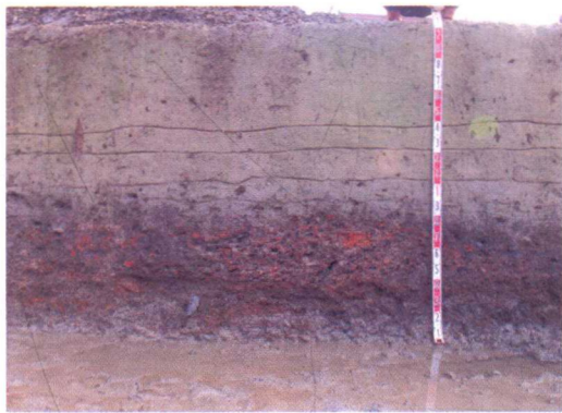
图9 陶范及炉渣堆积