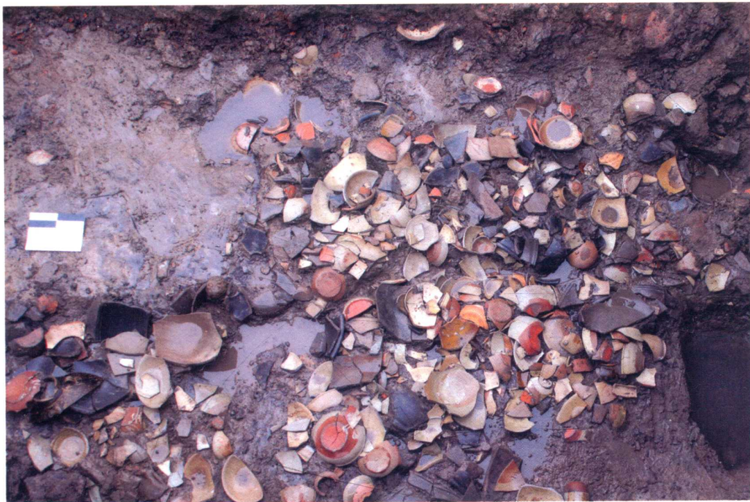
图 14 唐代瓷片堆 CD1