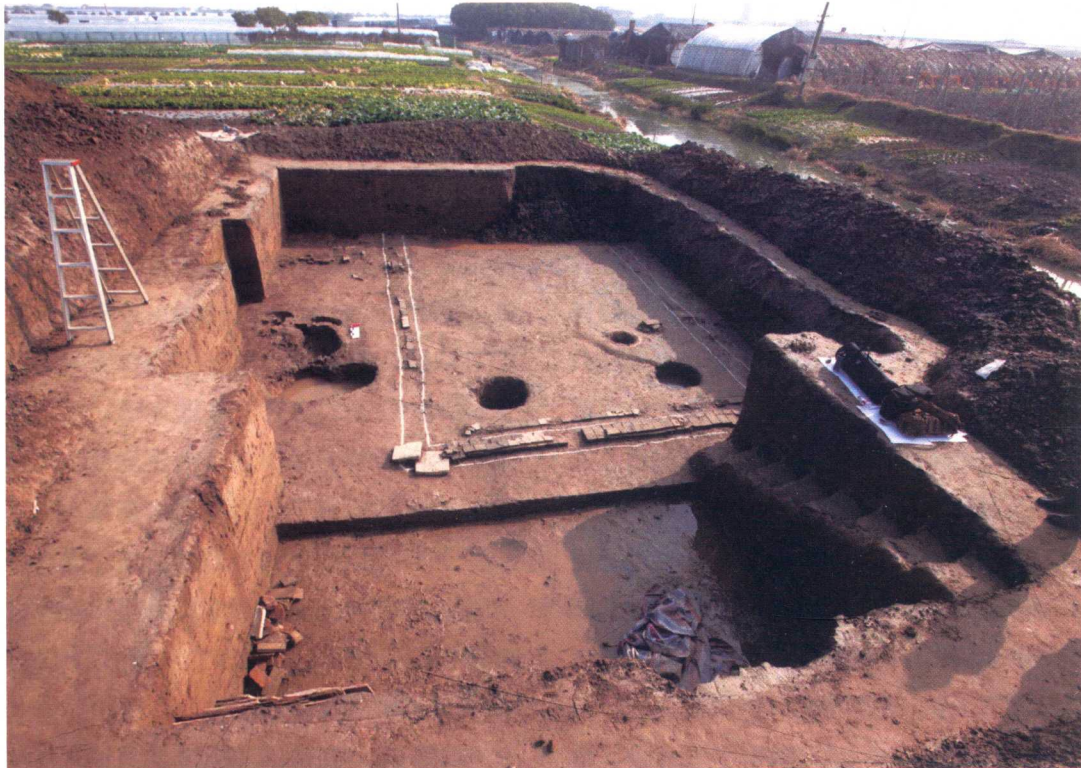
图4 唐代房屋基址 F5

水井是人类开发和利用地下水资源的主要设施，先民们聚井而居，共井为邻，因此“井”成为中国古代村落、乡间的代名词，中国古代成语也有“背井离乡”的说法。同时，村庄、城镇中的水井还是公共生活空间，家家户户都要到井边汲水，并经常在井旁相遇，于是便将货物带到井边上进行交易，久而久之便形成了“处商必就市井”的风俗。青龙镇遗址发现的水井多以砖砌为主。以唐代水井 J21 为例进行说明，井口平面呈圆形，井身上部呈上大下小的漏斗状，下部笔直，直径 0.7、深 4.5 米（图 6）。井壁用小青砖错缝竖砌，磨砖对缝，对接处用榫卯套合。在井壁的一些砖面上还可以见到拍印的手印纹（图 7）。井内出土有唐代鸚鵡衔枝绶带纹铜镜、