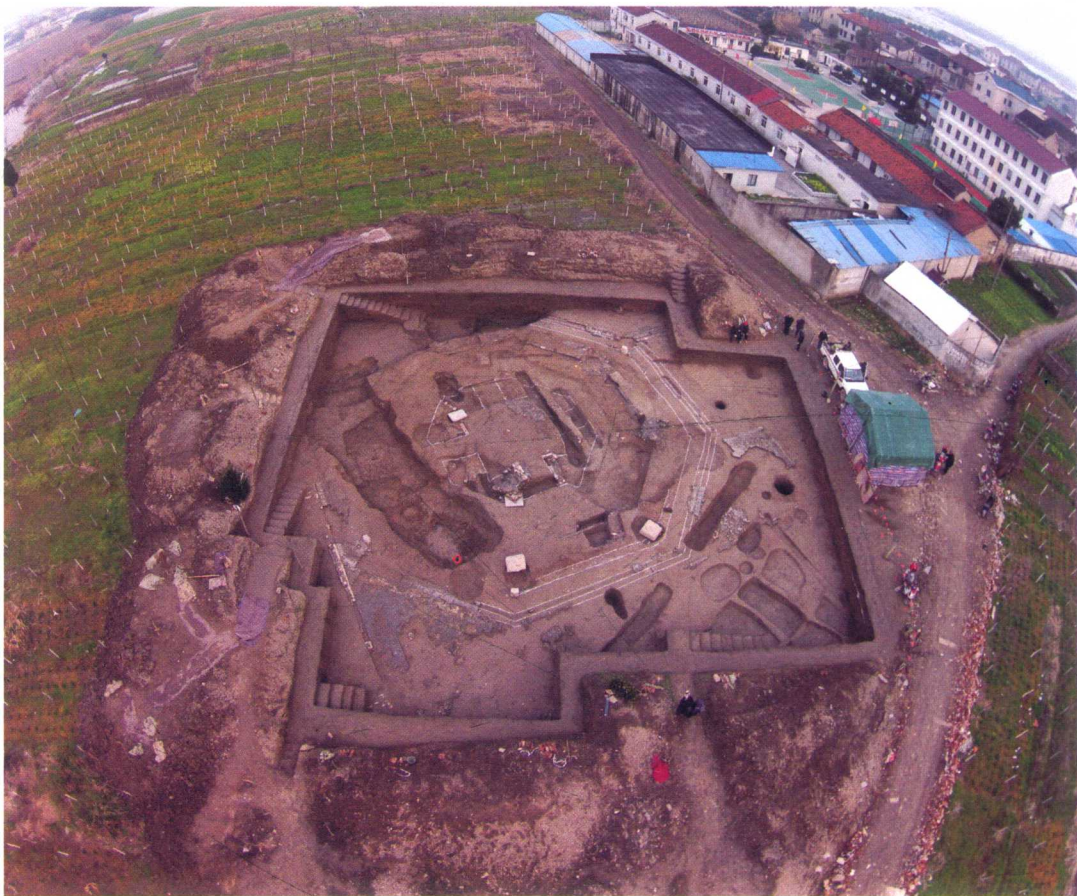
图 13 隆平寺塔基航拍图