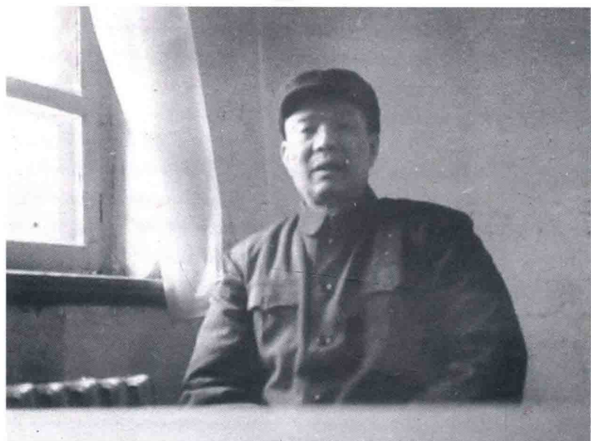
文化大革命时期在北京受到“保护”的陈光，1973年3月。