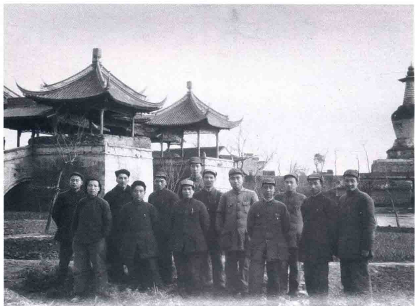
接管扬州时与同志们在瘦西湖。