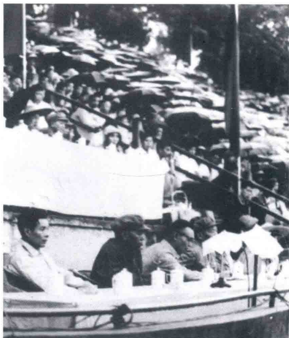
在文化大革命中， 1966年。