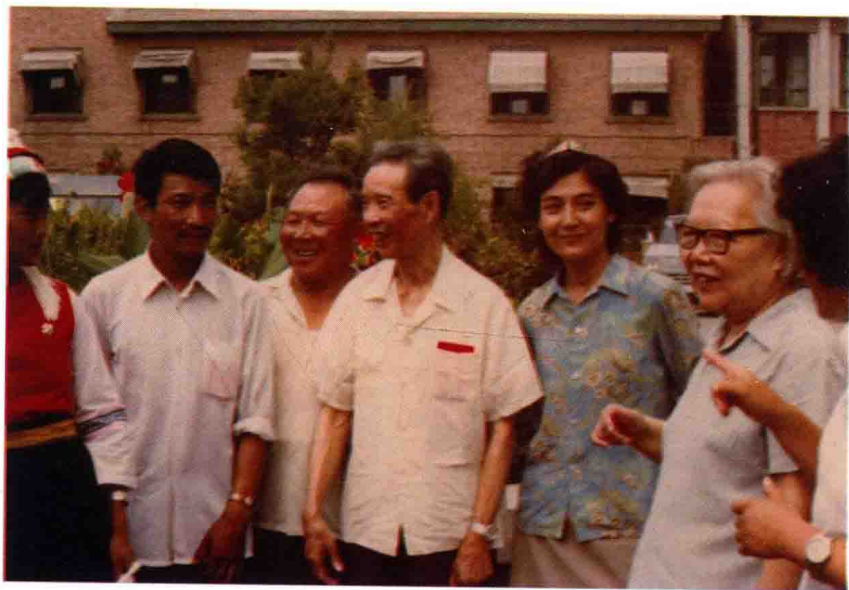
在民政部工作期间与少数民族同胞亲切交谈。