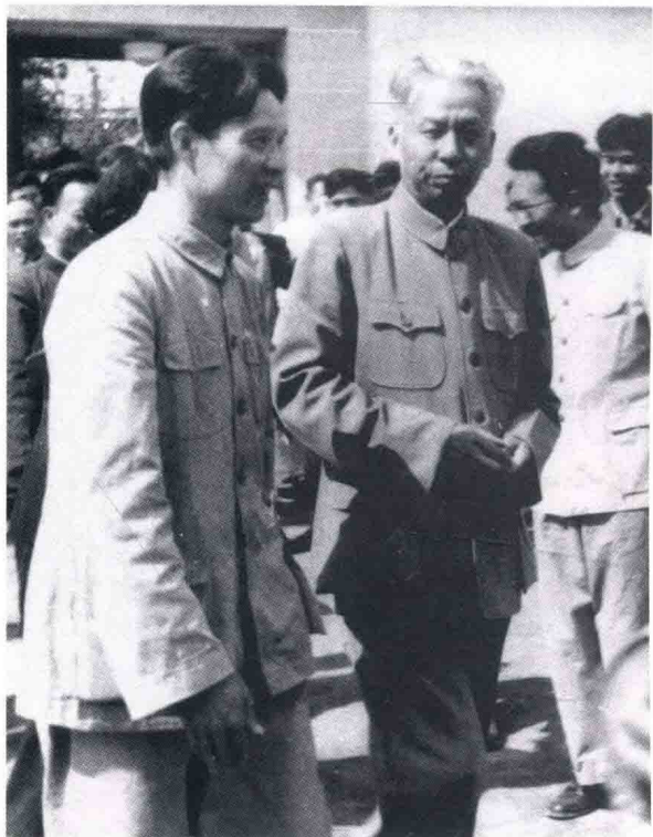
1962年3月5日，毛泽东视察南京，在人民大会堂接见军队师以上干部和江苏省党代会全体代表。左起：惠浴宇、刘顺元、王平、毛泽东、许世友、江渭清、陈光。（上图）