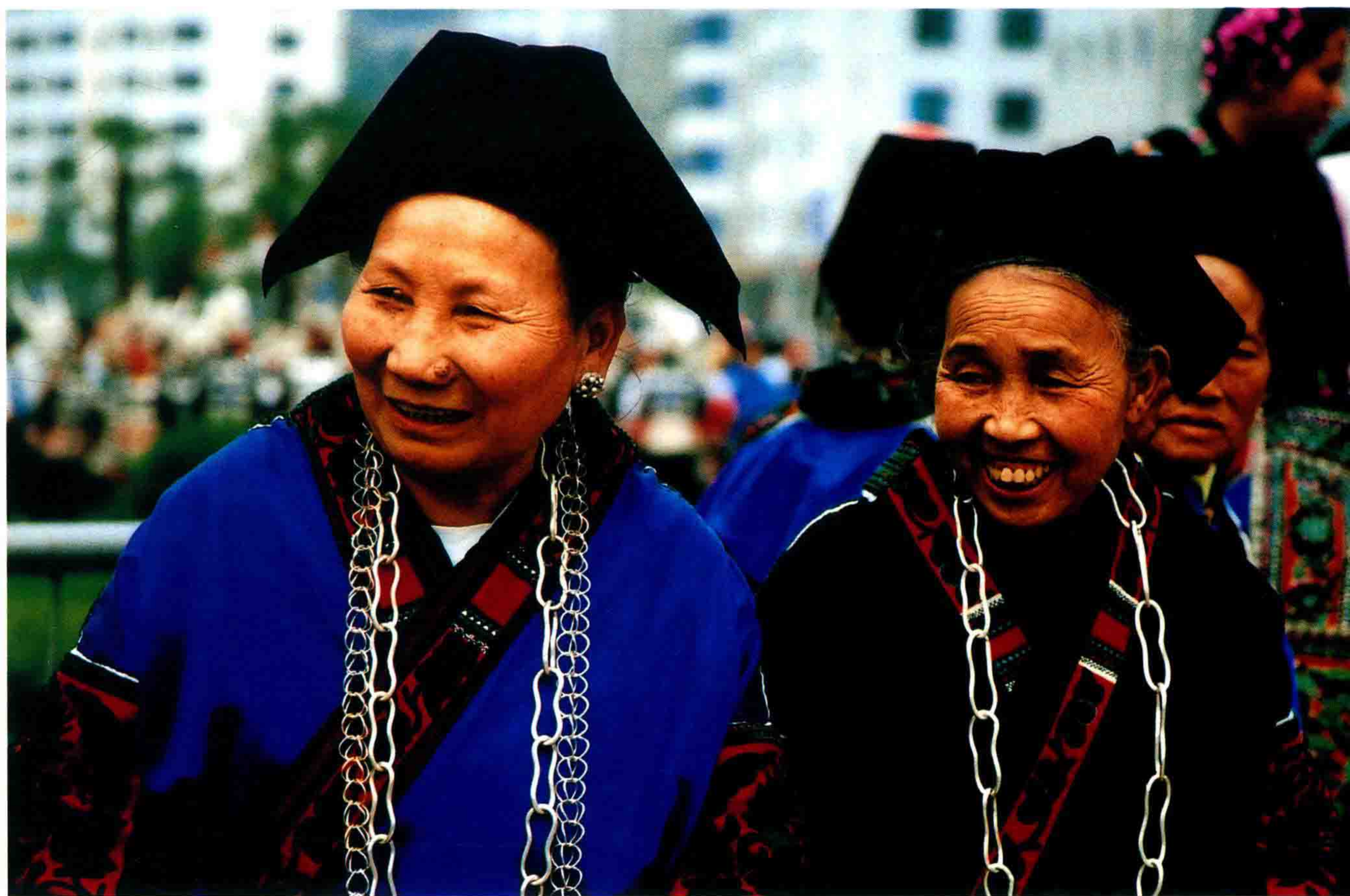
苗族中老年妇女的盛装较为朴实庄重，台江县台拱地区中老年妇女的服饰和银饰都比年轻人简洁。