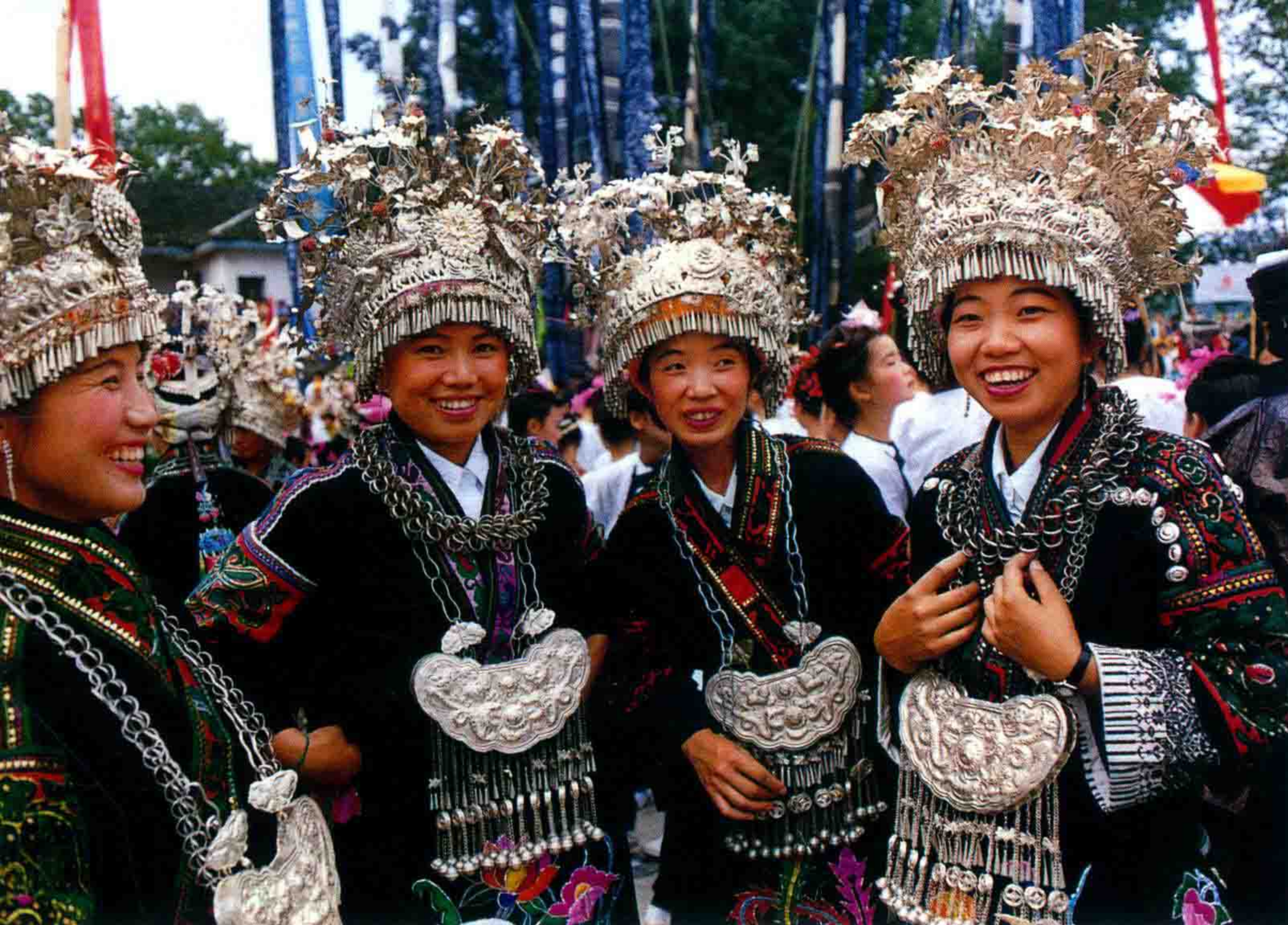
身着盛装的榕江县小丹江苗族妇女参加节日庆典。