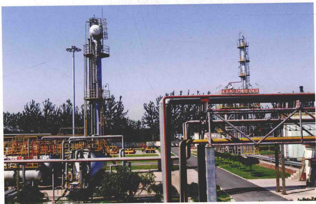
中国石油天然气集团公司百个标杆单位——永清天然气处理站