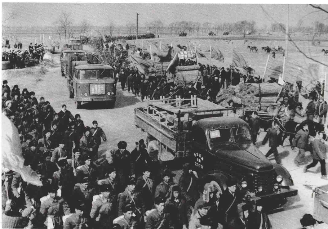
1976年2月，石油化学工业部向胜利、吉林、长庆、江汉、四川等油田发出“关于派出队伍参加冀中地区石油会战的通知”，参加会战的队伍相继汇集冀中平原场景