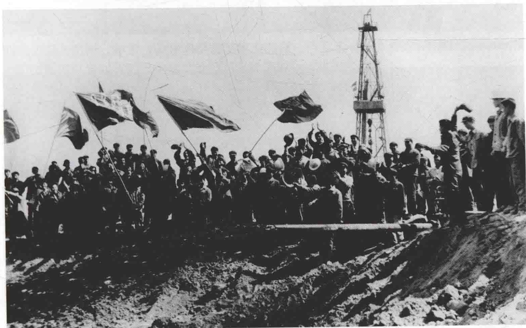
1975年7月3日，华北油田发现井——任四井钻探成功，9月，经大型酸化后试油，获日产1014吨高产油流。这一重大发现揭开了华北石油会战的序幕，找到了中国第一个碳酸盐岩古潜山大油田——任丘油田。上图为任四井。下图为任四井喷油场面