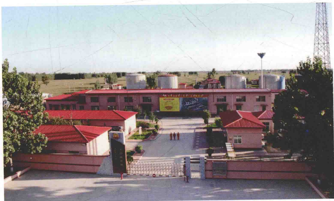
中国石油天然气集团公司百个标杆单位——王四联合站