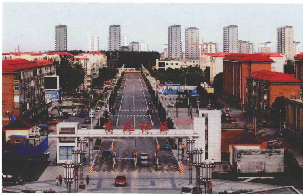
功能配套齐全的华北油田东风社区