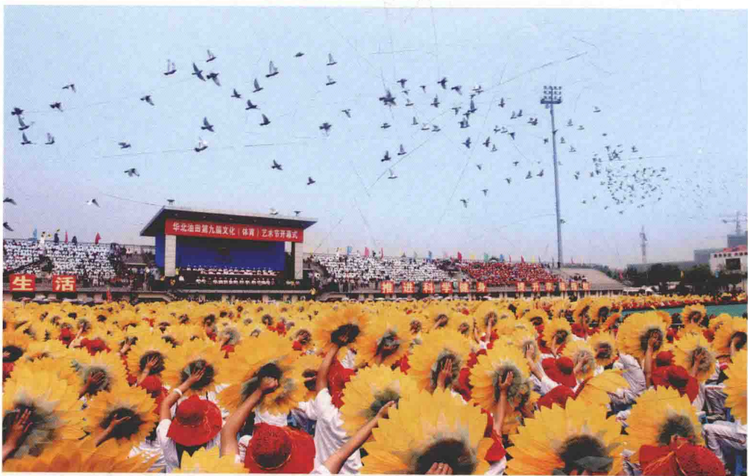
华北油田公司每年举办文化(体育)艺术节