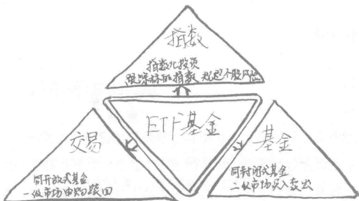
图 1.1 ETF=交易+指数+基金