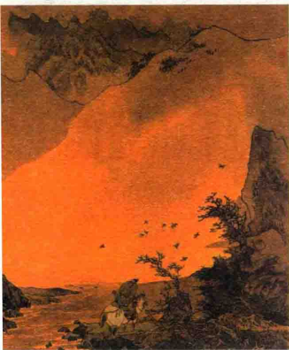
辛弃疾(1140—1207),字幼安,号稼轩,南宋豪放派词人。

满地黄花堆积。憔悴损,如今有谁堪摘?守着窗儿,独自怎生得黑?梧桐更兼细雨,到黄昏、点点滴滴。这次第,怎一个愁字了得!