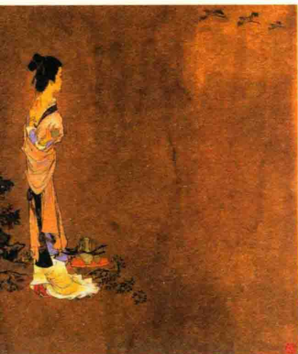
李清照(1084—1155),号易安居士,宋代女词人,婉约词派代表。