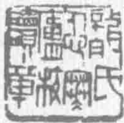
龍氏忍寒廬校讀章