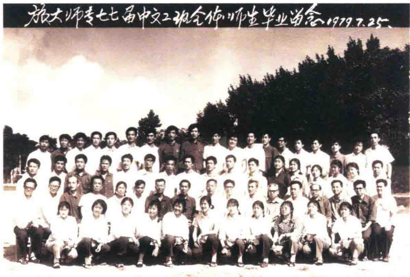
旅大师范专科学校七七届中文二班全体师生毕业留念